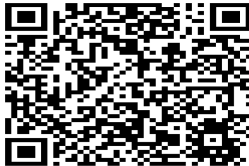
Gambar 4. Tampilan QRcode Dokumen

QR Code merupakan singkatan dari quick response code atau barcode dua dimensi yang di dalamnya memuat berbagai jenis informasi. QR Code dapat digunakan sebagai validasi dokumen karena di dalamnya dapat disisipi berbagai informasi yang menunjukkan keaslian atau kevalidan suatu dokumen atau surat.