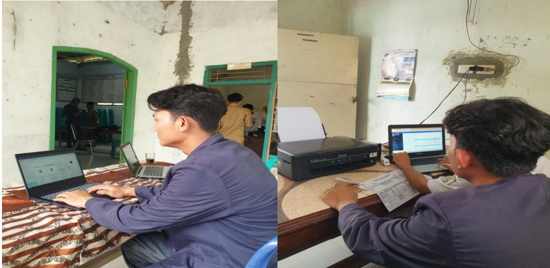
Gambar 2. Pengerjaan Paperless Office

penyimpanan maupun mengakses dokumen file. Dokumen akan diubah menjadi QRcode untuk memudahkan berbagi dokumen kepada pemerintah desa maupun ke masyarakat yang membutuhkan dokumen akan dikirimkan secara digital QRcode.