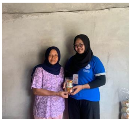
Gambar 1.3 Pembuatan kemasan pada UMKM Dapur Mama Ella

Pembuatan kemasan atau packaging adalah sebuah inovasi yang saya lakukan pada UMKM Dapur Mama Ella dengan membuat kemasan plastik pouch pada produk agar lebih bagus dan menarik jika dipasarkan ke pasar yang lebih besar dan luas. Kemasan juga mempengaruhi konsumen dalam mengambil keputusan pembelian oleh sebab itu kemasan sering dikatakan sebagai silent salesman sebagai promosi produk yang dirancang untuk meningkatkan penjualan yang sifatnya tidak terlalu disadari tapi sangat berpengaruh. Salah satu contoh silent salesman yang cukup efektif adalah melalui pemilihan packaging yang menarik. Kemasan berfungsi sebagai wadah, sarana distribusi, dan sarana pemasaran sehingga desain kemasan harus disesuaikan dengan produk yang dikemas dan segmen pasar yang dituju. Kemasan juga dapat sebagai identitas bagi UMKM Dapur Mama Ella dalam memasarkan produk keripik manggleng.