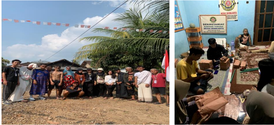
Gambar 1.9 Perlombaan dan Pembungkusan Hadiah Perlombaan HUT RI