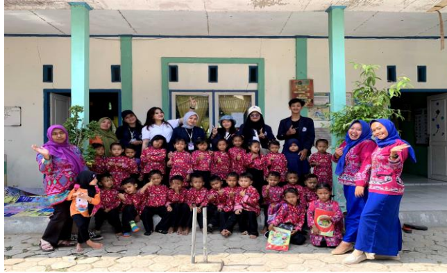
Gambar 1.13 Foto Bersama Guru dan Murid di PAUD Al-Baraqah