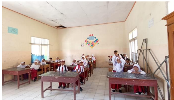
Gambar 1.14 Kegiatan Belajar Mengajar di MI

Pada kegiatan ini selain menjalankan program kerja tentang pendidikan juga sebagai bentuk silaturahmi. Dalam kegiatan ini kami memberikan bantuan terhadap guru guru untuk ikut serta mengajar siswa/I Madrasah Ibtidaiyah.