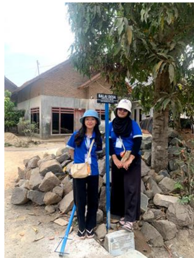
Gambar 1.12 Gotong Royong dan Pemasangan Plang