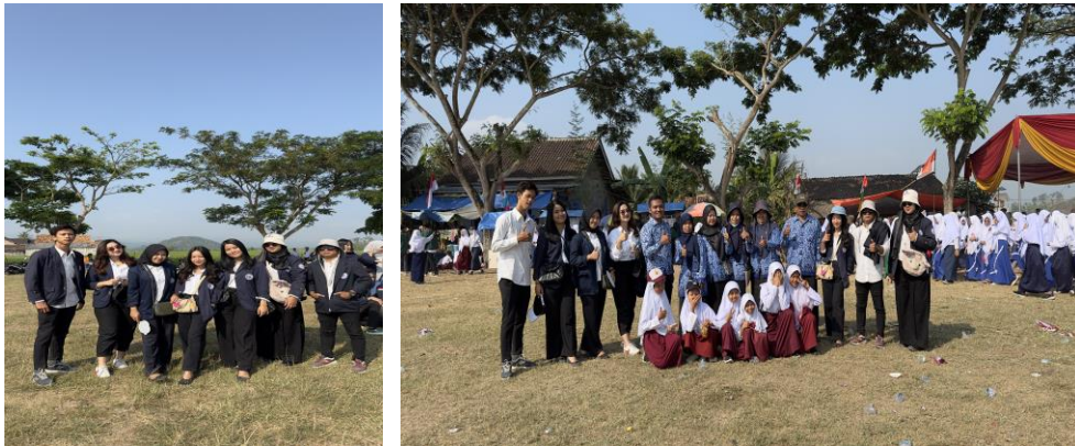
Gambar 1.8 Upacara HUT RI

Upacara HUT-RI untuk memperingati hari kemerdekaan Bangsa Indonesia, Upacara Peringatan Detik-Detik Proklamasi Kemerdekaan Bangsa Indonesia dan Pengibaran Sang Merah Putih di tingkat Desa. Upacara bendera dapat meningkatkan sikap kebersamaan dan persatuan di sekolah maupun di Desa, karena dengan adanya Upacara Bendera membuat semua peserta upacara yang akan senantiasa bersama-sama mengikuti aba-aba dan arahan dari pemimpin upacara untuk berpakaian seragam, sehingga menunjukkan sikap kebersamaan. upacara membuat semua peserta upacara mengingat perjuangan para pahlawan yang telah gugur. Serta pengadaan kegiatan perlombaan baik tingkat Rt, Dusun, instansi bahkan perorangan guna memeriahkan Kemerdekaan Indonesia yang memang sudah sangat dinantikan oleh warga Desa Tanjung Rejo karna beberapa tahun ini kita semua melakukan upacara bahkan perlombaan pun secara online karna dampak dari Covid-19 ini. Maka dari itu saat ini diadakan kegiatan yang sangat meriah di desa Tanjung Rejo serta penampilan Kuda Jaranan untuk memriahkan HUT RI Ke 78.