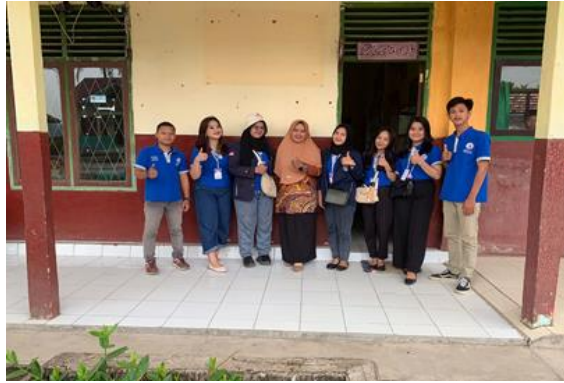
Gambar 1.16 Foto Bersama Kepala Sekolah di SD N 8 Way Khilau

Pada kegiatan ini selain menjalankan program kerja tentang pendidikan juga sebagai bentuk silaturahmi. Dalam kegiatan ini kami memberikan beberapa materi tentang kenakalan remaja, narkoba dan ikut serta dalam memberikan materi pembelajaran.