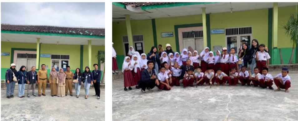
Gambar 1.15 Foto Bersama Guru dan Murid di MI