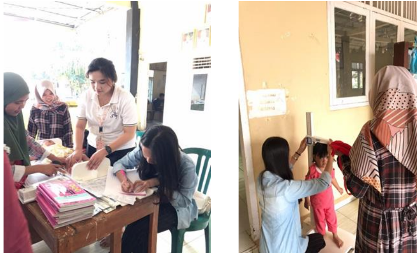
Gambar 1.11 Kegiatan Posyandu