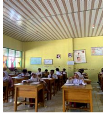
Gambar 1.17 Kegiatan Belajar Mengajar di SD N 8 Way Khilau