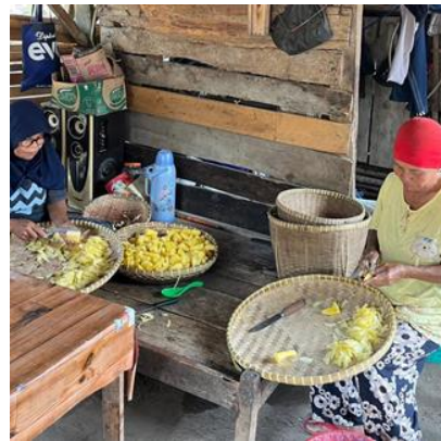
Gambar 1.6 Proses Pengupasan Kulit Singkong dan Pematangan Singkong