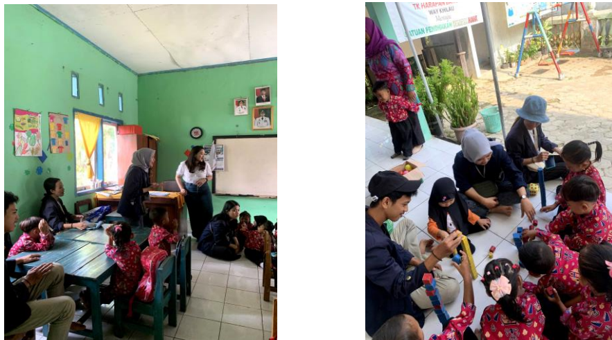
Gambar 1.12 Kegiatan Belajar Mengajar di PAUD Al-Baraqah

Pada kegiatan ini selain menjalankan program kerja tentang pendidikan juga sebagai bentuk silaturahmi. Dalam kegiatan ini kami memberikan beberapa lagu pembelajaran tentang matematika dan juga tentang bahasa inggris, selain itu kami juga melakukan pendampingan pembelajaran bersama guru PAUD dan menari bersama anak-anak guna melatih konsentrasi, sosialisasi dan ketanggapan anak terhadap keadaan sekitar.