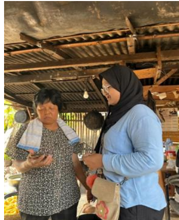
Gambar 1.4 Pelatihan Pembuatan Akun SiMoniK

bawah Binaan Dinas Koperasi dan UMKM Pesawaran. Pembuatan akun SiMonik Pesawaran juga dapat mempermudah konsumen untuk mencari oleh-oleh khas pesawaran terutama keripik manggleng UMKM Dapur Mama Ella. SiMonik juga merupakan strategi pemasaran sebagai media dan sarana untuk menjual dan memasarkan produk pada UMKM Dapur Mama Ella