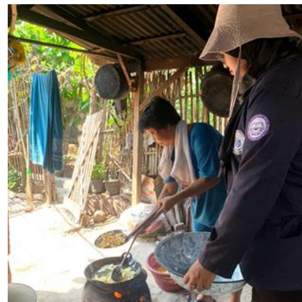
Gambar 1.7 Proses Penjemuran Singkong dan Penggorengan Singkong