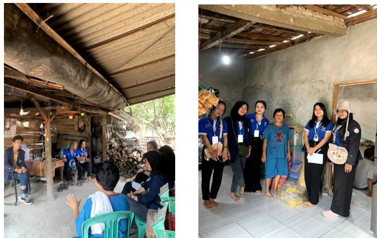
Gambar 1.1 Survei UMKM

Survei ini dilakukan untuk mengetahui bagaimana strategi pemasaran yang dibutuhkan oleh pemilik UMKM Keripik Manggleng, selain itu survei juga merupakan tahapan awal sebelum merancang dan melaksanakan sebuah strategi dalam pemasaran juga dalam pengembangan inovasi pada produknya. Dengan dilakukan survei kita dapat mengetahui kebutuhan dan kendala-kendala yang ada pada saat produksi dan pada saat penjualan, dan kita dapat merancang program pembaharuan dan serta pengembangan inovasi yang akan dilaksanakan dan sesuai dengan kebutuhan pihak terkait.