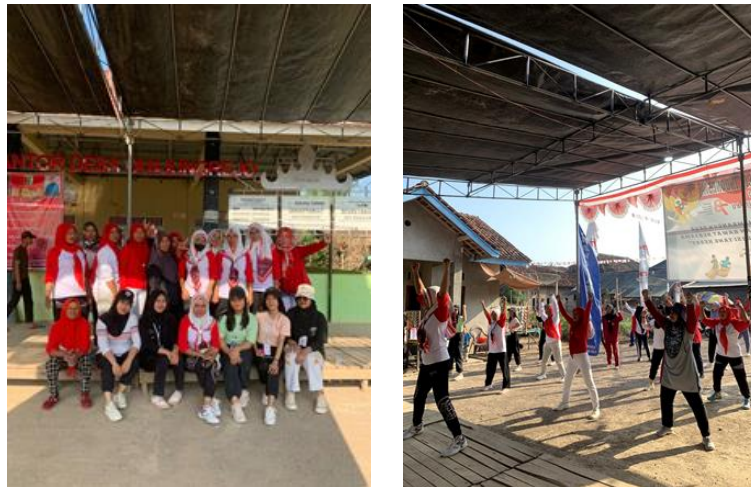
Gambar 1.10 Senam bersama ibu-ibu

Senam sangat bermanfaat dalam mengembangkan komponen fisik dan kemampuan gerak (motor ability). Orang - orang yang terlibat senam akan berkembang daya tahan ototnya, kekuatannya, powernya, kelenturannya, koordinasi, kelincahan, serta keseimbangan.