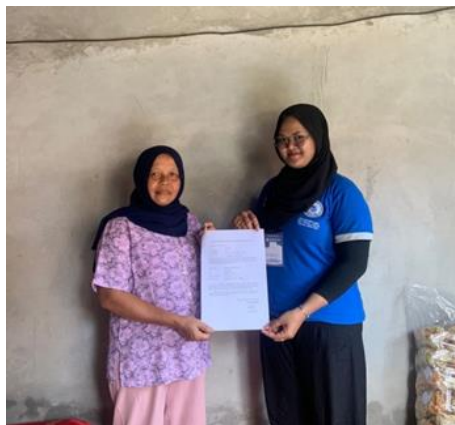
Gambar 1.2 Perizinan Mitra