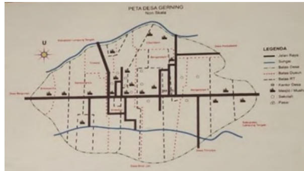
Gambar 1.1 Peta Lokasi PKPM

Tujuan diadakannya PKPM IIB DARMAJAYA adalah untuk membantu meningkatkan ekonomi menuju masyarakat yang unggul dan tangguh. Dalam pelaksanaannya, Desa Gerning merupakan salah satu desa yang menjadi wilayah Praktik Kerja Pengabdian Masyarakat IIB DARMAJAYA yang berada di Kecamatan Tegineneng Kabupaten Pesawaran dengan luas wilayah yakni 1.629,00 Ha. Desa ini juga terdiri dari berbagai suku diantaranya Sunda, Jawa, dan Ogan yang mayoritas mata pencaharian penduduknya adalah petani. Desa Gerning meliputi sejumlah dusun sebagai berikut, yaitu: