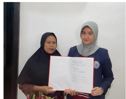
Gambar 2.5 Kegiatan Pembukuan Kas Gambar 2.6 Kegiatan Perhitungan Harga