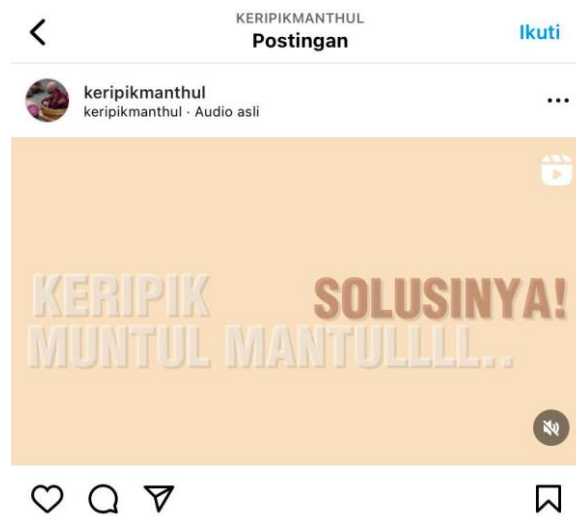
Gambar 2.10 Iklan Produk di Instagram

Di era digital saat ini, perkembangan teknologi sangat berpengaruh pada seluruh kegiatan. Salah satunya yaitu pemasaran. Oleh karena itu pemasaran produk yang efektif untuk dilakukan yaitu dengan memanfaatkan sosial media . Pemasaran yang kami buat yaitu dengan content marketing dalam bentuk iklan yang ditayangkan di aplikasi instagram @keripikmanthul.