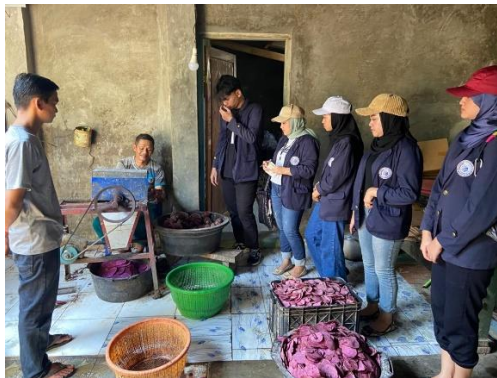
Gambar 2.1 Kegiatan Produksi UMKM Keripik Muntul mantul

Membantu UMKM adalah program utama yang dilaksanakan. Memilih UMKM Keripik Muntul Mantul Bude Lis ini sesuai dengan program kerja yang bias dimaksimalkan. Membantu kegiatan dilakukan bertujuan agar dapat mengetahui proses pembuatan mulai dari bahan baku yang dibutuhkan beserta harga, alat yang digunakan sampai dengan proses pengemasan. UMKM Keripik Muntul Mantul melakukan produksi sebanyak tiga kali dalam sebulan. Kami berkesempatan untuk membantu pada produksi kedua. Mulai dari ubi dikeluarkan dari dalam karung, direndam, dipotong lalu digoreng. Tidak lupa juga melakukan wawancara terkait produksi.