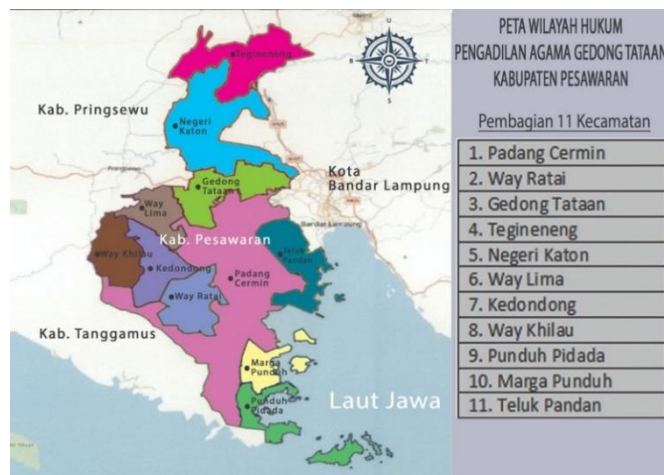
1.1 Peta Wilayah Kabupaten Pesawaran