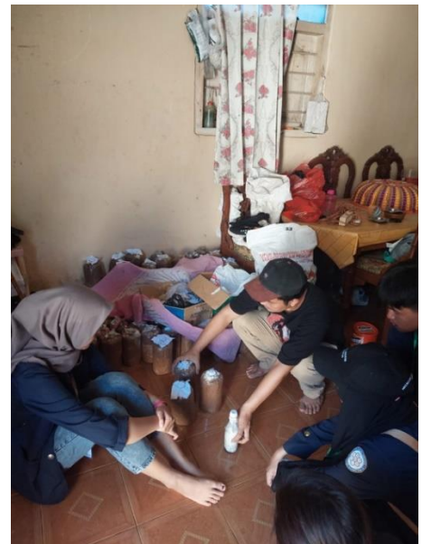
Gambar 27 Proses Pembuatan Jamur di Desa Mada Jaya