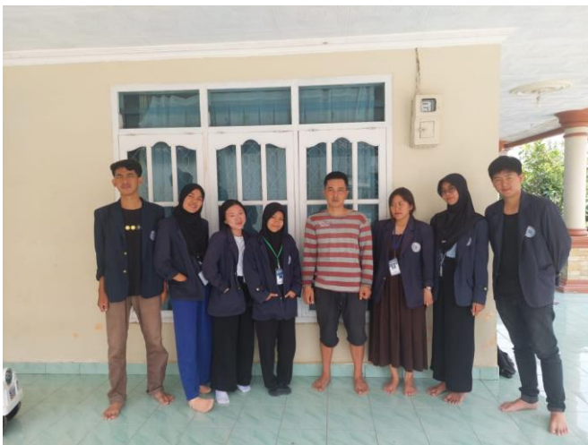
Gambar 11 Foto bersama pemilik UMKM Jamur Berkah Jaya di Desa Mada Jaya