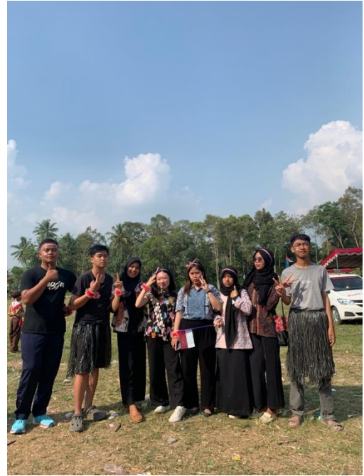
Gambar 6 Perayaan Hari Kemerdekaan Republik Indonesia ke 78 di Desa Mada Jaya