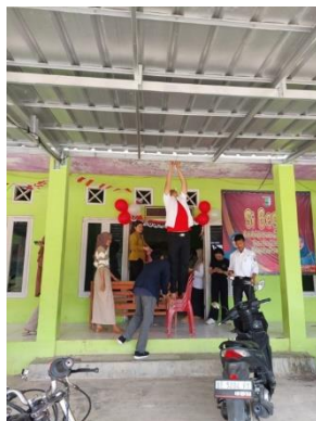
Gambar 7 Mendekor Balai di Desa Mada Jaya

Membantu menghias balai desa dan paud untuk menyambut hari kemerdekaan Indonesia ke 78 yang di adakan pada tanggal 17 Agustus 2023: