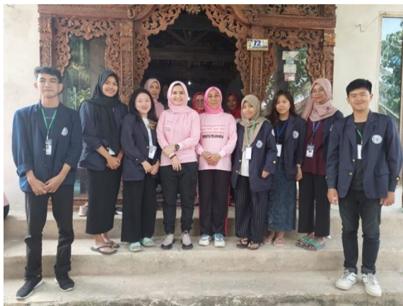
Gambar 18 Penyambutan Ibu Bupati Pesawaran di Desa Mada Jaya