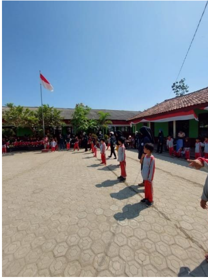
Gambar 28 Panitia 17 Agustus di SDN 9 Way Khilau