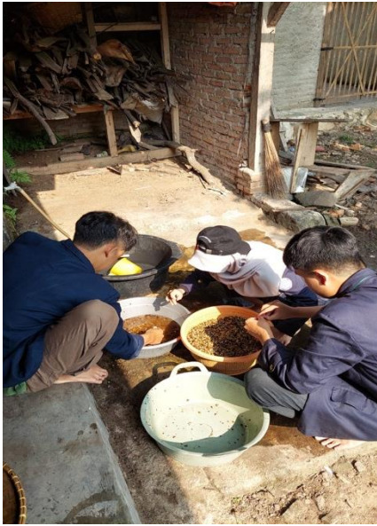
Gambar 13 Proses Pembuatan Kopi di Desa Mada Jaya