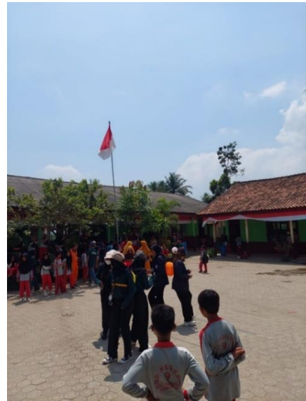
Gambar 29 Mengikuti lomba 17 agustus di SDN 9 Way Khilau Desa Mada Jaya