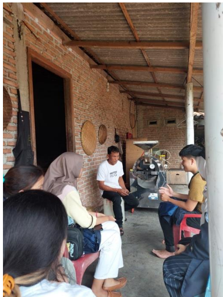
Gambar 26 Pengenalan Kopi Bubuk JM di Desa Mada Jaya