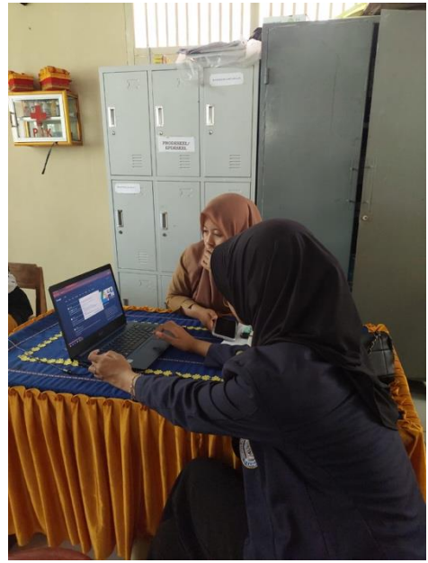
Gambar 17 Sosialisasi Mengenai Paperless di Desa Mada Jaya