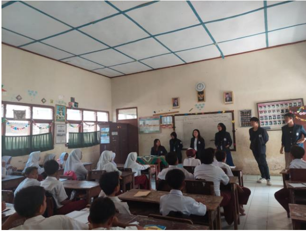
Gambar 9 Sosialisasi ke SDN 9 Way Khilau di Desa Mada Jaya

Melakukan sosialisasi terhadap bijaknya dalam penggunaan smartphone: