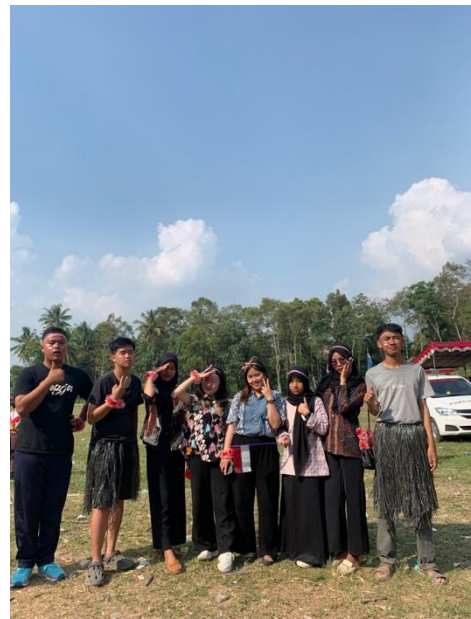
Gambar 21 Mengikuti Karnaval di Desa Mada Jaya