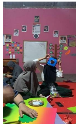
Gambar 8 Mendekor Paud di Desa Mada Jaya