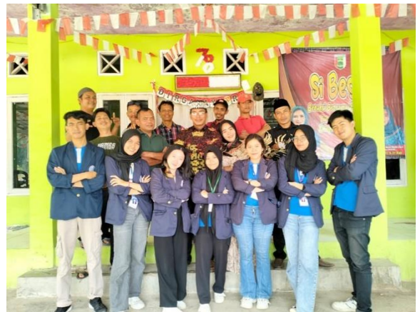
Gambar 19 Perpisahan Bersama Aparat Desa Mada Jaya