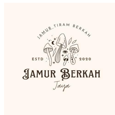
Gambar 4 Hasil Logo Jamur Berkah Jaya