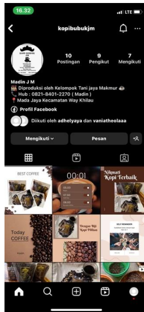
Gambar 5 Akun instagram kopi bubuk JM

Kegiatan ini dilakukan untuk meningkatkan minat konsumen dalam membeli produk Kopi Bubuk JM.