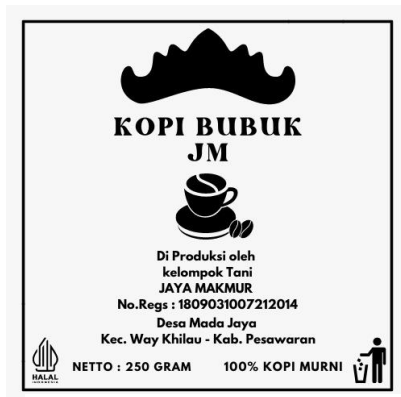
Gambar 3 Hasil Logo Kopi Bubuk JM

Membantu memodifikasi logo yang sudah ada agar terlihat lebih menarik lagi untuk Kopi Bubuk JM dan Jamur Berkah Jaya.