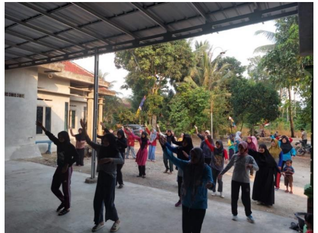
Gambar 25 Senam mingguan bersama Ibu PKK di Desa Mada Jaya