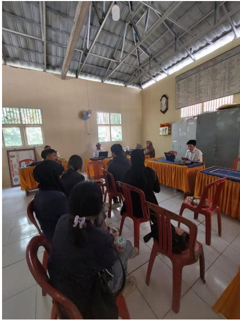
Gambar 16 Survei Tempat PKPM di Desa Mada Jaya