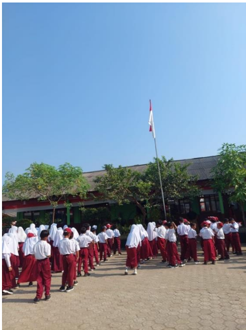
Gambar 22 Mengikuti upacara di SDN 9 way Khilau Desa Mada Jaya