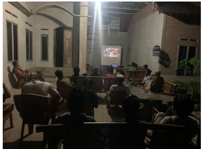
Gambar 30 Mengadakan Nonton Bola Bersama Masyarakat Desa Mada jaya dan para Aparat Desa Mada Jaya