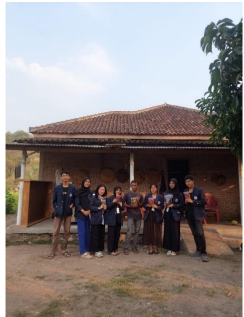
Gambar 12 Foto bersama pemilik UMKM Kopi Bubuk JM