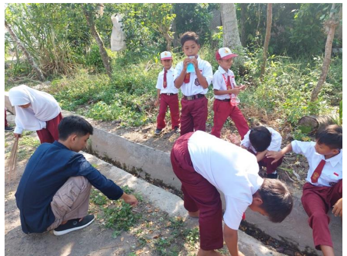
Gambar 23 Gotong Royong bersama siswa-siswi SDN 9 Way Khilau Desa Mada Jaya