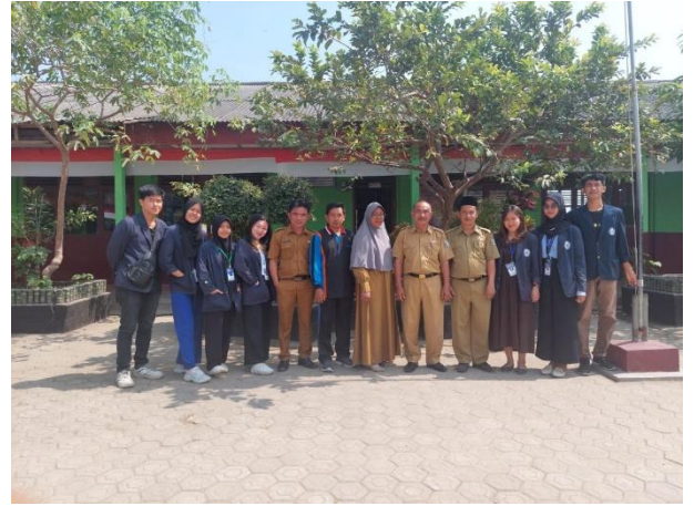
Gambar 10 Foto bersama Kepala Sekolah dan Dewan guru SDN 9 Way Khilau di desa Mada Jaya