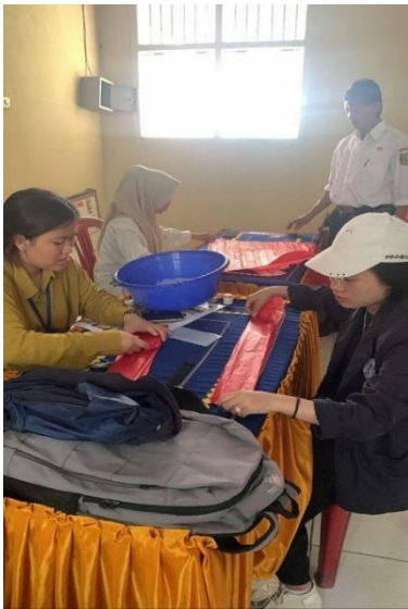
Gambar 15 Membantu Persiapan Hut RI di Desa Mada Jaya