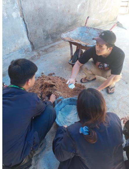
Gambar 14 Proses Pembuatan Jamur di Desa Mada Jaya