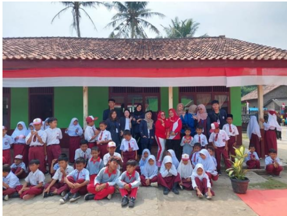
Gambar 24 Foto bersama Ibu Camat dan Lurah di Desa Mada Jaya