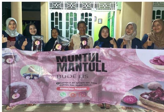
Gambar 2.9 Banner UMKM Keripik Muntul Mantul Bude Lis