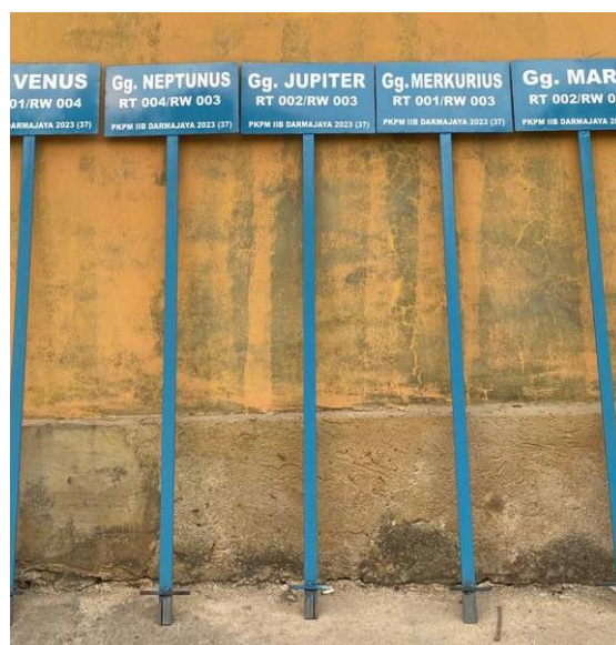
Gambar 2.23 Kenang-Kenangan Plang Gang

Plang gang ini dipersembahkan untuk Dusun Kamulyan, dimana tempat kami tinggal. Dusun ini memberikan kesan yang sangat baik sehingga juga kegiatan PKPM kelompok 37 dapat terlaksana semua tanpa suatu kendala apapun.