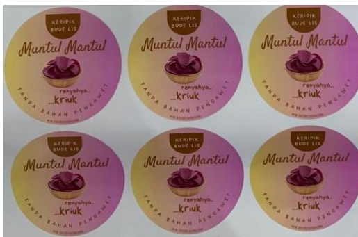
Gambar 2.7 Merk, Logo dan Stiker

Selain keuangan, faktor lainnya adalah kemasan. Kemasan sebagai daya Tarik dan ketahanan produk. Sebelumnya UMKM ini belum memiliki nama brand tersendiri, kemasan, stiker produk. Kemasan, banner, logo dan stiker di desain sesuai dengan produk yang ingin di branding yaitu Ubi Ungu.