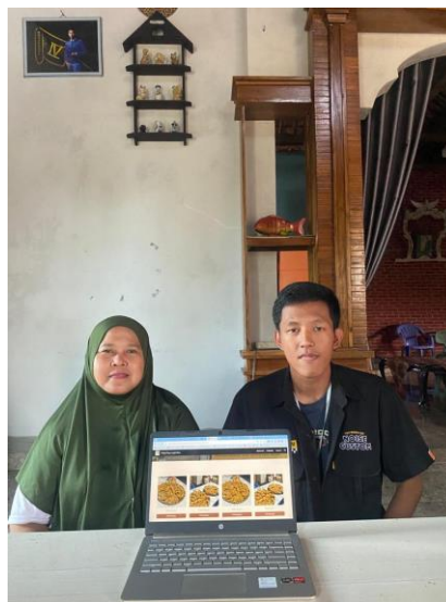
Gambar 2. 3 Pembuatan Website UMKM

https://sites.google.com/view/pitektepungterigu/beranda?authuser=2