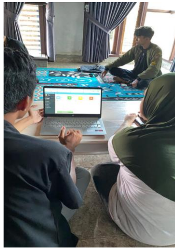
Gambar 2. 2 Pembuatan Akun SiMonik

Sriwedari. Berikut link SiMonik: https://simonikumkm.shop/produk/detail/pitek-tepung-kribo