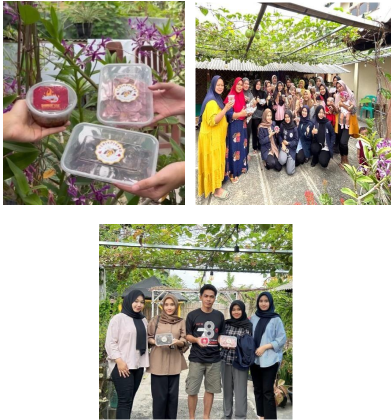
Gambar 2.10 Inovasi Bisnis Baru Keripik Pisang Lumer Bersama ibu PKK