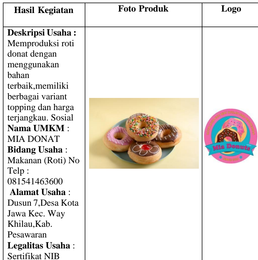
Tabel 2.2 Produk UMKM yang Terdapat di E-Catalog