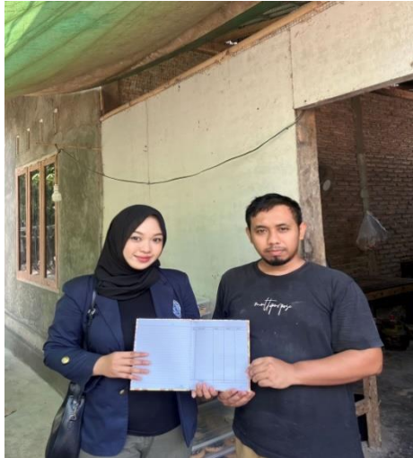
2.4 Penyerahan hasil pembukuan kepada pemilik UMKM Donat

Setelah melakukan pendampingan Penyusunan Laporan Keuangan dengan menggunakan Buku Pembukuan Sederhanaan pemilik UMKM sudah dapat menghitung keuntungan dan kerugian, dengan melakukan pembukuan dengan rinci untuk mengetahui pengeluaran dan pemasukan sehingga dapat mengatur keuangan pemilik UMKM Mia Donut dan Donat A'a.