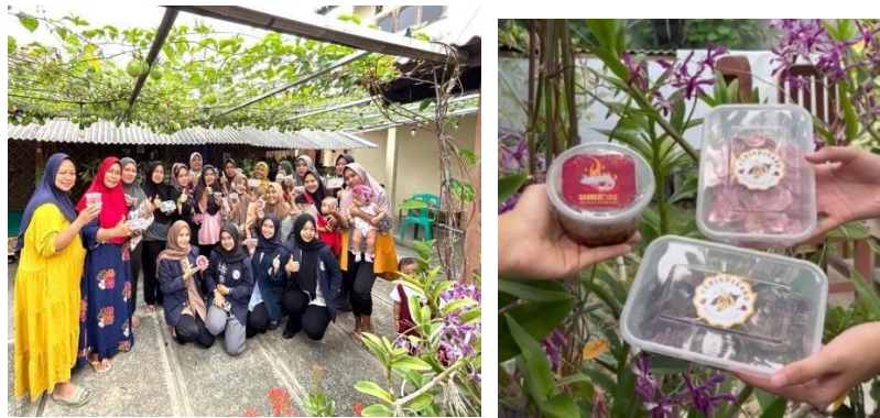
Gambar 2.9 Foto Hasil Produk Sambal Lele Bersama Ibu-ibu PKK