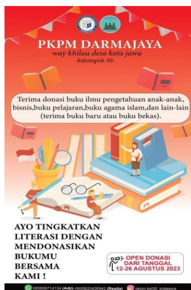
Gambar 2.8 Menciptakan Program Pojok Baca