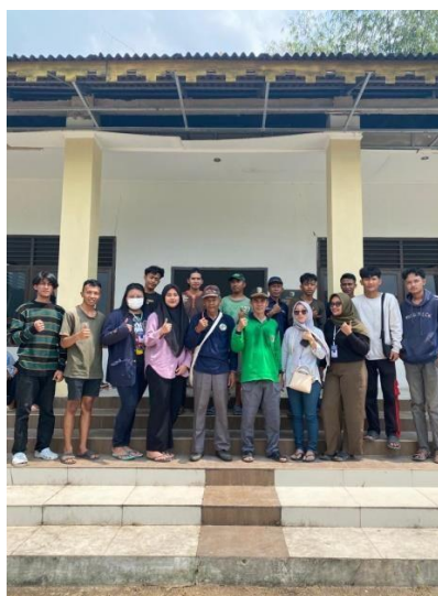
Gambar 2.15 Mengikuti Kegiatan Gotong Royong