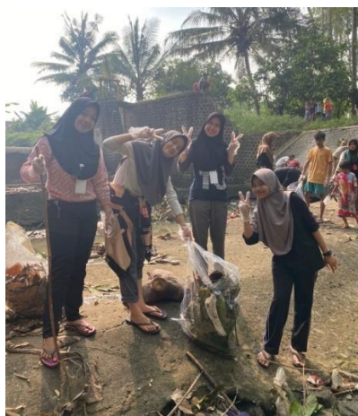
Gambar 2.13 Mengikuti Kegiatan Pembersihan Sampah Bendungan