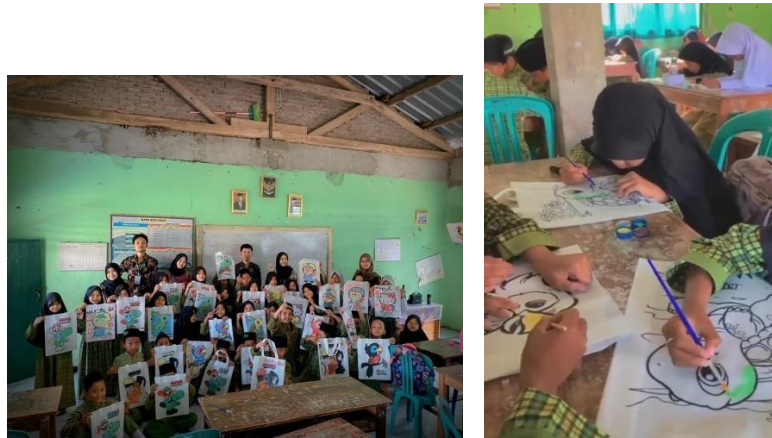
Gambar 2.6 Mengajar Kreativitas

dan kreatif sejak dini. Kegiatan ini berlangsung selama 2 jam dan dilaksanakan bersama siswa-siswi kelas 5 dikarenakan mereka aktif dalam melakukan suatu kegiatan sehingga kegiatan mengajar kreativitas terlaksana dengan hasil karya 35 totebag canvas yang berhasil terselesaikan.