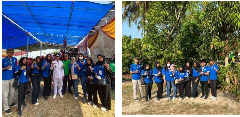
Gambar 2.16 Mengikuti Kegiatan Jalan Sehat