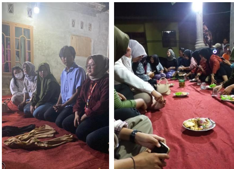
Gambar 2.14 Mengikuti Kegiatan Adat Lampung