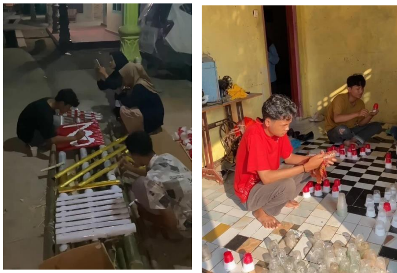
Gambar 2.12 Menghias Dusun Dalam Rangka HUT RI Ke 78