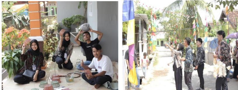
Gambar 2.17 Menjadi Panitia Perlombaan 17 Agustus