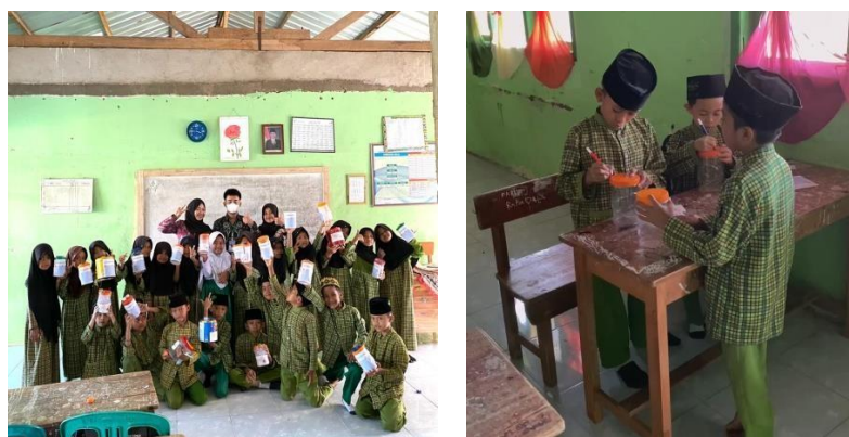
Gambar 2.7 Mengajar Menabung

c. Mengajar menabung bersama anak MI Mathla'ul Anwar dengan konsep yang menyenangkan dan memanfaatkan botol bekas sebagai media menabung. Kegiatan ini berlangsung selama 2 jam dan dilaksanakan bersama siswa-siswi kelas 4 yang berjumlah 20 siswa. Kegiatan ini bertujuan untuk membiasakan diri menabung sejak dini.