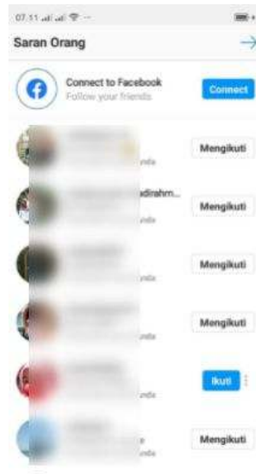
Gambar 2.11 Halaman berisi Follow Akun Orang Lain

Berikutnya dengan mengetuk Tanda “Panah” dikanan atas.