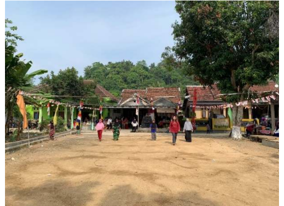
Gambar 2.19 Lomba ibu- ibu Cantol Besek