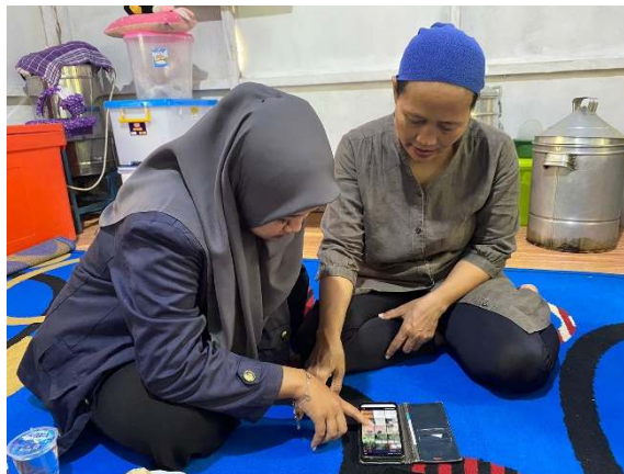
Gambar 2. 1 Proses pendampingan pembuatan Akun Instagram