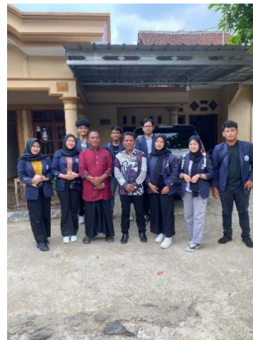
Gambar 2.13 Melakukan survey & memberikan surat permohonan izin