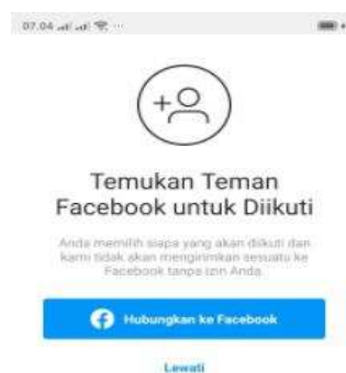
Gambar 2.9 Halaman Temukan Teman