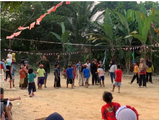
Gambar 2.20 Lomba anak-anak Cantol Besek