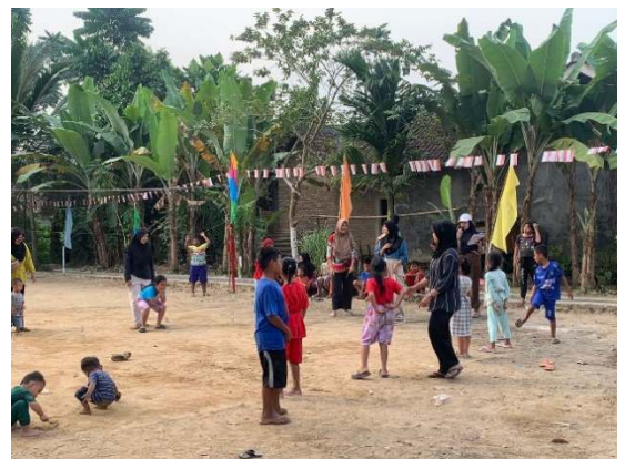
Gambar 2.21 Lomba sendok pakai kelereng