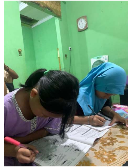
Gambar 2.23 Belajar bersama di posko Dusun II Warnasari desa Durian