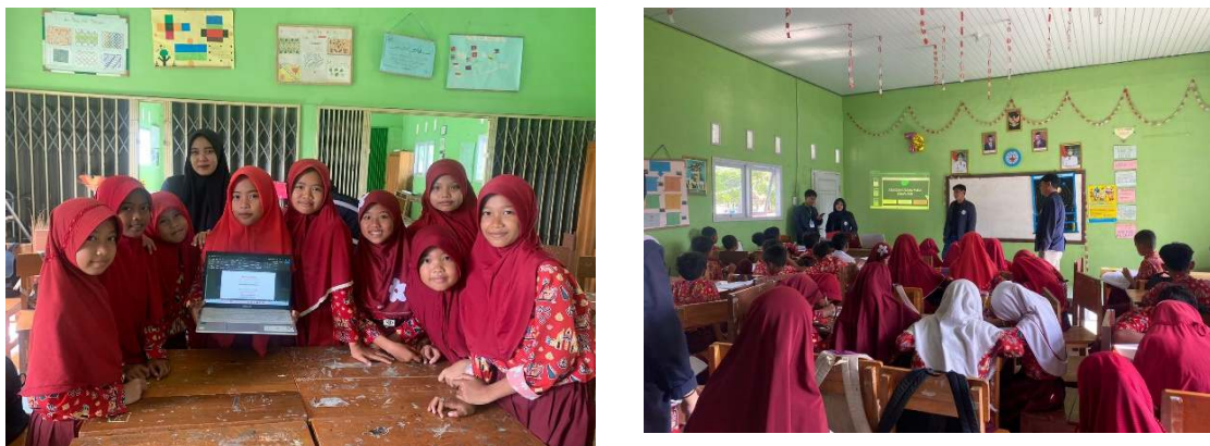
Gambar 2.17 Pembelajaran Pengenalan Dasar Komputer dan Microsoft word kepada SDN 19 Padang Cermin