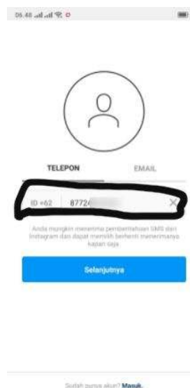
Gambar 2.4 Halaman baru untuk daftar akun Instagram