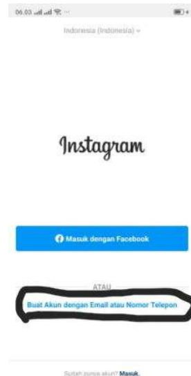
Gambar 2.3 Tampilan awal aplikasi Instagram