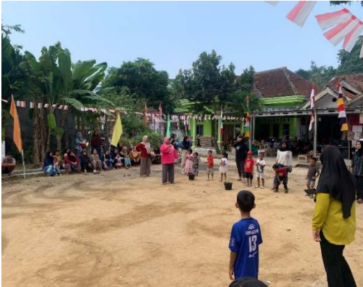
Gambar 2.18 Lomba masukkan air kedalam botol

baskom, memasukkan stik es krim ke dalam gelas . Namun sebelum hari lomba dilaksanakan, kami membantu warga dalam menyiapkan dan membungkus hadiah perlombaan, serta menyiapkan tempat pelaksanaan perlombaan.