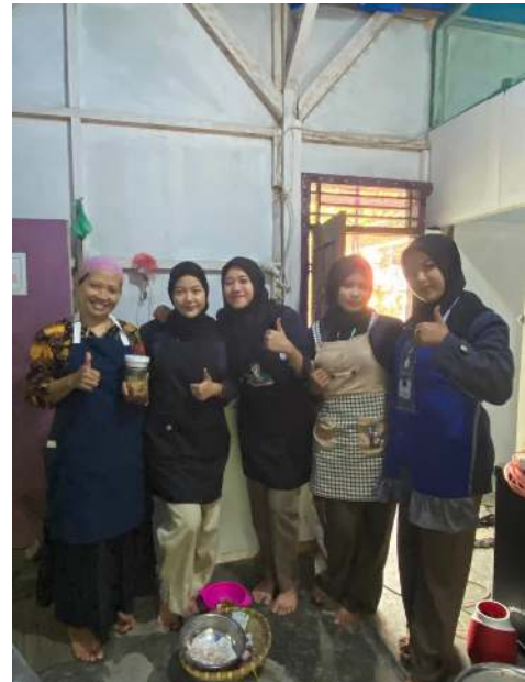
Gambar 2.15 Proses pembuatan adonan Cucuk Gigi