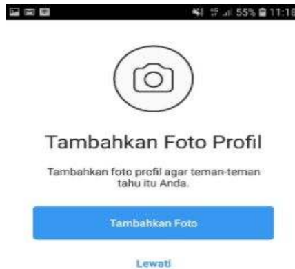
Gambar 2.10 Tampilan Halaman untuk memasukkan Foto Profil

Sementara kalau tidak ingin menambahkan foto profil sekarang, bisa pilih lewati Langkah ini dengan mengetuk label “Lewati”