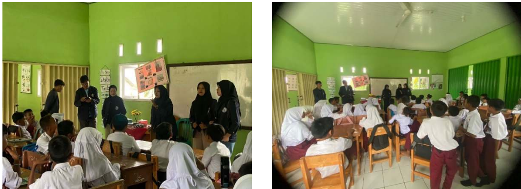
Gambar 2.16 Pendampingan KBM SDN 19 Padang Cermin