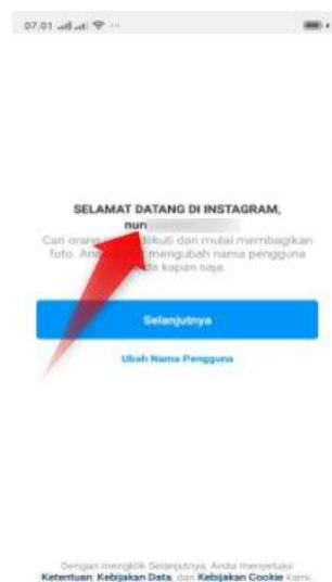
Gambar 2.7 Halaman “Selamat Datang” Pada Akun Instagram

Nama Pengguna atau username yang dibuat oleh Instagram untuk akun yang bisa dilihat halaman “ Selamat Datang” seperti gambar dibawah ini: