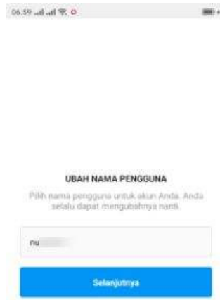
Gambar 2.8 Halaman pengisian Nama Pengguna atau Username