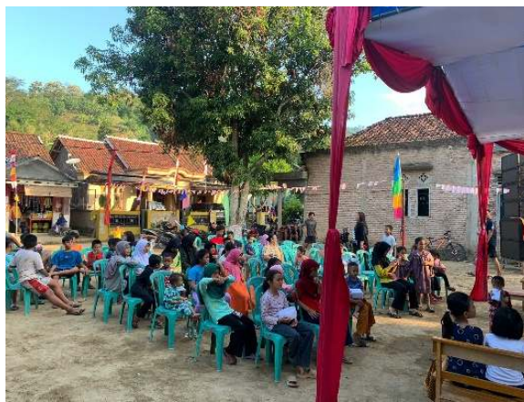
Gambar 2.22 Membantu pembungkusan hadiah perlombaan dan Pembagian hadiah perlombaan