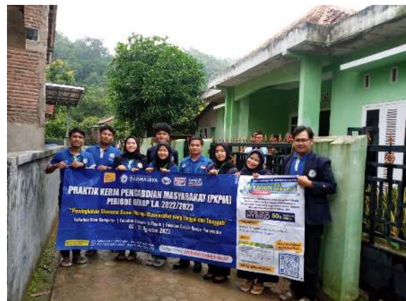
Gambar 2.14 Penerimaan mahasiswa PKPM IIB Darmajaya