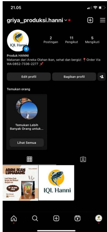
Gambar 2.2 Akun Instagram yang sudah siap untuk memulai berjualan