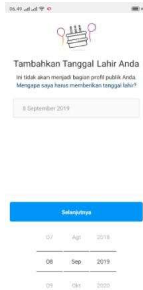
Gambar 2.6 Pengisian pada Halaman Tanggal dan Tahun Lahir

Selanjutnya Instagram akan meminta untuk memasukkan tanggal lahir. Silahkan isikan tanggal dan tahun lahir di kolom yang tersedia