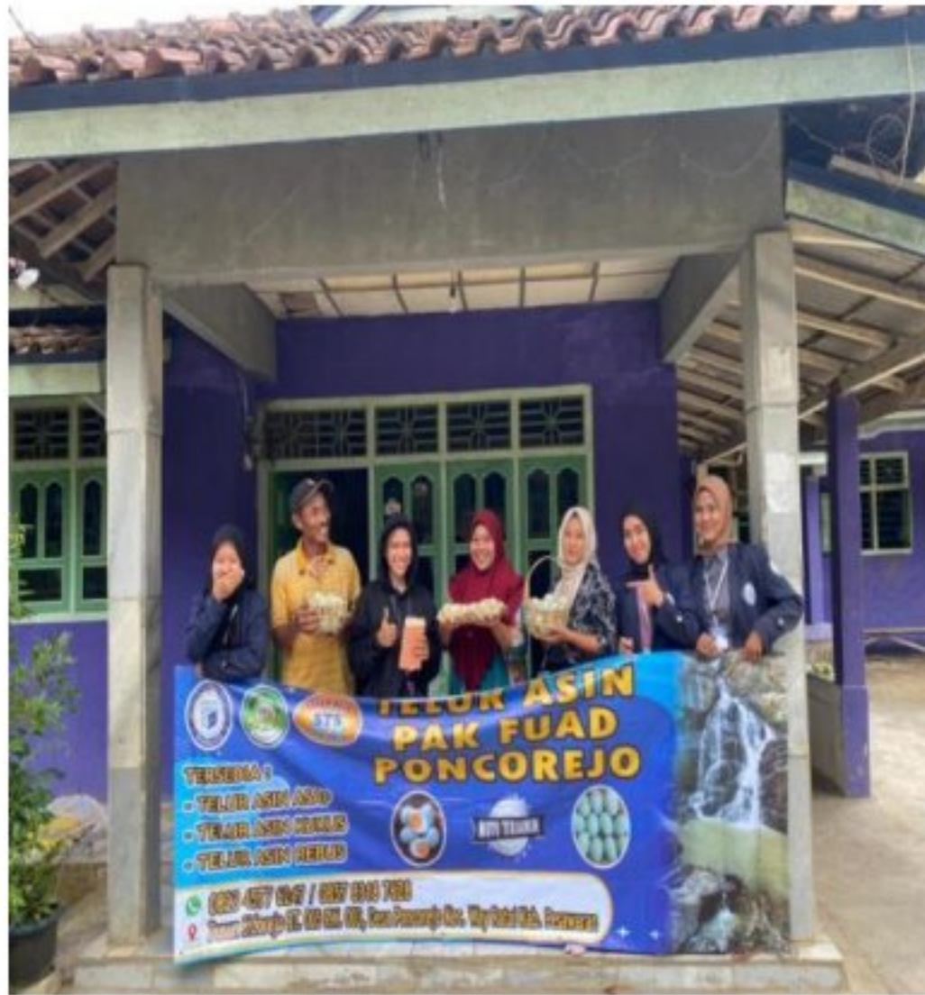
Gambar 7. Penyerahan Banner Telor Asin