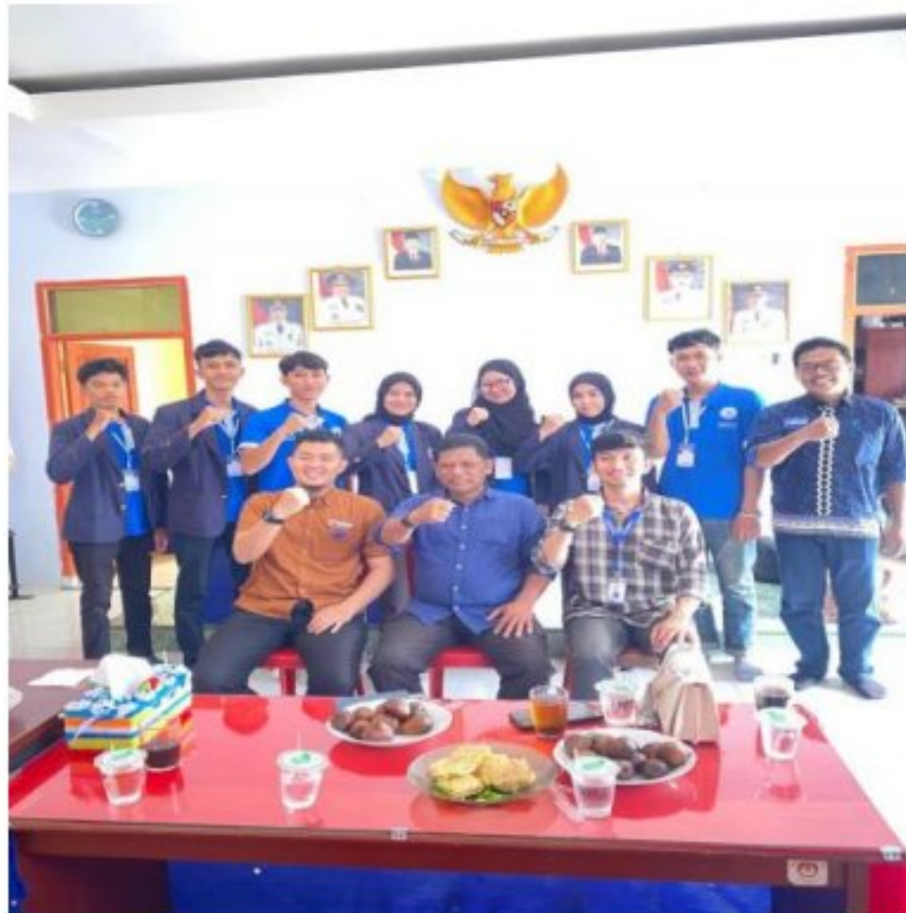
Gambar 1. Penyambutan Mahasiswa PKPM IIB Darmajaya di Balai Desa