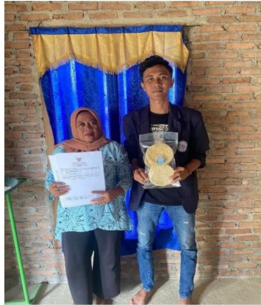
Gambar 14. Penyerahan NIB UMKM Eyek-eyek Flamboyan Kepada Ibu