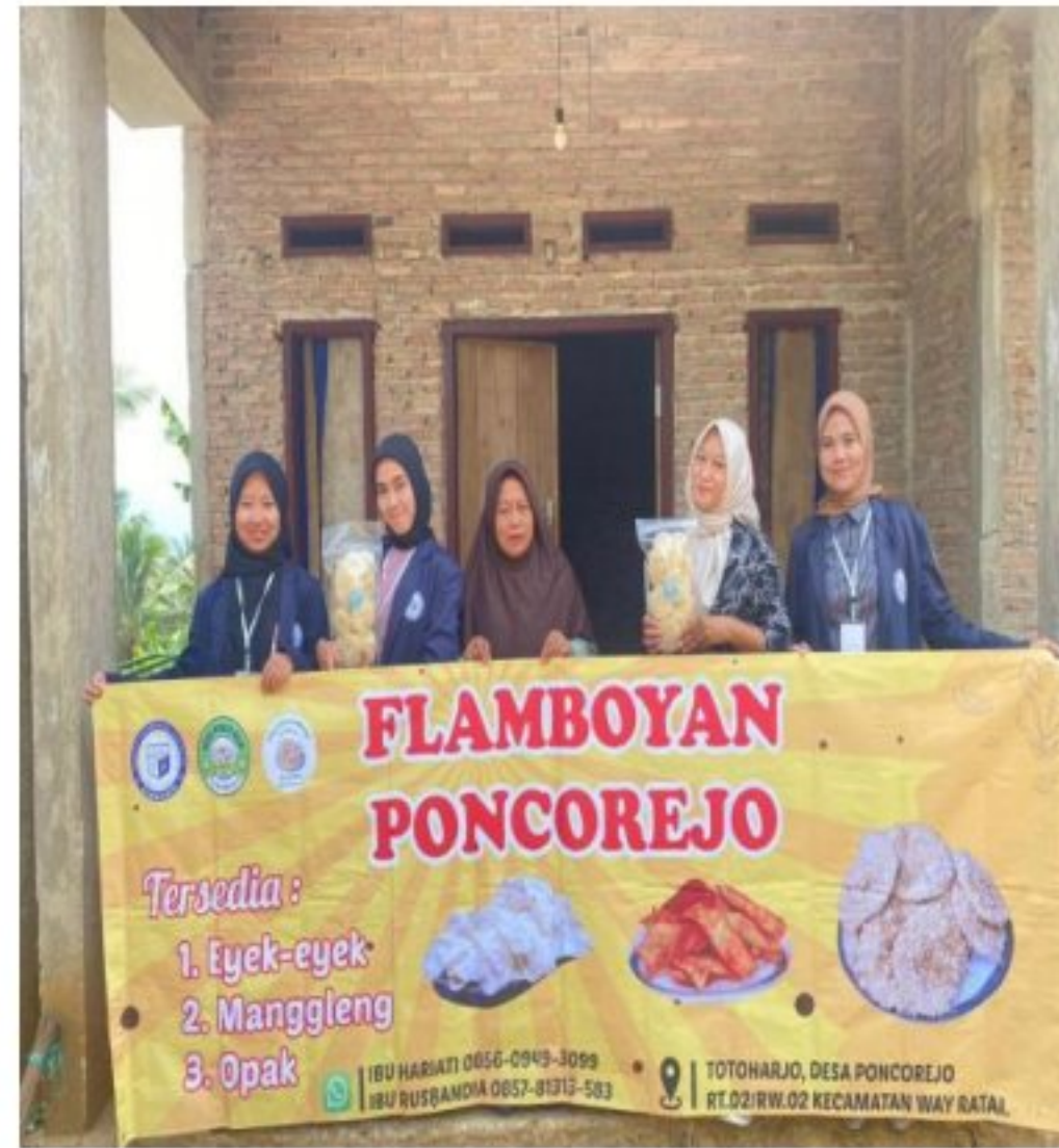
Gambar 8. Penyerahan Banner UMKM Eyek-eyek Flamboyan