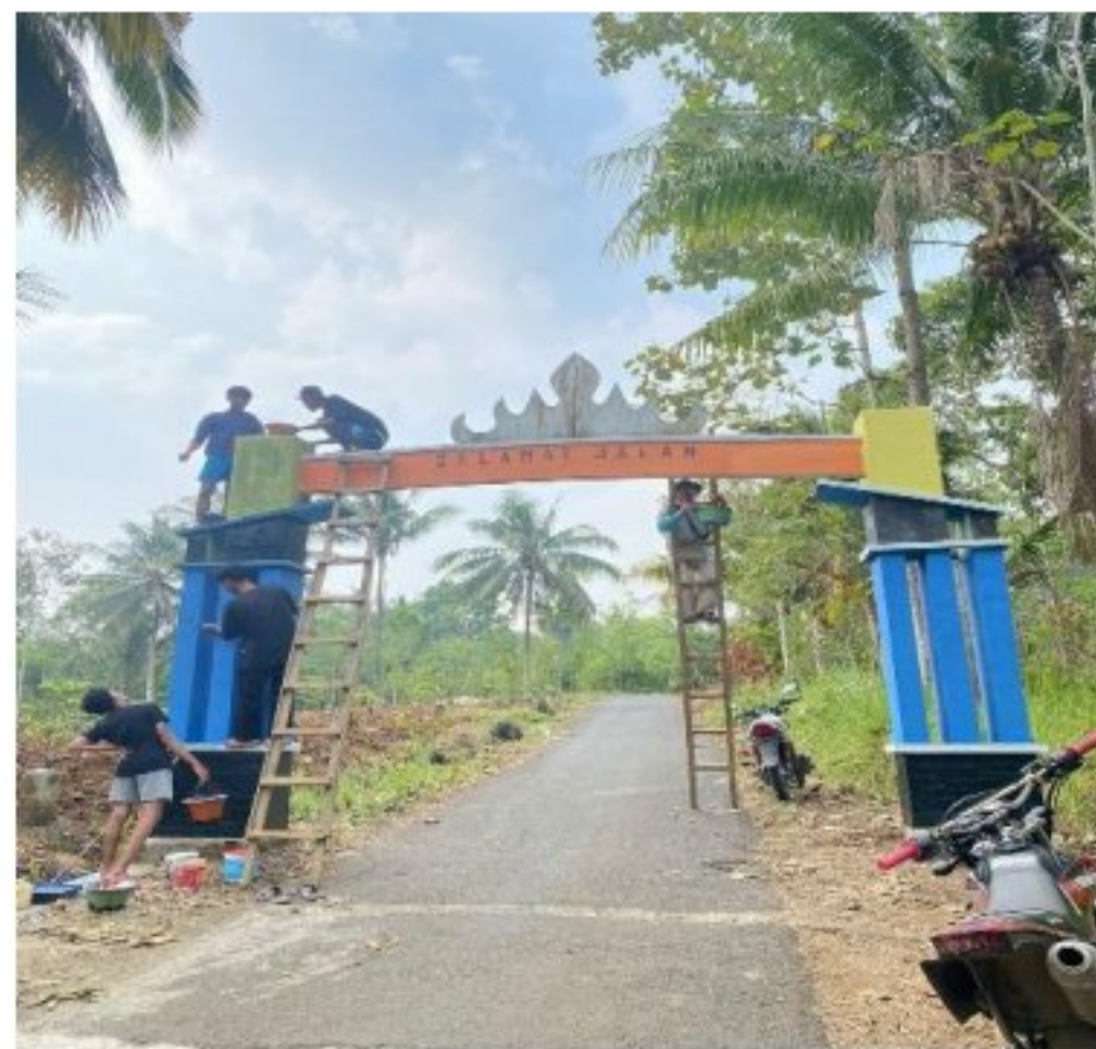
Gambar 6. Pengecetan Gapura Desa Poncorejo