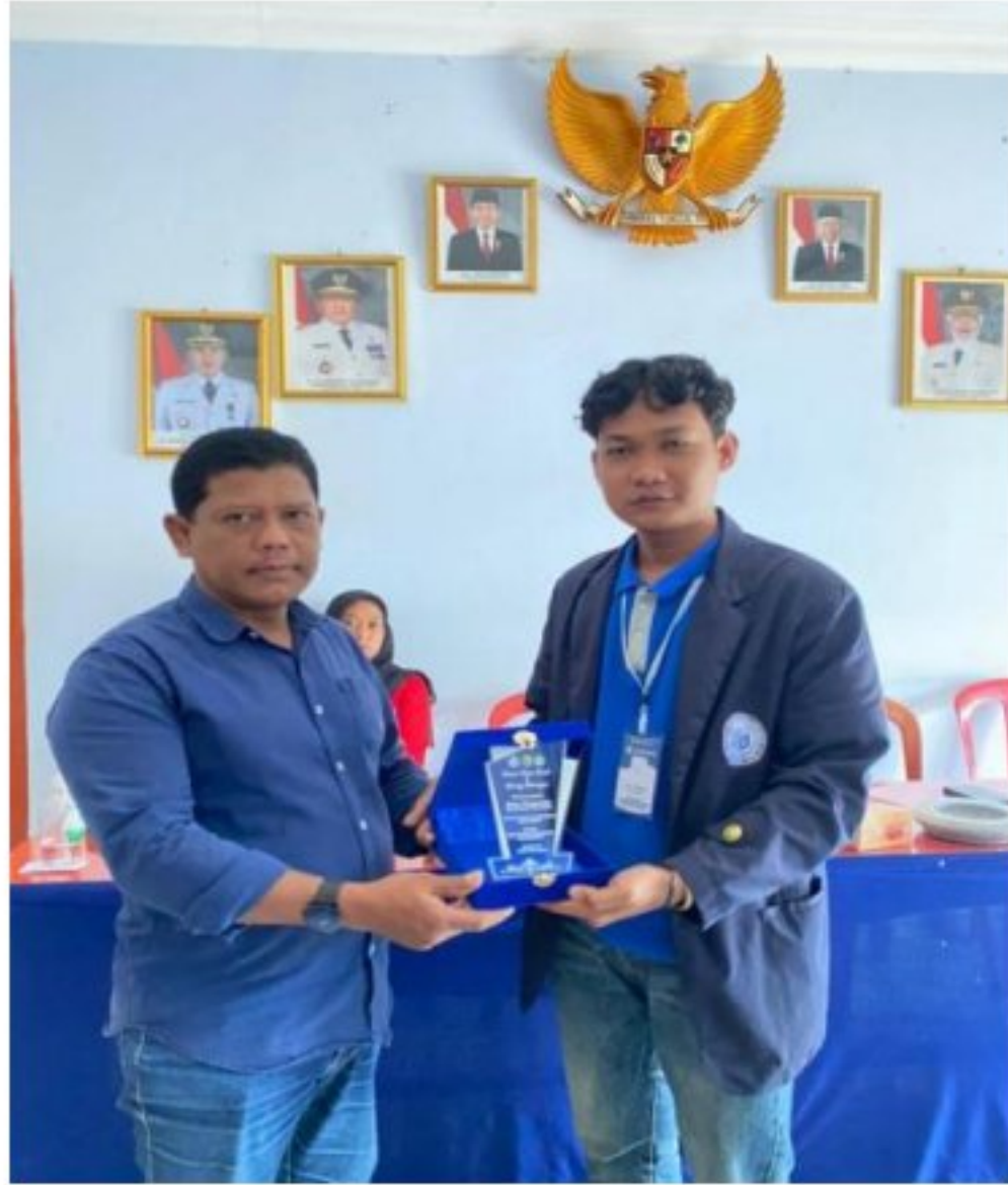
Gambar 13, Penyerahan Plakat kepada Kepala Desa Poncorejo