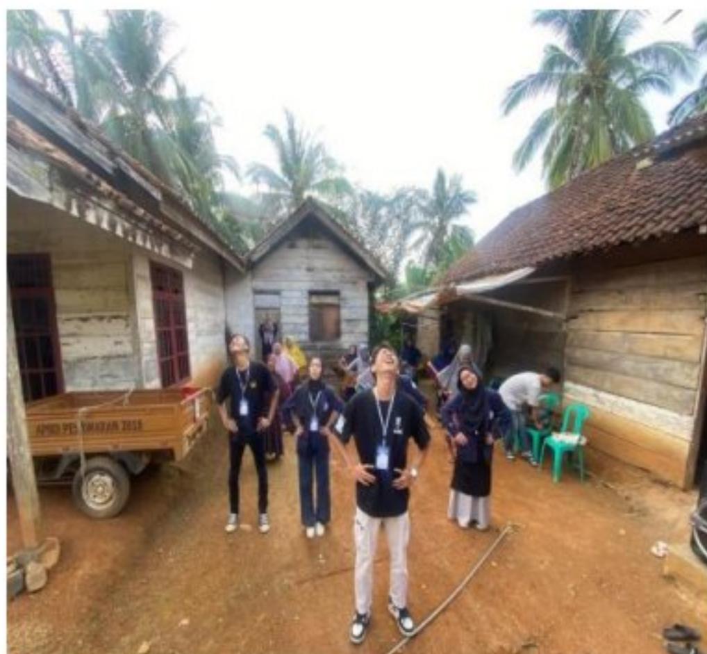
Gambar 5. Senam bersama