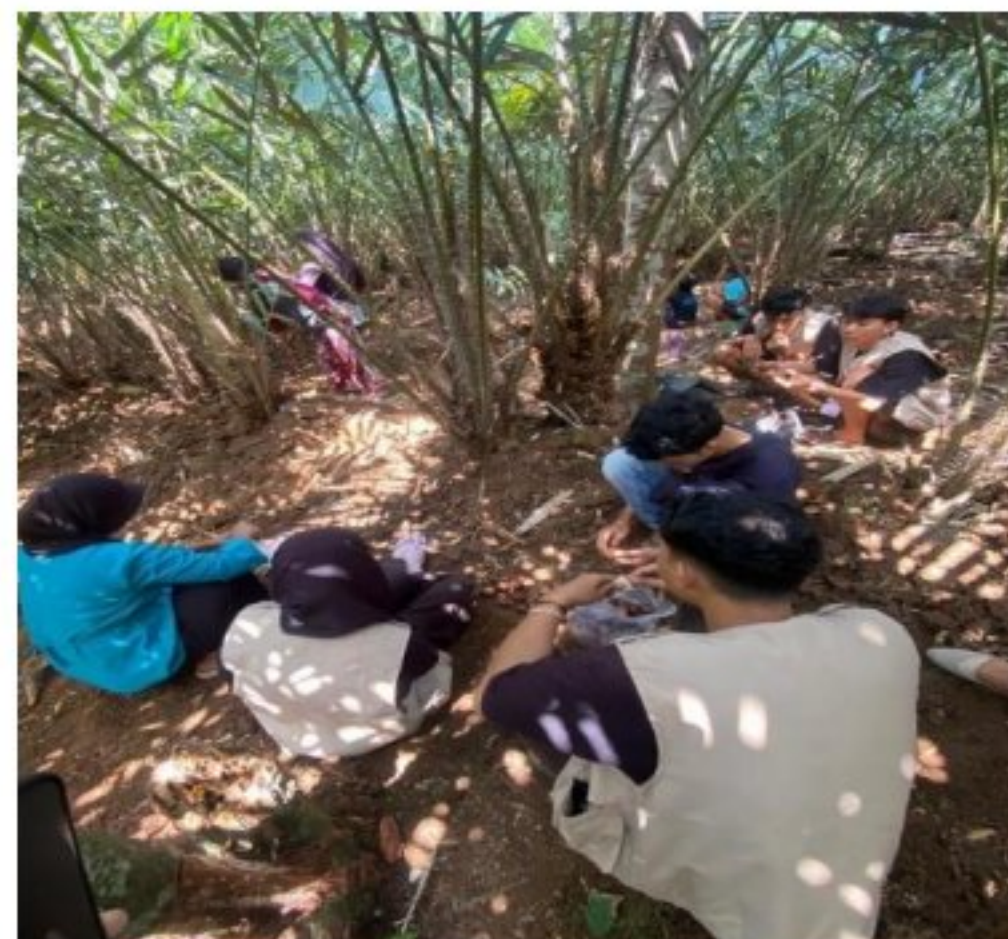
Gambar 4. Potensi desa kebun salak