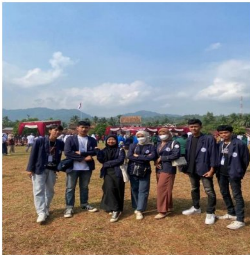
Gambar 9. Upacara HUT RI KE-78