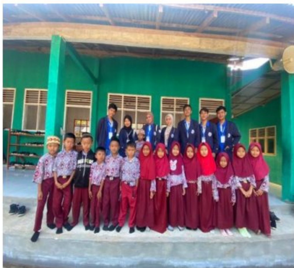
Gambar 3. Sosialisasi tentang Stop Bullying di MI AN-NIDA