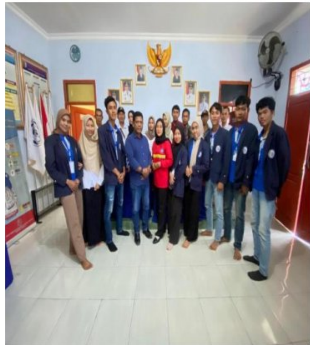
Gambar 16. Pelepasan Mahasiswa PKPM dari pihak Desa Poncorejo