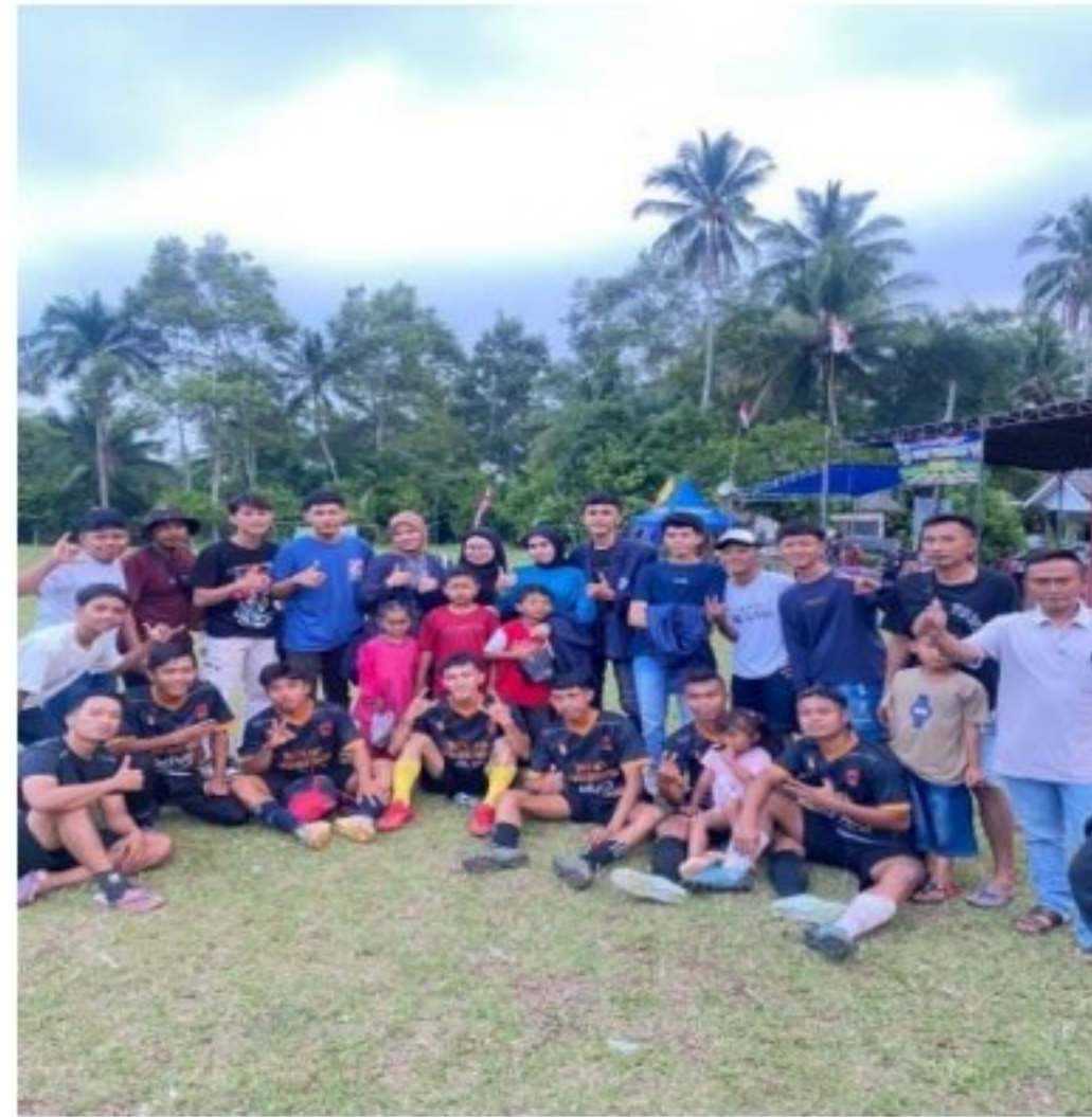
Gambar 2. Panitia Tournamen Sepak