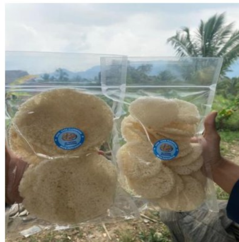
Gambar 12. Kemasan dan Logo Produk Eyek-eyek Flamboyan