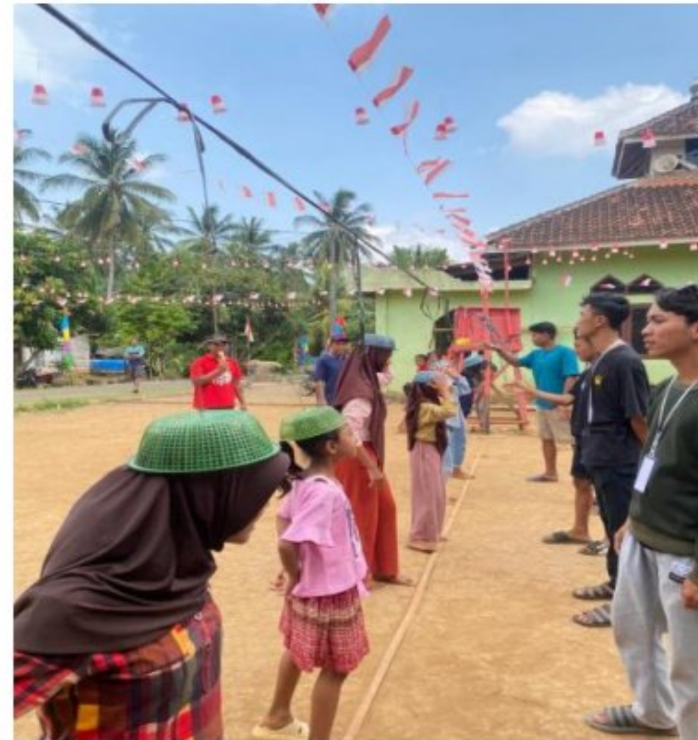
Gambar 10. Penitia Perlombaan