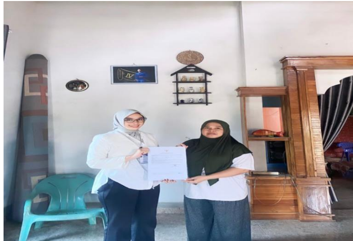
Gambar 2. 2 Penyerahan perizinan usaha pada pemilik UMKM