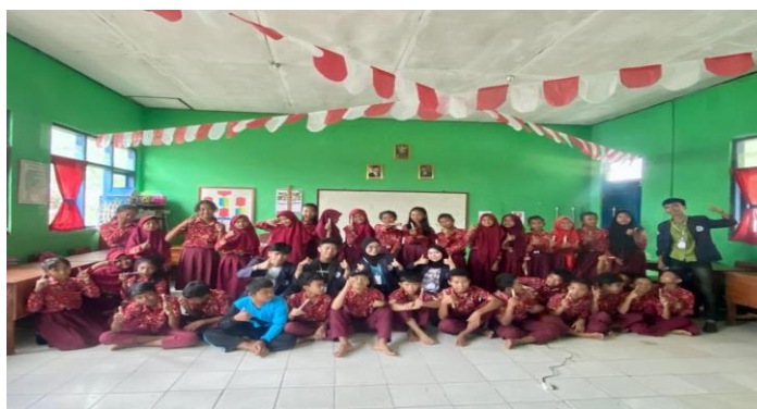
Gambar 2. 4 Belajar Bersama Anak-anak SD Desa Sriwedari

Kegiatan ini membantu para anak-anak dalam belajar karena sekolah dilakukan secara luring dengan itu tujuan dari kegiatan ini adalah mengajarkan anak-anak lebih paham mengenai pentingnya menjaga kebersihan diri dan lingkungan. Dengan adanya kegiatan ini siswa lebih memahami bagaimana cara menjaga kebersihan diri dan lingkungan sekitar.