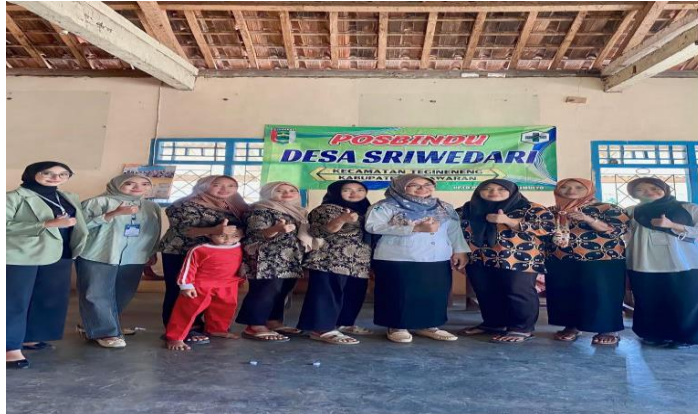
Gambar 2. 5 Keikutsertaan Kegiatan Posyandu Balita dan Lansia

pemenuhan gizinya. Serta untuk meningkatkan kesehatan masyarakat khususnya bagi warga yang sudah lanjut usia. Kegiatan ini dihadiri oleh seluruh masyarakat yang ada di Desa Sriwedari.