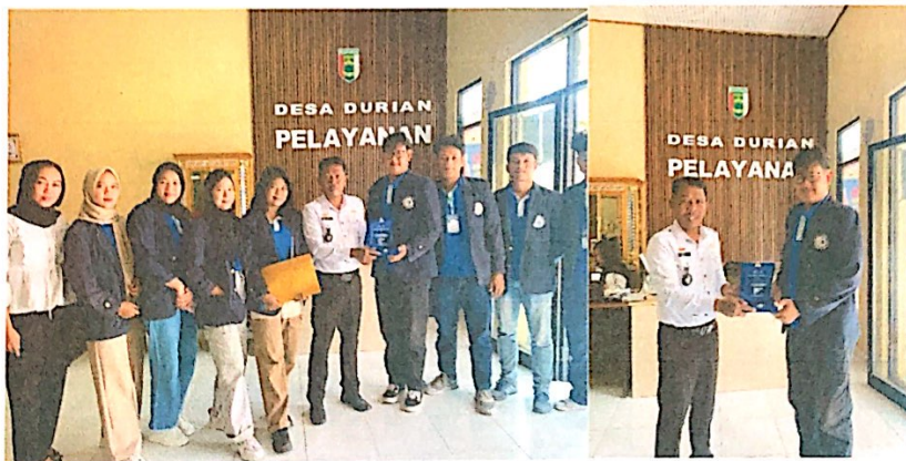
Lampiran 20. Foto Bersama saat perpisahan PKPM & Pemberian Cendera Mata Kepada Bapak Kepala Desa Durian