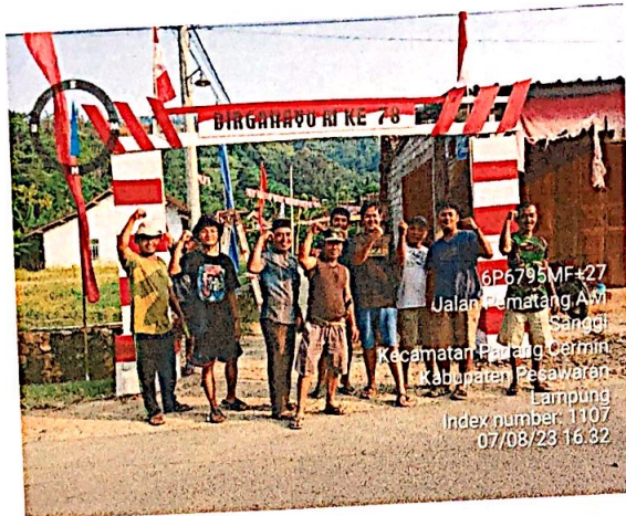
Lampiran 6. Membantu pembuatan gapura bersama Bapak-bapak Dusun II Warnasari