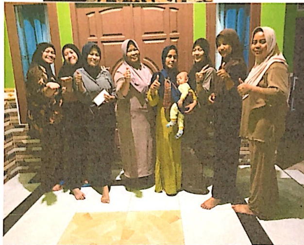
Lampiran 21. Perpisahan & Makan bersama Masyarakat di Dusun II Warnasari Desa Durian