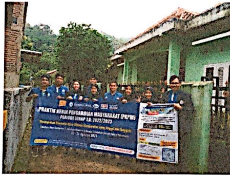
Lampiran 1. Foto Penerimaan Mahasiswa PKPM IBI Darmajaya di kantor Kecamatan Padang Cermin & Foto bersama DPL saat tiba di lokasi PKPM