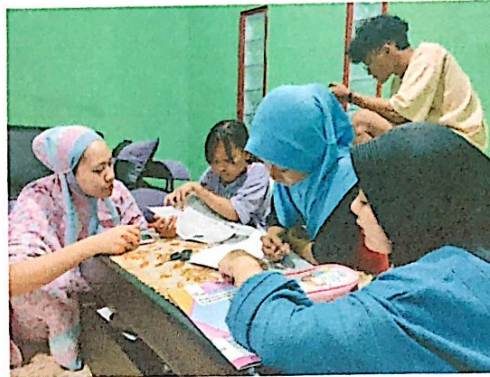
Lampiran 10. Memberikan sarana belajar kepada anak-anak Dusun II Warnasari Desa Durian