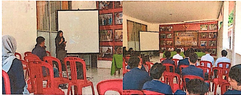
Lampiran 22. Persentasi Hasil Kegiatan desa dikantor Kecamatan Padang Cermin & Penjemputan PKPM oleh DPL di Kecamatan Padang Cermin