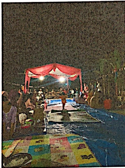
Lampiran 16. Doa bersama & makan bersama masyarakat Dusun II Warnasari Desa Durian