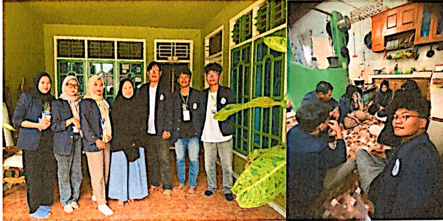
Lampiran 8. Kunjungan ke UMKM Siomay W4 & Membantu produksi pembuatan Siomay W4