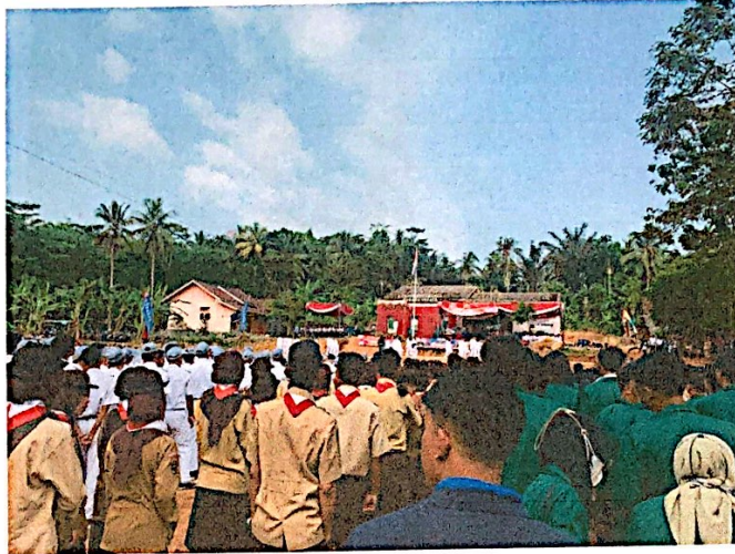
Lampiran 15. Mengikuti Upacara HUT NKRI di kecamatan Padang Cermin