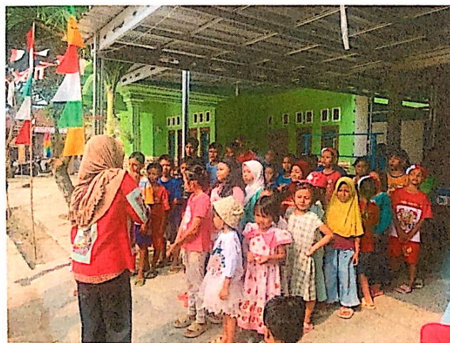
Lampiran 12. Membantu mempersiapkan lomba 17 Agustus & menjadi panitia di Dusun II Warnasari