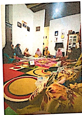
Lampiran 7. Mengikuti pengajian rutin Ibu-ibu di Dusun II Warnasari