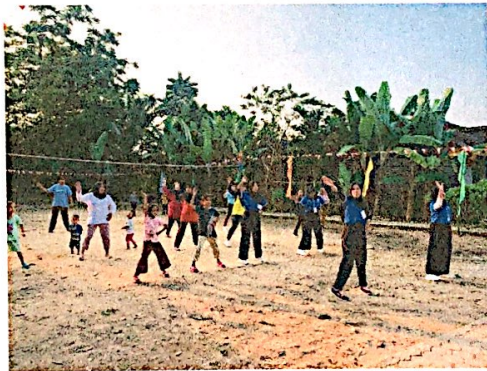
Lampiran 5. Senam bersama ibu-ibu di Dusun II Warnasari