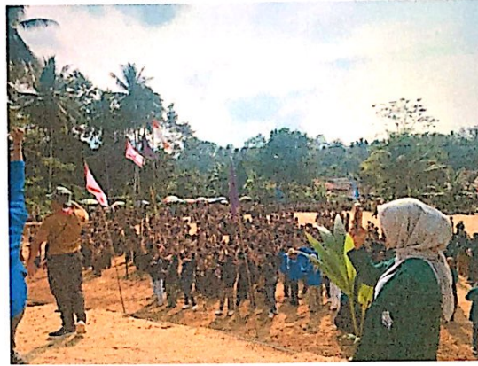
Lampiran 13. Mengikuti Upacara Pramuka & Senam pramuka bersama di kecamatan Padang Cermin