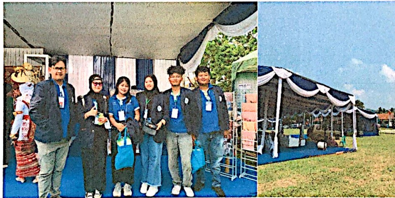
Lampiran 9. Ikut berpartisipasi kegiatan Donor Darah & Bazar UMKM yang diadakan oleh Lanal Lampung