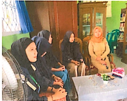
Lampiran 19. Sosialisasi ke SD Negeri 19 Padang Cermin & Melakukan pendampingan KBM di SD Negeri 19 Padang Cermin