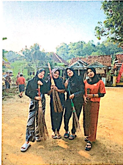
Lampiran 3. Bergotong royong bersama warga