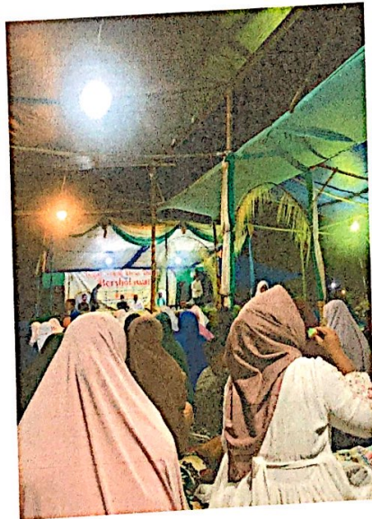
Lampiran 18. Mengikuti Pengajian & Sholawatan di Dusun III Tegal harum Desa Durian