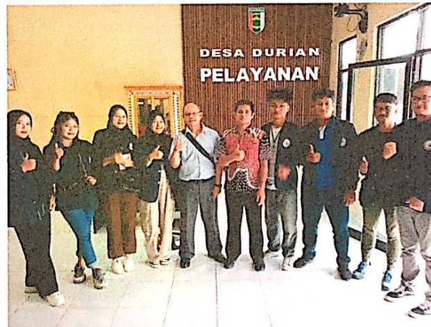
Lampiran 14. Kunjungan Bapak DPL PKPM di kantor Kepala Desa Durian