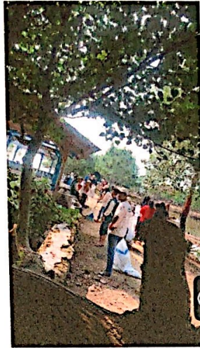
Lampiran 4. Melakukan kerja bakti Bersama Mahasiswa KKN Uin di wisata Bebek Gowes Tegal Harum Dusun III Desa Durian