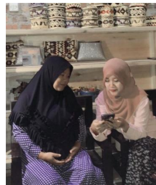
Gambar 2. 1 Pembukuan Aplikasi Krealogi

Gambar diatas menunjukkan kegiatan pembuatan aplikasi krealogi dan pembukuan untuk bulan Agustus. Dalam kegiatan membantu pemindahan pencatatan keuangan ini dilakukan satu kali dalam satu minggu.