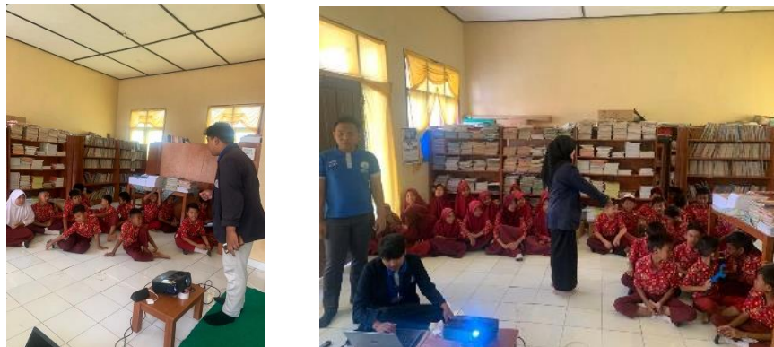
Gambar 2. 13 Sosialisasi Tentang Dampak Gadget

Sosialisasi ini bertujuan agar anak sekolah dasar mengerti tentang dampak positive dan negative penggunaan gadget, agar dapat menggunakan gadget seperlunya. Dan memberikan motivasi kepada anak sekolah dasar tentang pentingnya lanjut sekolah dan pentingnya belajar.