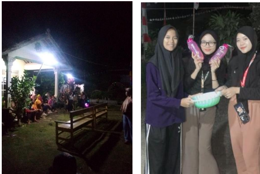
Gambar 2. 11 Panitia Lomba RT

Lomba ini dilakukan supaya menjadi kesempatan untuk masyarakat dapat bersosialisasi dan melatih kerja sama dengan masyarakat maupun mahasiswa PKPM. Lomba ini dilaksanakan untuk memeriahkan HUT RI yang Ke-78