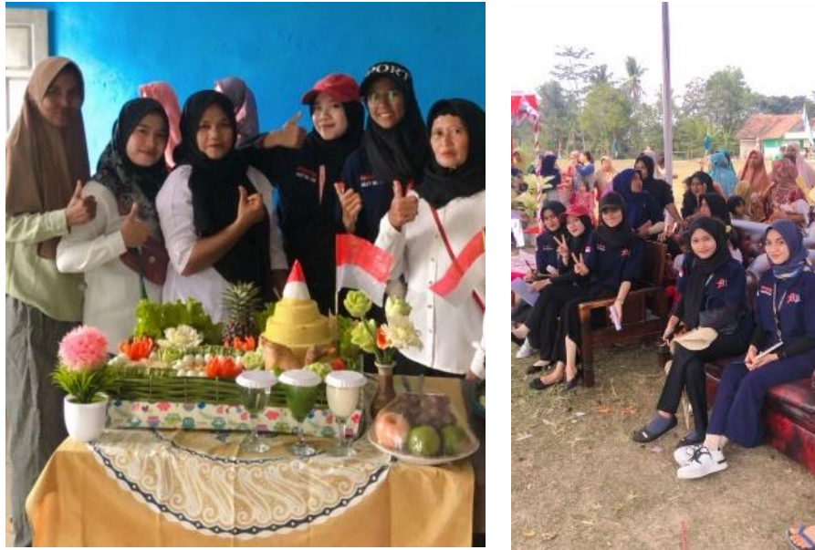
Gambar 2. 10 Upacara HUT RI dan Acara Lomba