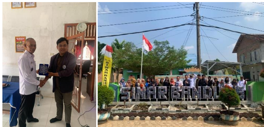
Gambar 2. 15 Perpisahan Mahasiswa PKPM

Tepat pada tanggal 30 Agustus 2023 diadakannya perpisahan mahasiswa PKPM IIB Darmajaya di Kantor Desa Sinar Bandung.