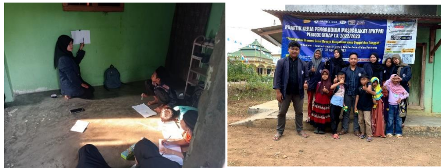
Gambar 2. 8 Mengajar Les

Kegiatan les bertujuan untuk meningkatkan minat belajar anak-anak agar tidak hanya belajar disekolah saja, juga untuk mengurangi kegiatan bermain anak-anak yang menyebabkan malas belajar. Kegiatan les dilaksanakan setiap hari jum'at, dikarenakan hanya hari itu anak-anak libur mengaji.