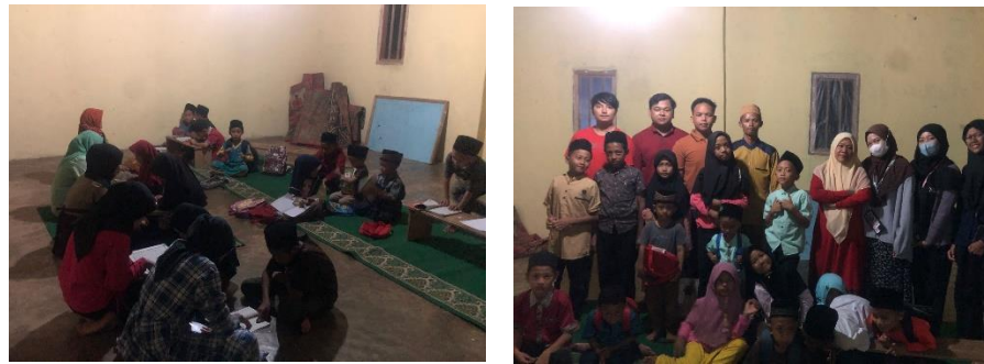
Gambar 2. 5 Kegiatan Mengajar Ngaji

Setiap malam sehabis magrib ustad/ustadzah mengadakan kegiatan mengaji untuk anak-anak, agar tidak hanya mendapatkan ilmu formal tetapi juga ilmu agama. Kami membantu ustad/ustadzah mengajar ngaji di setiap malam selasa.