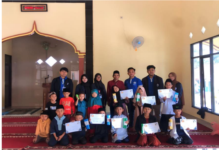
Gambar 2. 12 Lomba HUT RI di Dusun 1

Lomba ini dilakukan agar menjadikan kesempatan untuk anak-anak TPA dan RA di dusun 1 untuk dapat bersosialisasi dan melatih keberanian. Lomba dilaksanakan agar memeriahkan HUT RI Ke-78