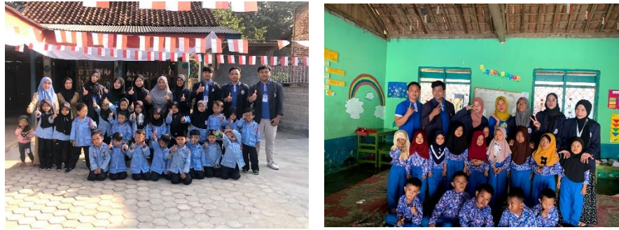
Gambar 2. 7 Kegiatan Belajar Mengajar di TK dan RA

Kegiatan belajar-mengajar di TK dilakukan agar dapat membantu guru dalam proses mengajar, dan memperkenalkan diri kepada anak-anak dan memberikan motivasi tentang pentingnya belajar. Kami melaksanakan kegiatan belajar-mengajar setiap hari Selasa dan Kamis.