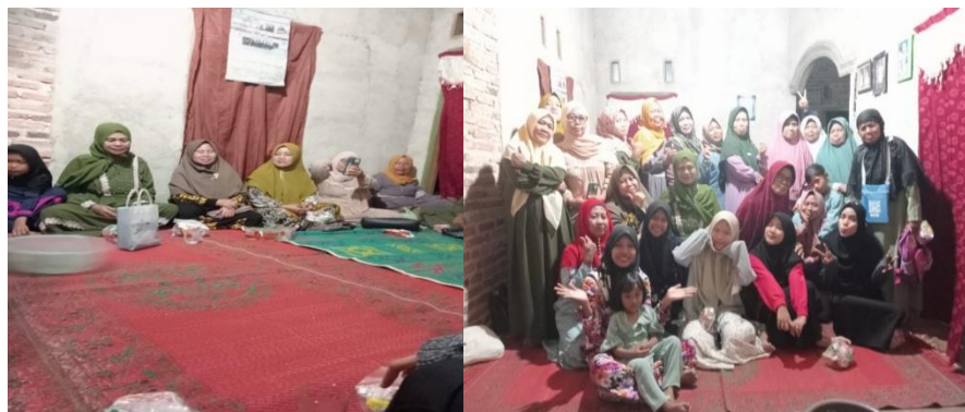
Gambar 2. 4 Kegiatan Yasinan Ibu-ibu

Dalam kegiatan sosialisasi di dalam masyarakat saya juga bergabung di dalam kegiatan rutin setiap minggu ibu-ibu di desa Sinar Bandung, yang dilaksanakan setiap malam Senin dan tidak hanya ada di satu dusun tapi hampir semua dusun memiliki kegiatan tersebut yang harinya berbeda-beda. Dengan mengikuti kegiatan masyarakat maka akan terjalinnya silaturahmi dengan desa tersebut.