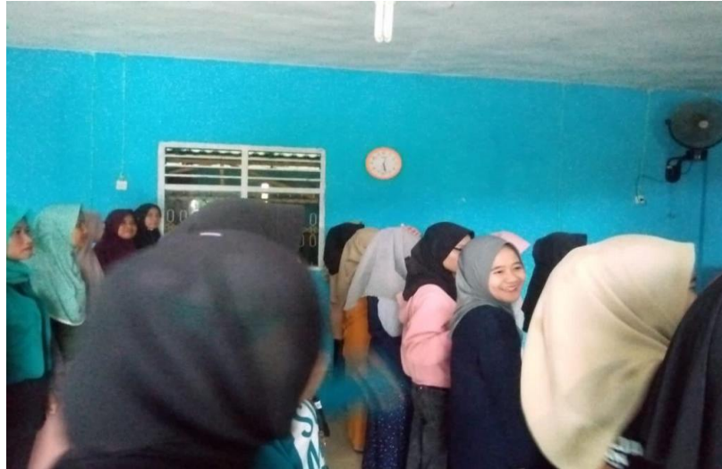
Gambar 2. 3 Latihan Paduan Suara

Dalam upacara memperingati HUT RI saat menyanyikan lagu menggunakan paduan suara, kami menjadi petugas paduan suara yang latihannya dilakukan setiap hari Selasa, Kamis dan Sabtu. Dimulai dari awal bulan sampai di akhir bulan Agustus.