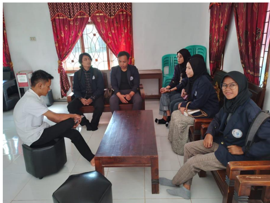
Gambar 2. 6 Piket Bersama Aparatur Desa

Piket bertujuan membantu aparatur desa yang bertugas di kantor desa, apabila adanya masyarakat yang membutuhkan surat resmi dari desa. Kami melaksanakan piket setiap hari dengan perwakilan di setiap harinya ada dua orang.