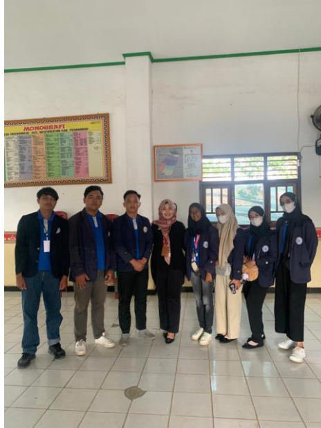
Gambar 2. 16 Pelepasan Mahasiswa PKPM

Pelepasan Mahasiswa PKPM di Balai Desa Trisno Maju pada 31 Agustus 20