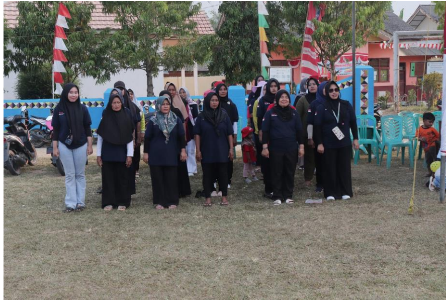
Gambar 2. 9 Gladi Bersih HUT RI Ke-78

terjadi kesalahan, Dan gladi dilakukan tanggal 15 Agustus 2023 di Lapangan Desa Sinar Bandung.