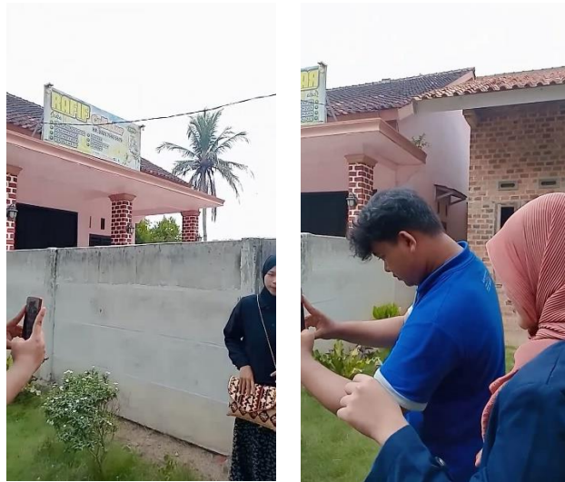
Gambar 2. 14 Pembuatan Konten Produk Untuk Tiktok

Bertujuan agar adanya daya Tarik pembeli karena melihat video yang telah dibuat tentang produk yang di hasilkan oleh UMKM tersebut, dan kegiatan ini dilakukan setiap hari sabtu.