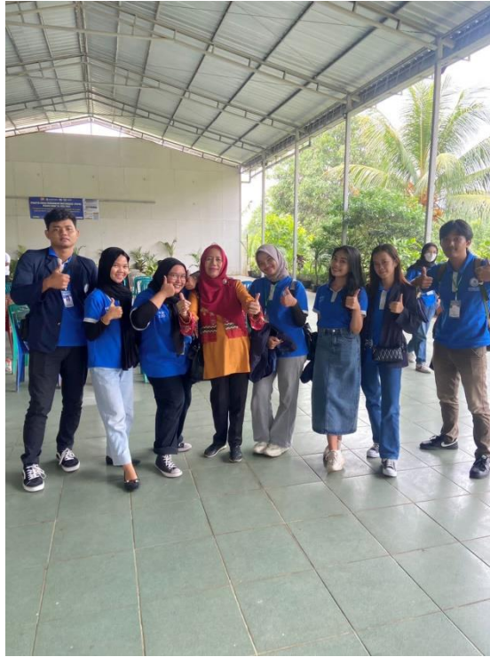
Keberangkatan mahasiswa PKPM