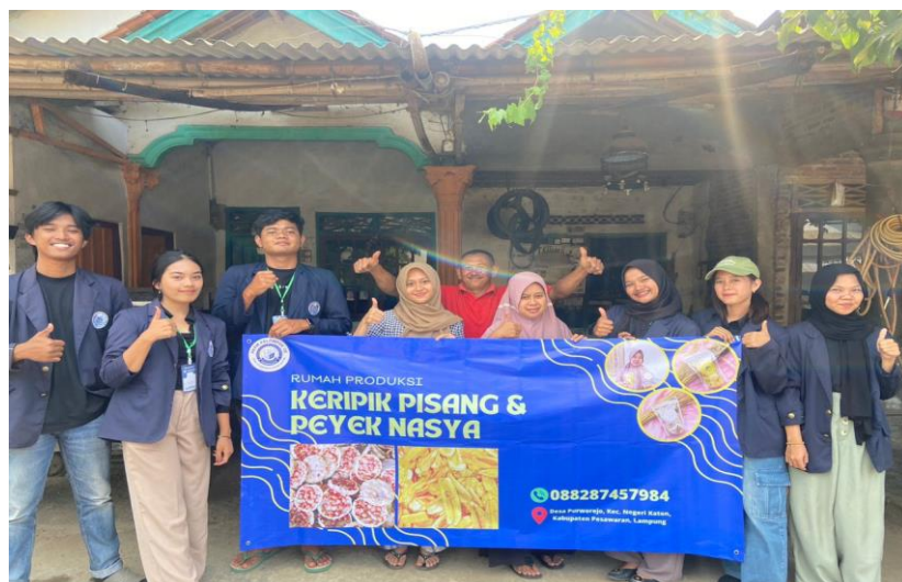
Penyerahan Benner ke UMKM