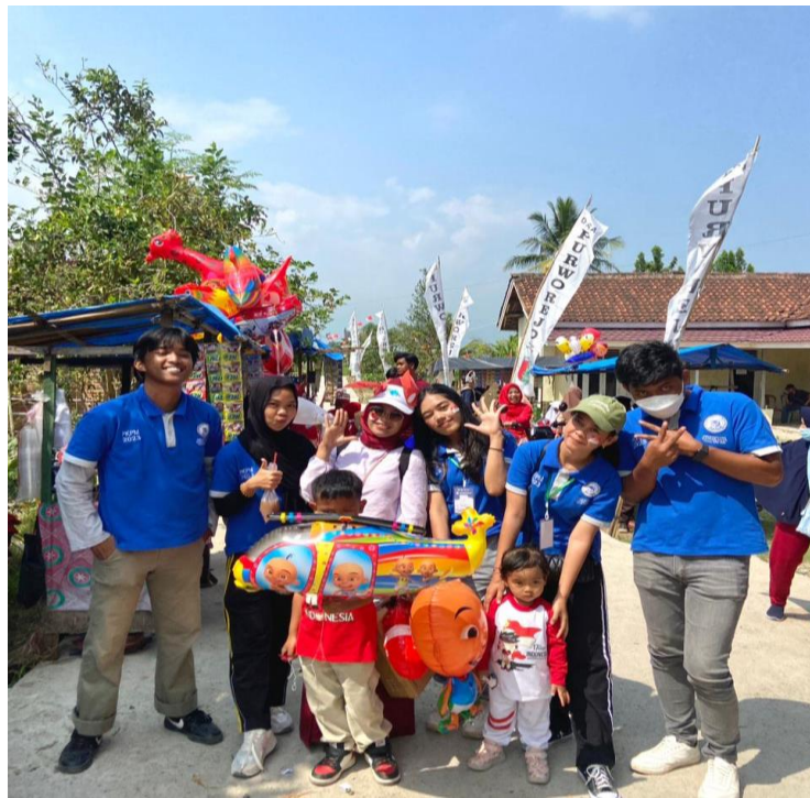
Panitia Lomba HUT RI ke-78 Desa Purworejo