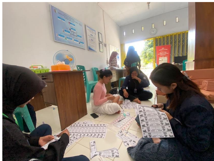
Mebuat Kupon Persiapan Jalan Sehat dan Karnaval