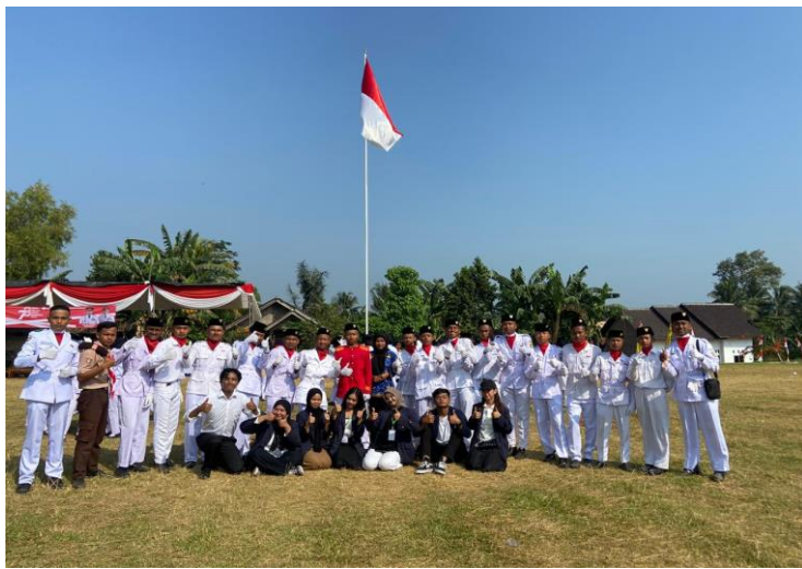
Upacara Memperingati HUT RI ke-78