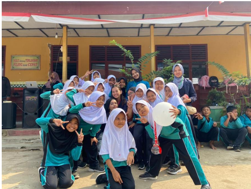
Panitia lomba HUT RI di SDN 1 Negeri Katon