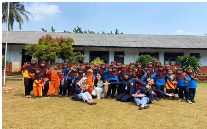
Sosialisasi Menabung di SDN 1 & 11 Negeri Katon