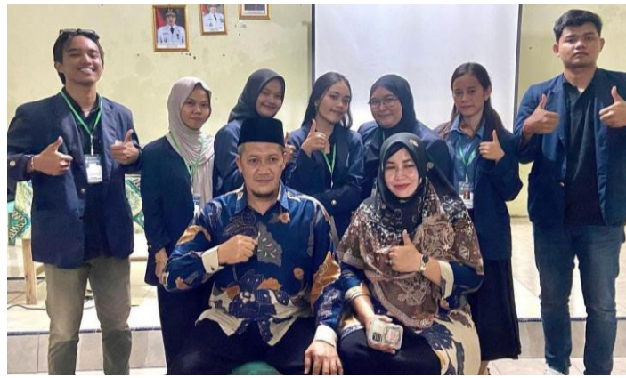
Pelepasan Kepala Desa Lama