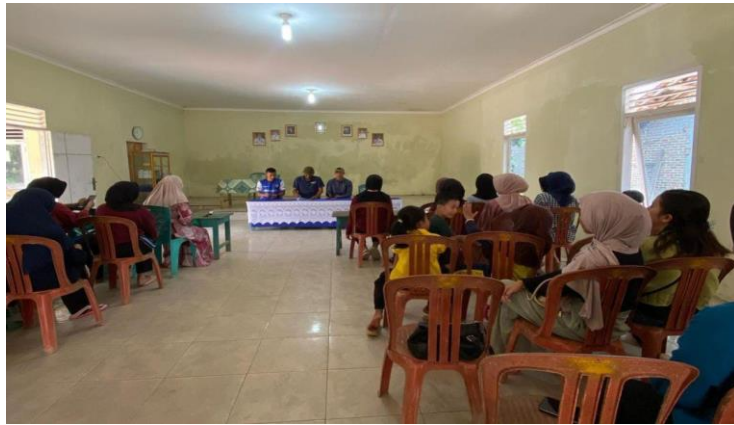
Rapat panitia HUT RI ke-78