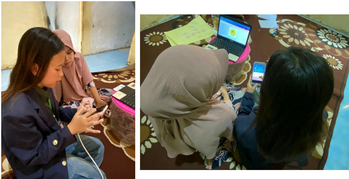
Gambar 2.1 Edukasi Pembukuan Digital