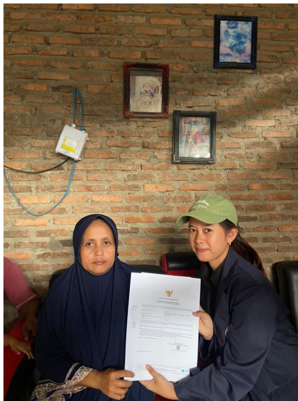
Gambar 2.2 pembuatan NIB