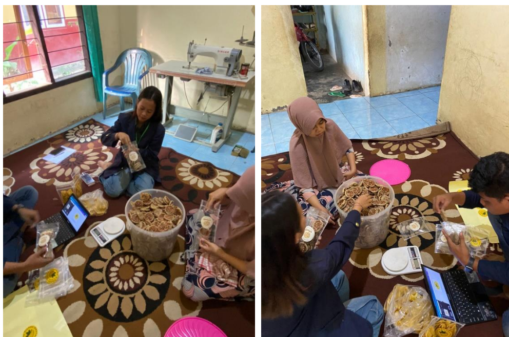
Gambar 2.9 pengemasan produk

Pada dasarnya, kemasan produk adalah salah satu hal yang sangat penting dan juga tidak bisa dipisahkan dari proses pemasaran dan distribusi pada suatu produk. Pengemasan adalah suatu bentuk kegiatan untuk memberi wadah atau pembungkus suatu produk. Tujuan utama dari memberikan kemasan pada produk adalah guna melindungi dan juga mencegah adanya kerusakan atas produk yang dijual. Selain itu, kemasan juga berguna sebagai sarana informasi dan juga pemasaran yang baik dengan membuat suatu desain kemasan yang kreatif, sehingga akan terlihat lebih menarik dan mudah diingat oleh konsumen atau pelanggan.