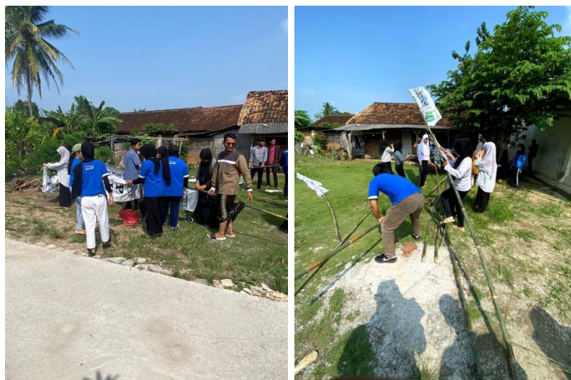
Gambar 2.3 Pemasangan Umbul-Umbul

Salah satu tujuan dari gotong royong adalah menumbuhkan sikap saling membantu antar masyarakat. Dimana orang-orang mau membantu dan menolong orang lain yang membutuhkan. Menyelesaikan suatu tantangan secara bersama, dapat mempererat tali persaudaraan, meningkatkan rasa solidaritas.