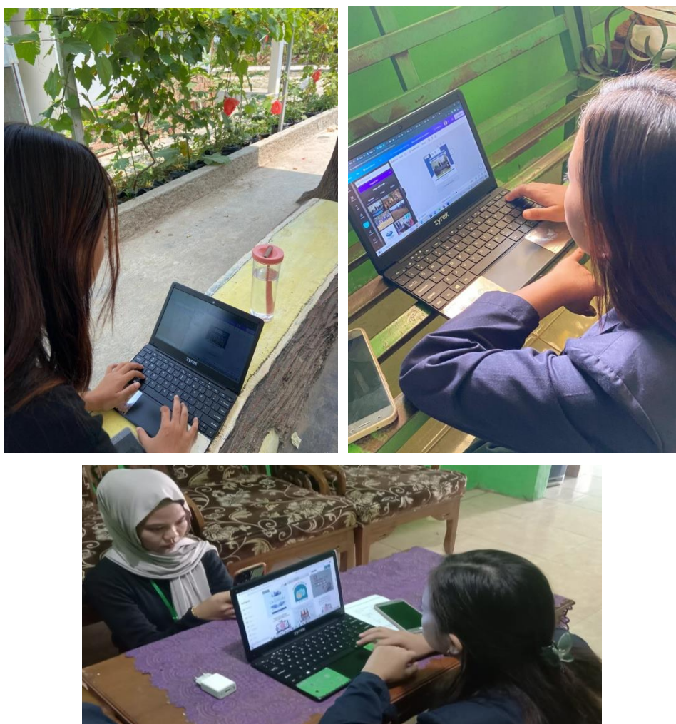
Gambar 2.8 Desain feed Intragram

Media sosial adalah sarana yang digunakan oleh orang-orang untuk berinteraksi satu sama lain dengan cara menciptakan, berbagi, serta bertukar informasi dan gagasan dalam sebuah jaringan dan komunitas virtual. Kami mengakomodasi untuk mengaktifkan dan membuat desain Sosial Media Perpustakaan Purworejo seperti, Instagram, Facebook dan Tiktok.