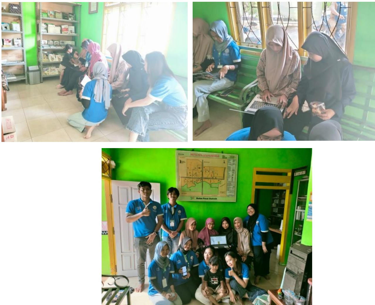
Gambar 2.7 Pelatihan Website SiMoniK Kepada Pelaku UMKM dan BUMDes

UMKM yang berada di Desa Purworejo dapat terdaftar pada website tersebut.