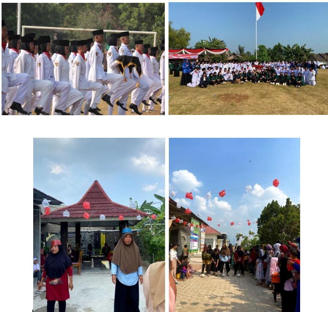
Gambar 2.5 Upacara HUT-RI Ke-78 dan Lomba Tujuh Belasan