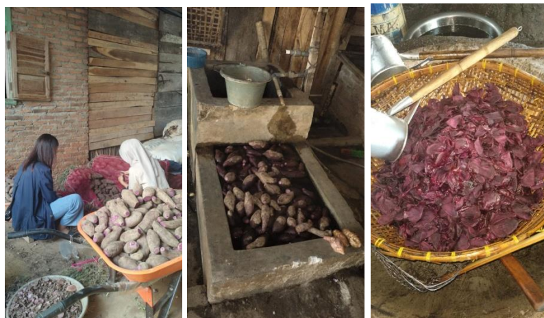
Gambar 2.4 Proses Pembuatan Keripik Ubi Ungu dan Tales

terang mengenai program kerja yang akan dilaksanakan agar dapat membantu dari segala permasalahan. Kemudian Selasa, 22 Agustus 2023 kami melakukan kegiatan pembuatan keripik ubi ungu dan tales dari proses pengupasan hingga penggorengan.