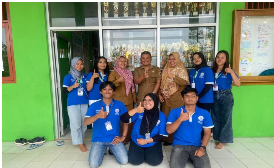
Gambar 2.10 Kunjungan ke Smkn 1 Negeri Katon

kunjungan dilakukan untuk menjalin tali silaturahmi serta meminta izin untuk melakukan sosialisasi di SMKN 1 Negeri Katon.