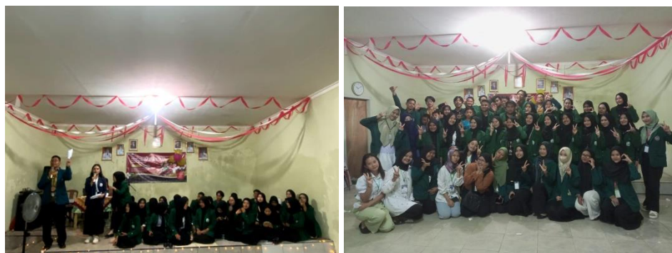
Gambar 2.6 Malam Puncak HUT-RI Ke-78 dan Perpisahan Mahasiswa KKN UIN RIL