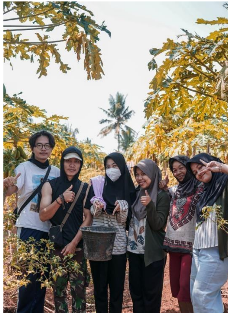
Gambar 11 Berkunjung ke Ladang Simbah