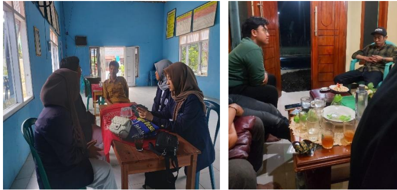
Gambar 9 Berbincang terkait Progja bersama aparat Desa Margorejo