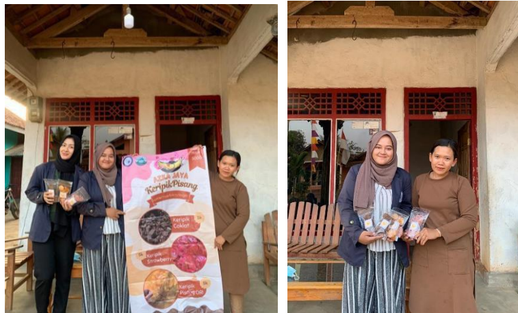
Gambar 24 Penyerahan Banner kepada UMKM Keripik Pisang