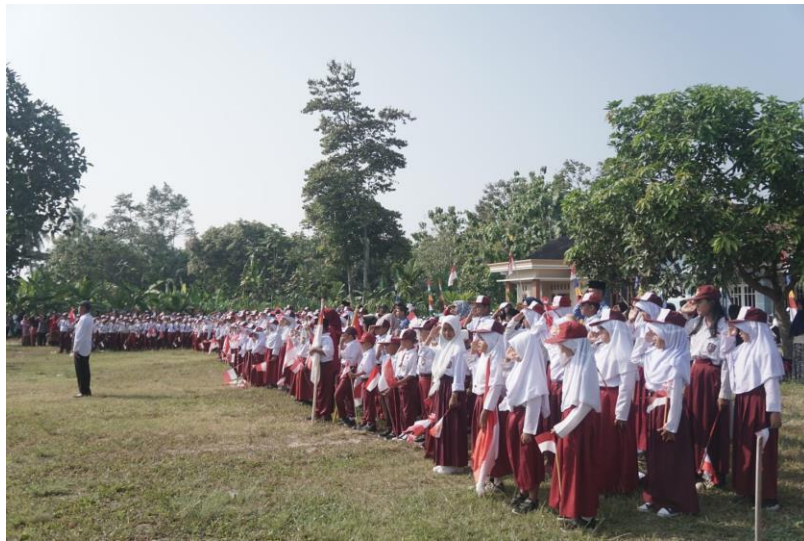
Gambar 17 HUT RI Ke-78 di Desa Margorejo