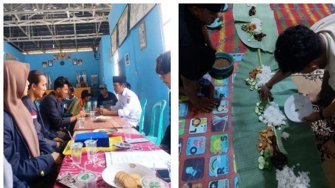
Gambar 25 Acara Perpisahan dengan Aparat Desa