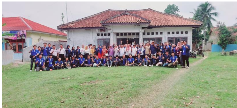
Gambar 2 Pelepasan Peserta PKPM di Kecamatan Tegineneng