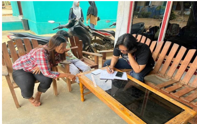
Gambar 12 Pendataan Buku Kas UMKM