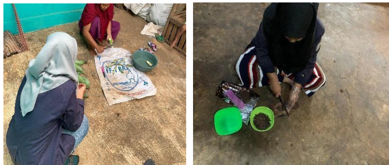
Gambar 4 Proses Pembuatan Keripik Pisang Lumer