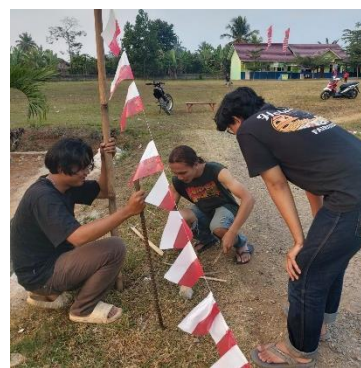
Gambar 19 Panitia Lomba 17 Agustus