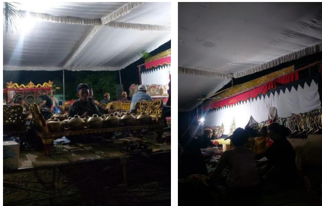
Gambar 21 Membantu Acara Wayang di Kediaman Pak Kades