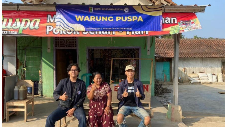
Gambar 23 Pemasangan Banner Warung