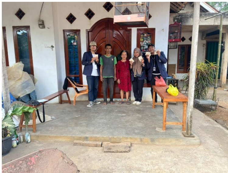
Gambar 22 Berkunjung ke UMKM Tempe