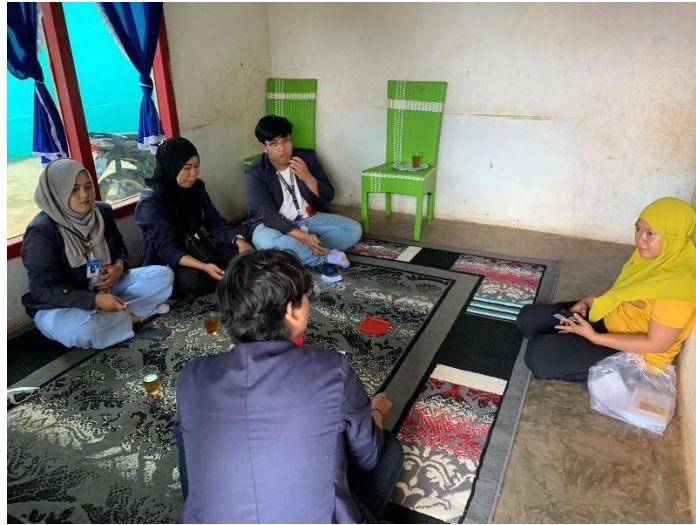
Gambar 3 Survei UMKM Keripik Pisang