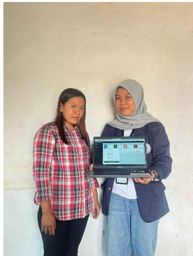
Gambar 13 Pembuatan Akun SIMONIK