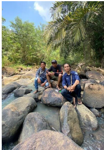
Gambar 10 Survei Curug di Desa Margorejo