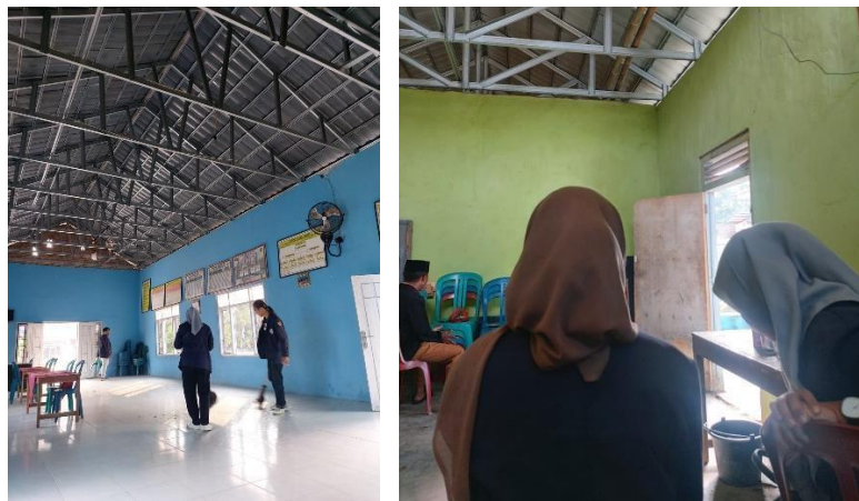
Gambar 5 Piket Balai Desa