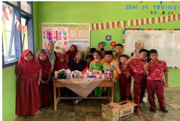
Gambar 7 Sosialisasi Menabung dari Botol Bekas di SDN 34 Tegineneng