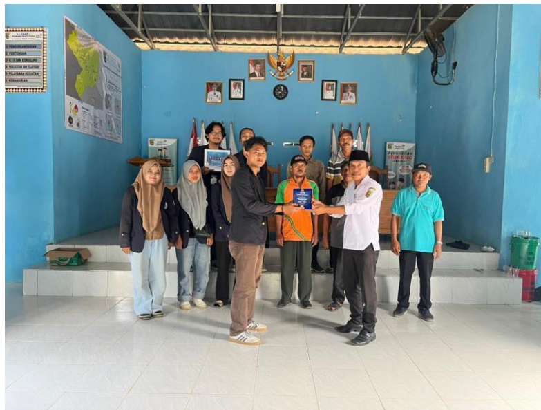
Gambar 26 Penyerahan Cenderamata pada Pihak Desa