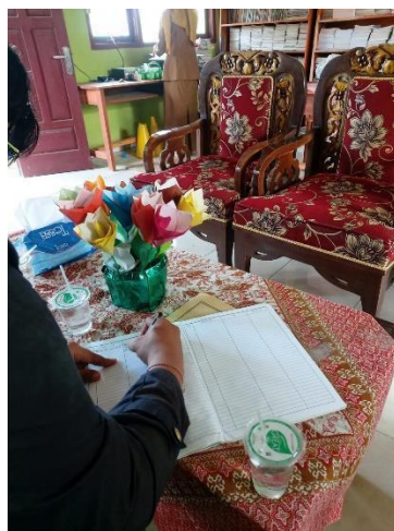
Gambar 6 Meminta Izin Pada Pihak Sekolah untuk Mengadakan Sosialisasi di SD N 34 Tegineneng