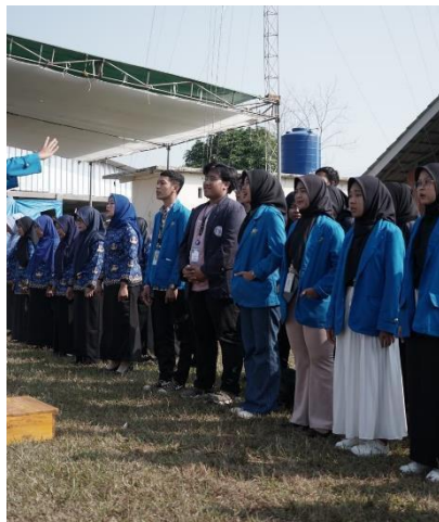
Gambar 18 Petugas Paduan Suara Hari Pramuka dan HUT RI