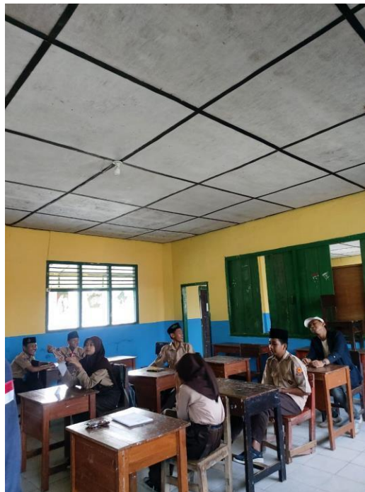
Gambar 8 Sosialisasi di MTS Qomarul Hidayah Terkait Diskriminasi dan Bullying