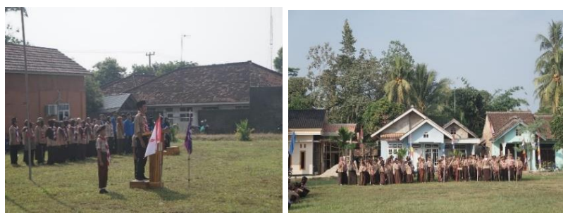
Gambar 16 Perayaan Hari Pramuka