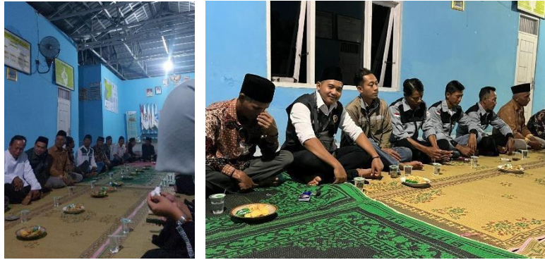
Gambar 20 Menghadiri Acara Lintas Agama di Balai Desa