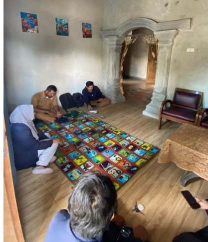
Gambar 1 Survei Rumah untuk tempat tinggal selama PKPM