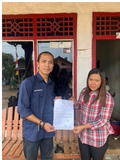
Gambar 14 Penyerahan Surat Legalitas Usaha pada UMKM