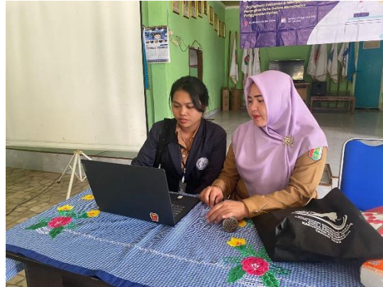
Gambar 1.2 Pembuatan Blogspot Desa Negeri Katon

Desa Negeri Katon merupakan salah satu desa di Kecamatan Negeri Katon yang belum memiliki website desa. Maka dari itu kami membuatkan akun blogspot sebagai alternatif lain dari website domain. Ini karena saat pembuatan website domain terkendala akses eror dari kominfo pusat.