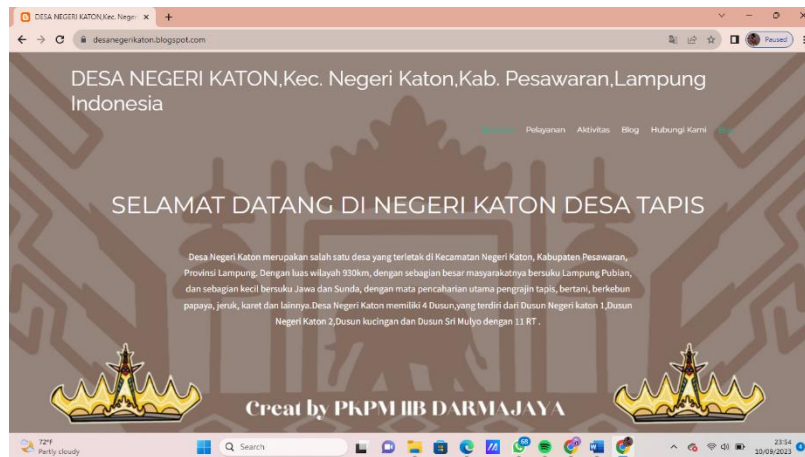
Gambar 1.1 Tampilan Beranda Awal Blogspot

Teknis pembuatan dan pengelolaannya tetap sama, blog selalu diperbarui secara berkala. Blog memang dibuat untuk memposting tulisan-tulisan yang ingin ditunjukkan untuk orang banyak, tetapi tidak ada salahnya bila blog yang dibuat juga disisipi dengan hal-hal yang menarik. Blog bisa diberi aksesoris gambar, atau bahkan foto yang mempermudah untuk mendapat informasi yang lebih jelas.