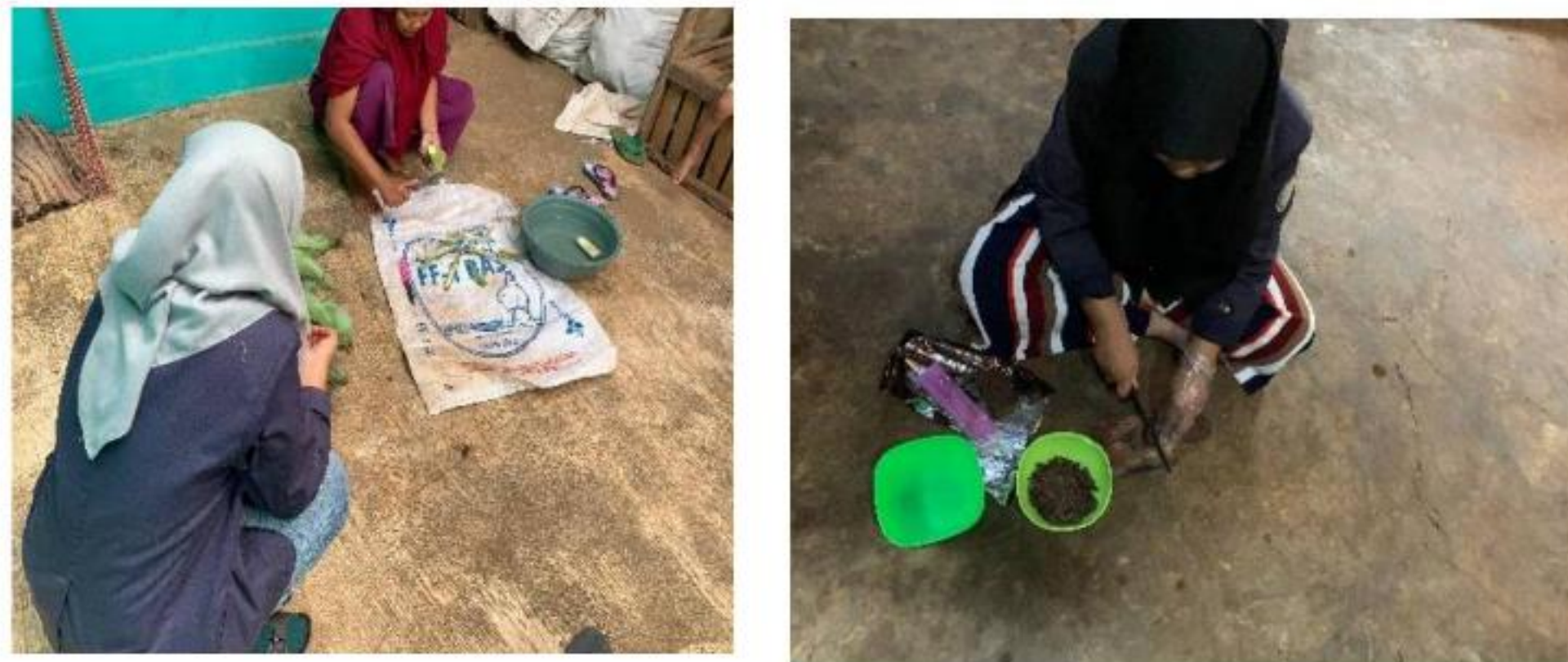
Gambar 4, Proses Pembuatan Keripik Pisang Lumer