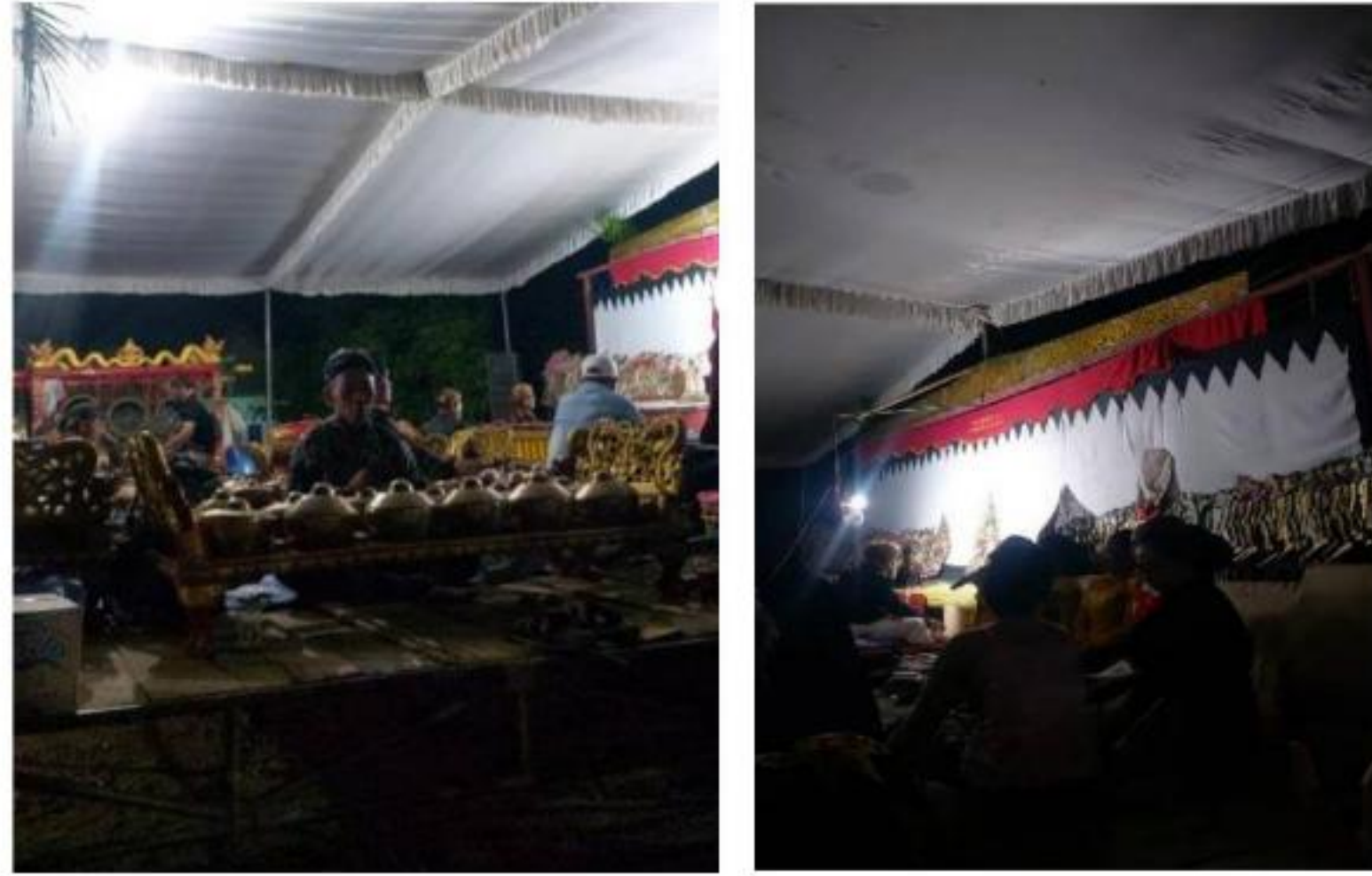
Gambar 21 Membantu Acara Wayang di Kediaman Pak Kades