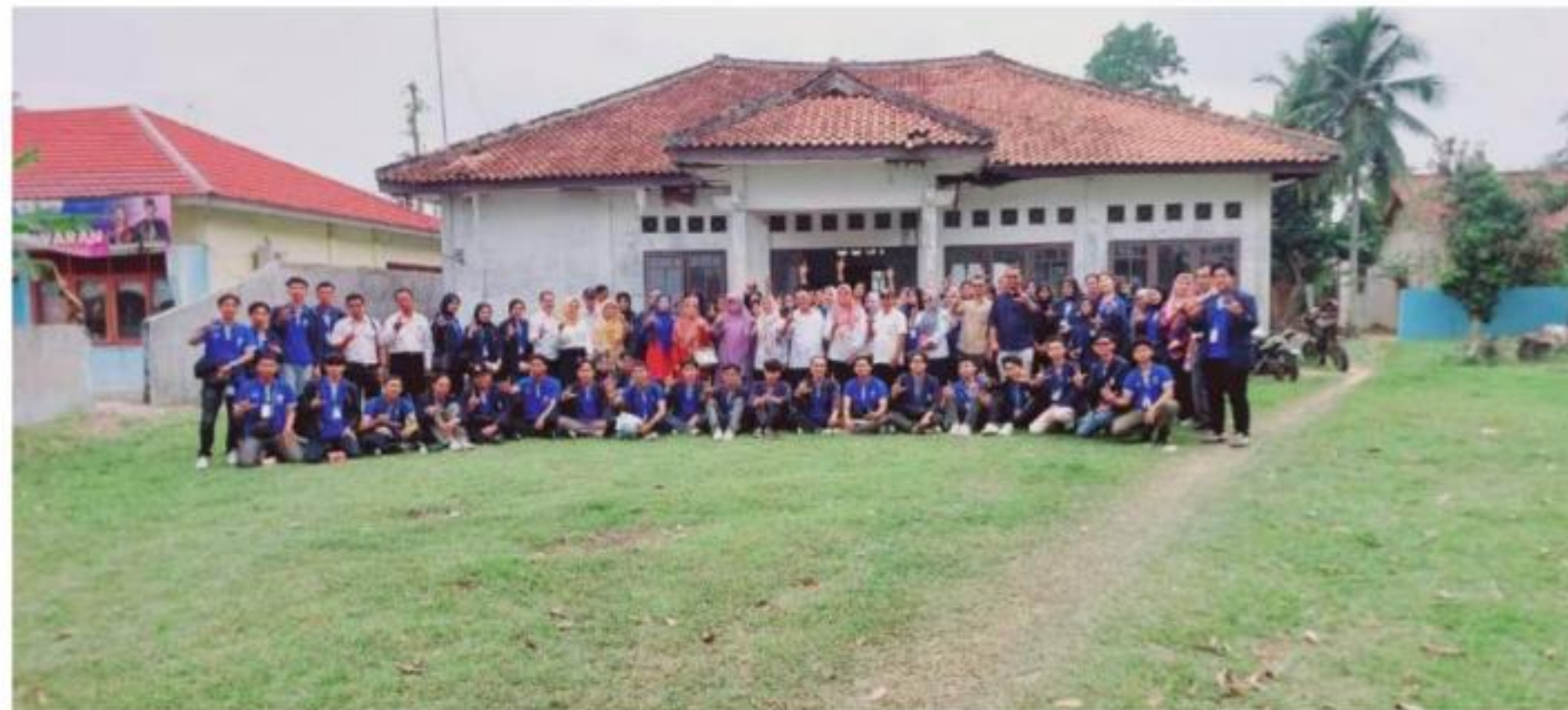
Gambar 2, Pelepasan Peserta PKPM di Kecamatan Tegineneng