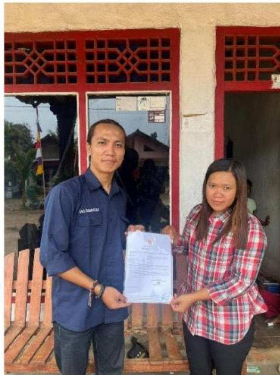
Gambar 14 Penyerahan Surat Legalitas Usaha pada UMKM