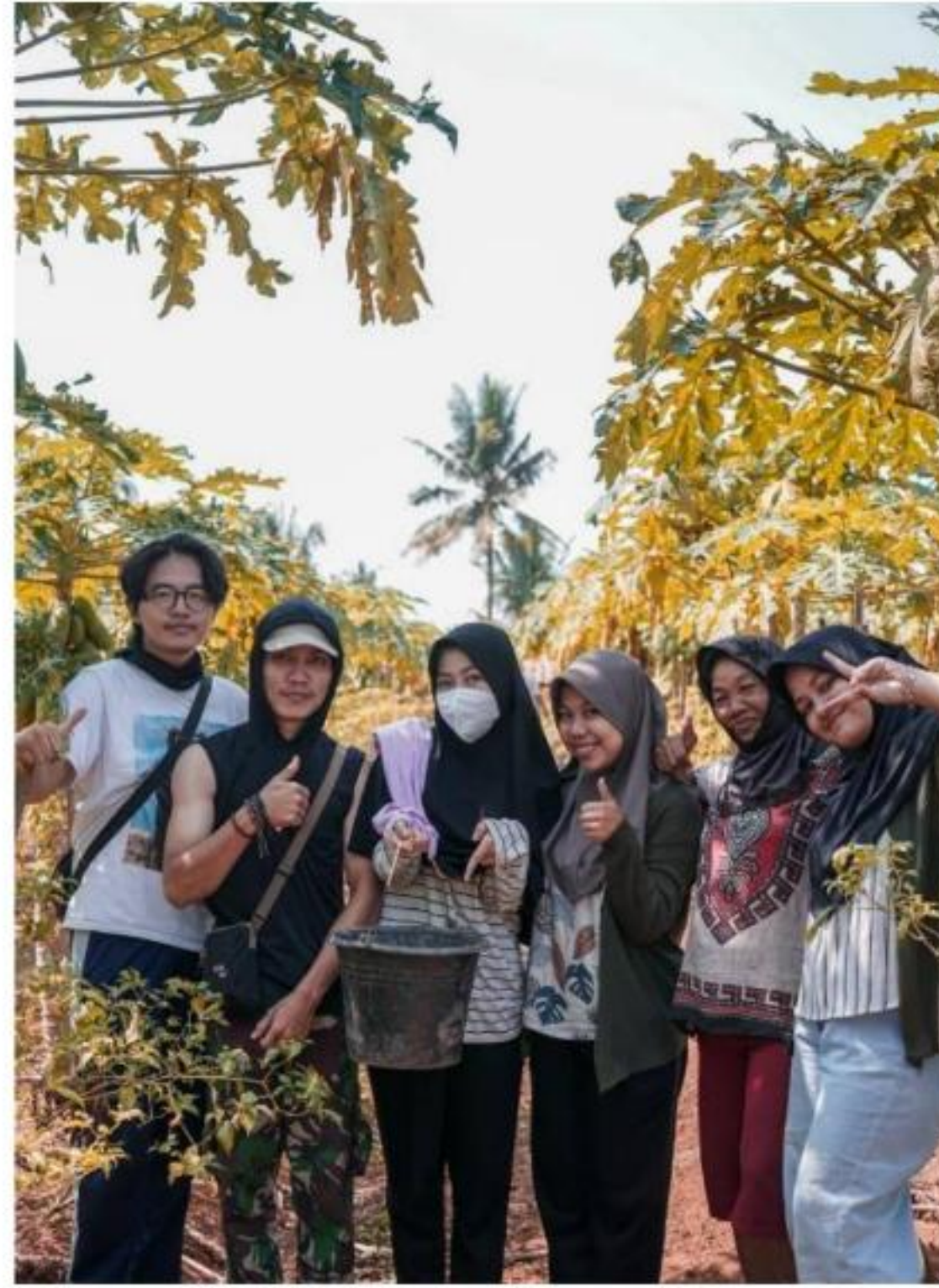
Gambar 11 Berkunjung ke Ladang Simbah