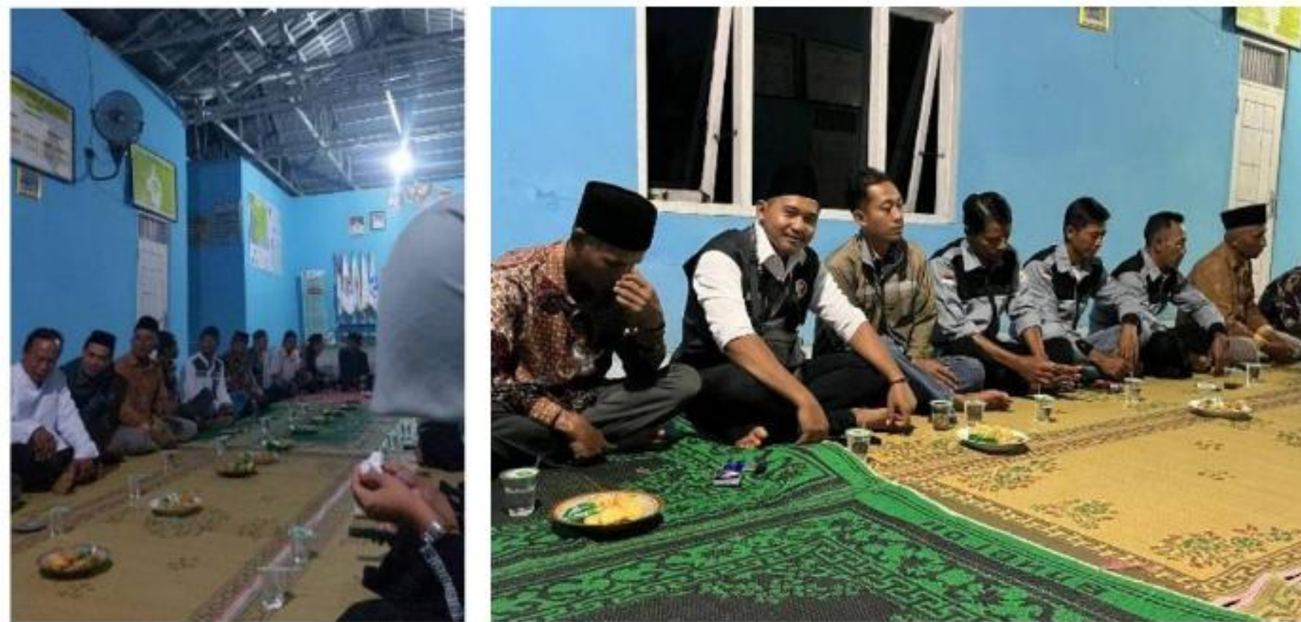
Gambar 20 Menghadiri Acara Lintas Agama di Balai Desa