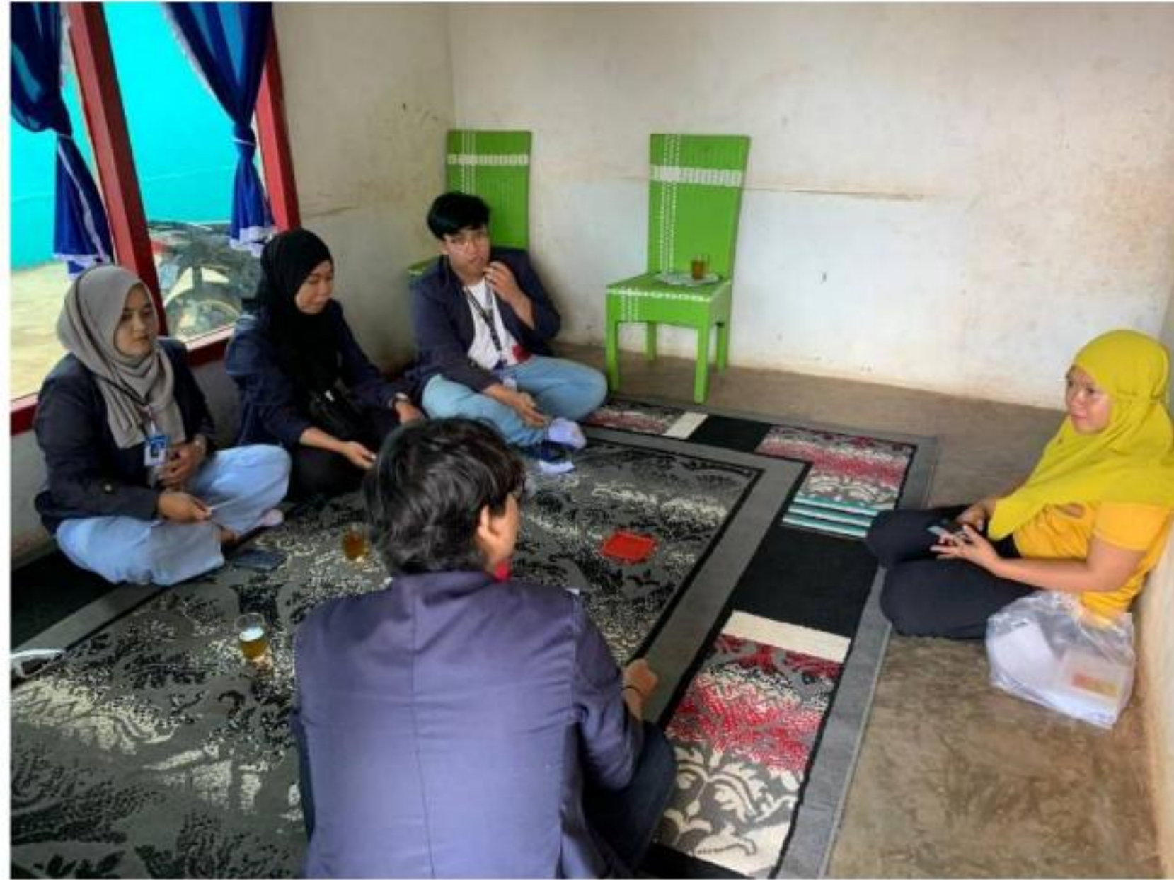
Gambar 3, Survei UMKM Keripik Pisang