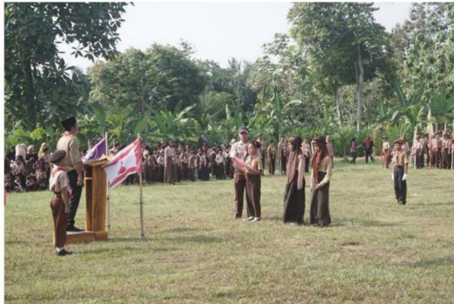
Gambar 17 Perayaan Hari Pramuka