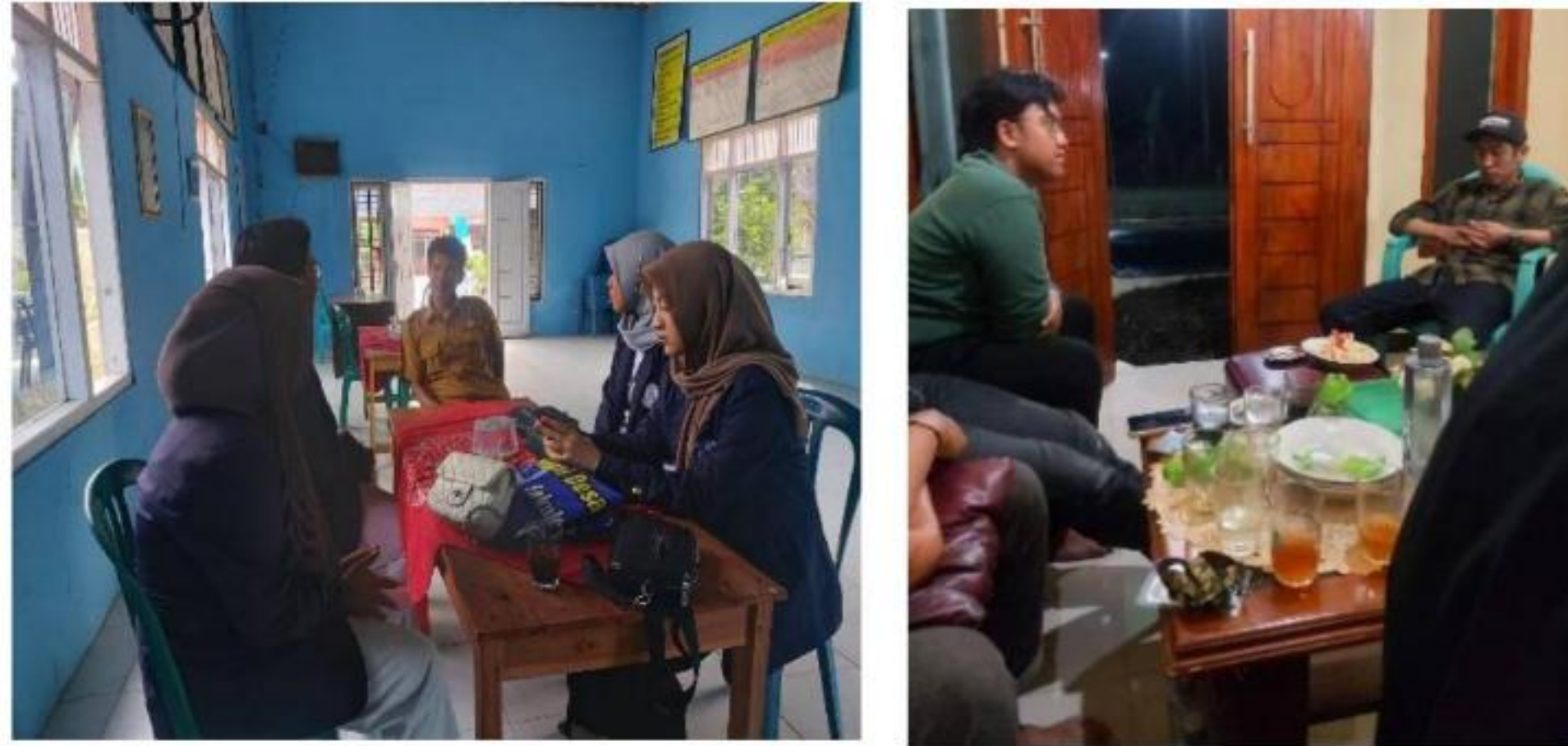
Gambar 9 , Berbincang terkait Progja bersama aparat Desa Margorejo