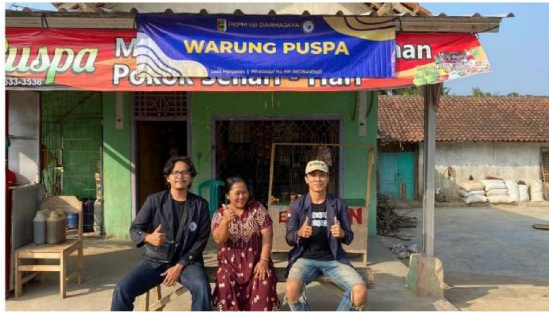
Gambar 23 Pemasangan Banner Warung