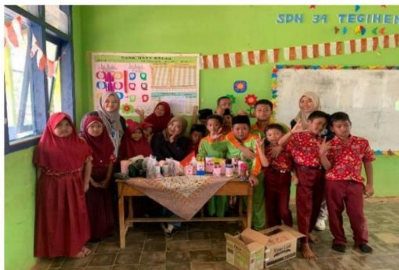
Gambar 7 Sosialisasi Menabung dari Botol Bekas di SDN 34 Tegineneng