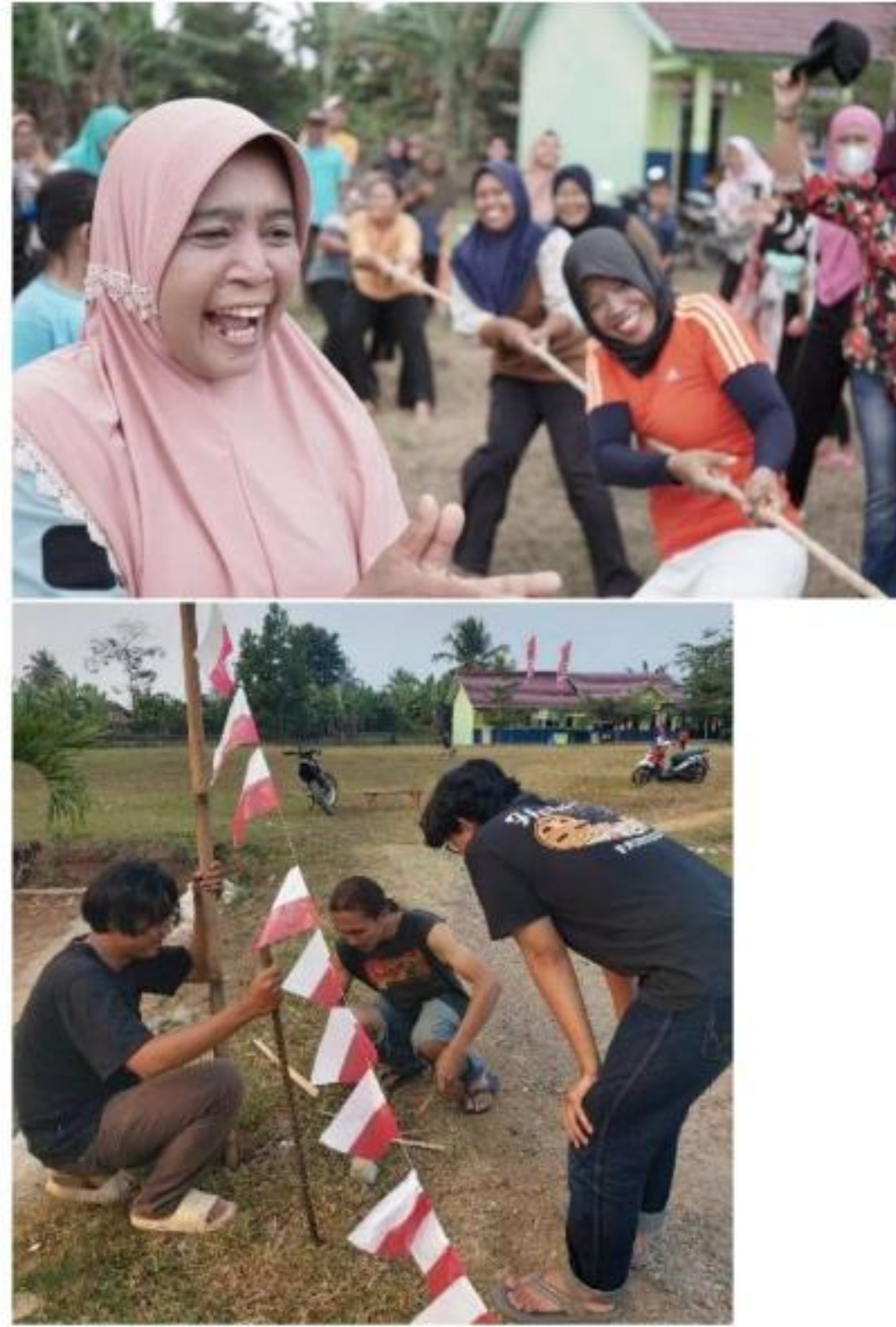
Gambar 19 Panitia Lomba 17 Agustus