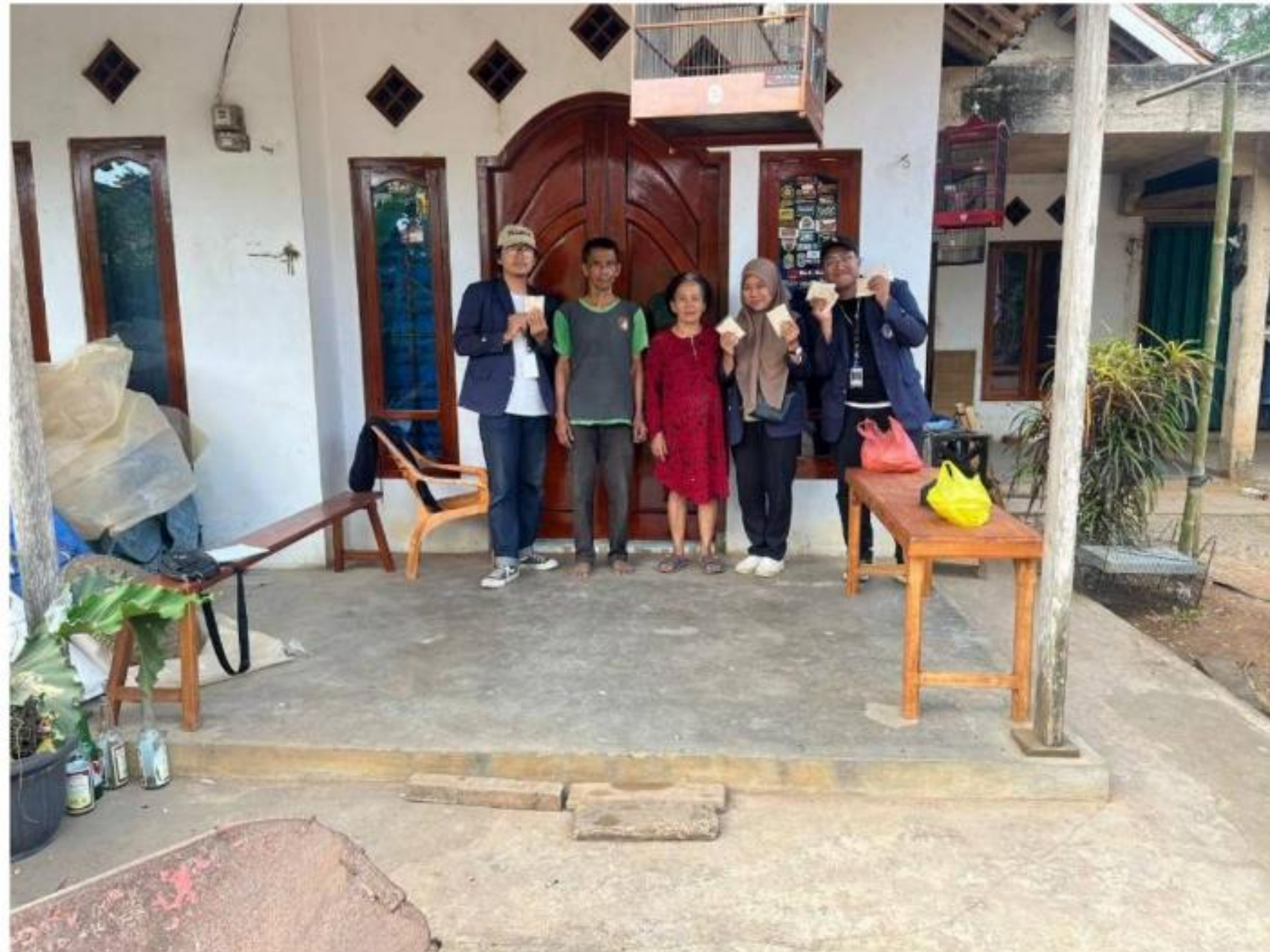
Gambar 22 Berkunjung ke UMKM Tempe