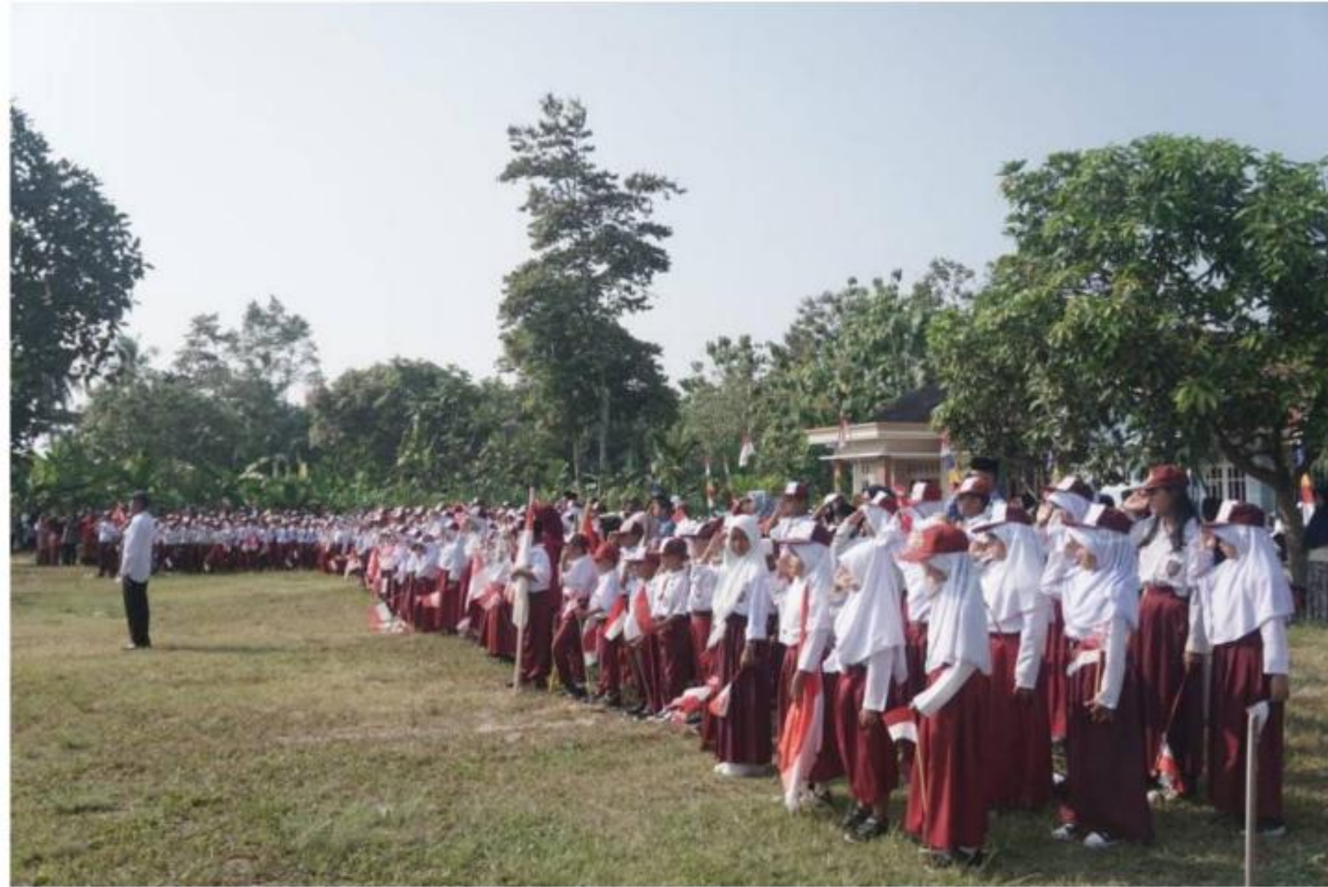
Gambar 16 HUT RI Ke-78 di Desa Margorejo