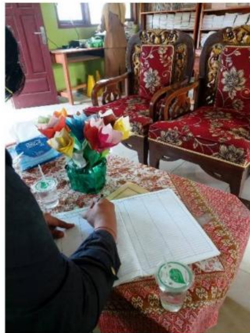
Gambar 6 , Meminta Izin Pada Pihak Sekolah untuk Mengadakan Sosialisasi di SD N 34 Tegineneng