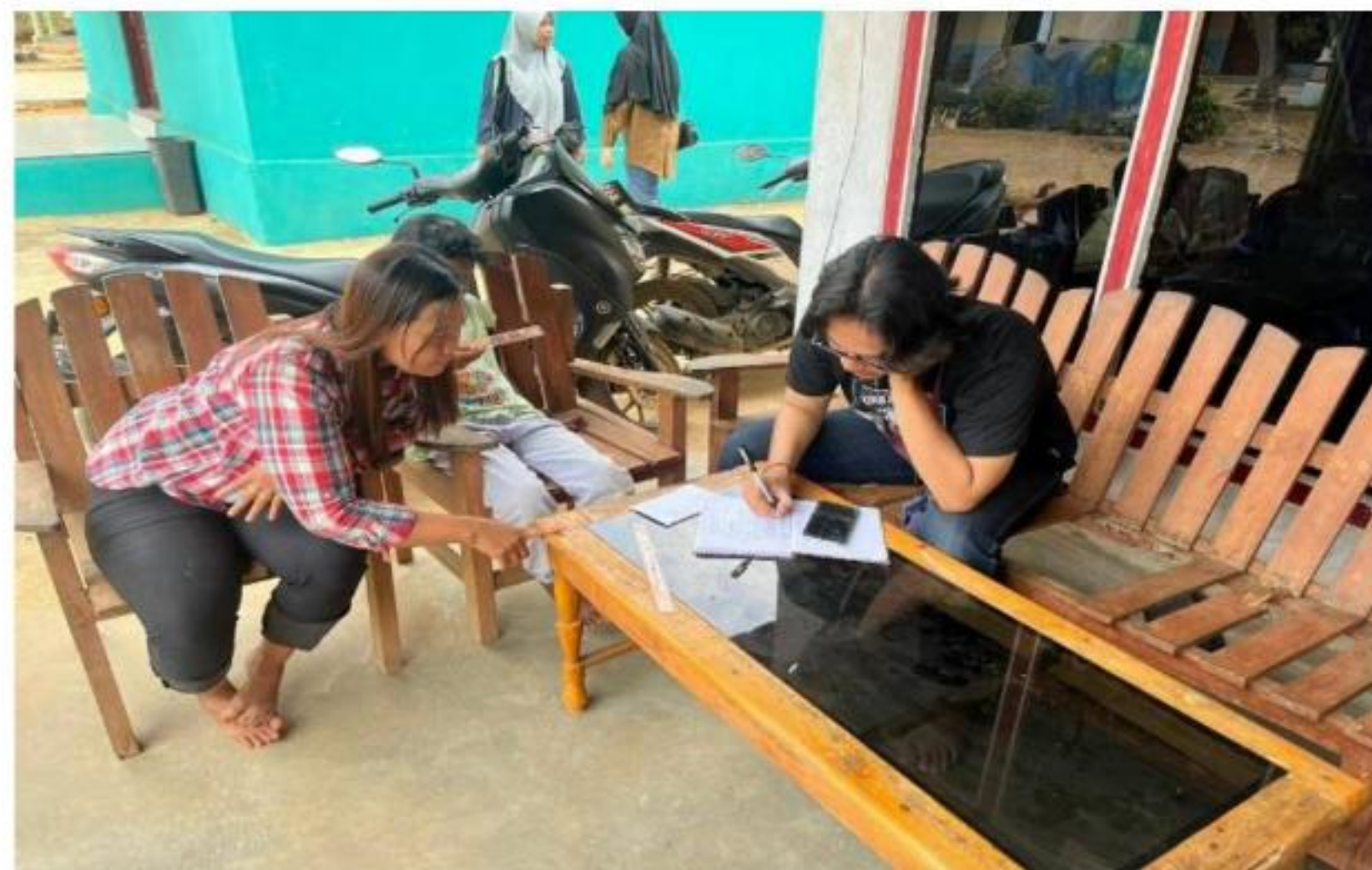
Gambar 12 Pendataan Buku Kas UMKM