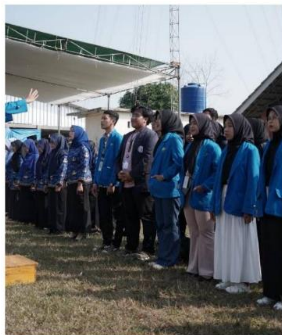
Gambar 18 Petugas Paduan Suara Hari Pramuka dan HUT RI