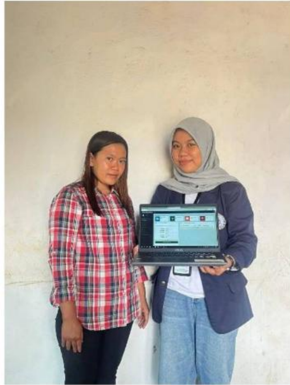
Gambar 13 Pembuatan Akun SIMONIK