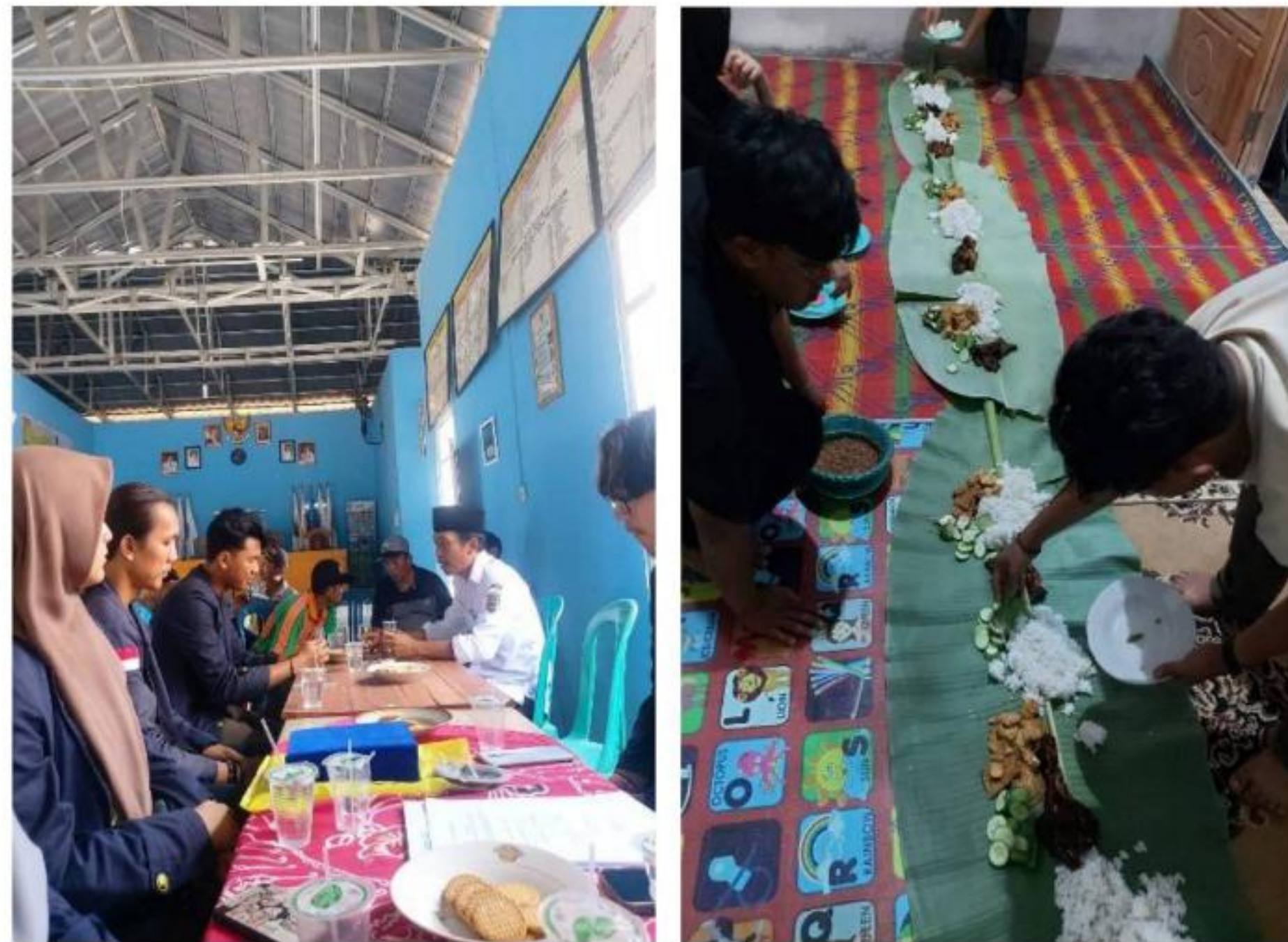
Gambar 25 Acara Perpisahan dengan Aparat Desa