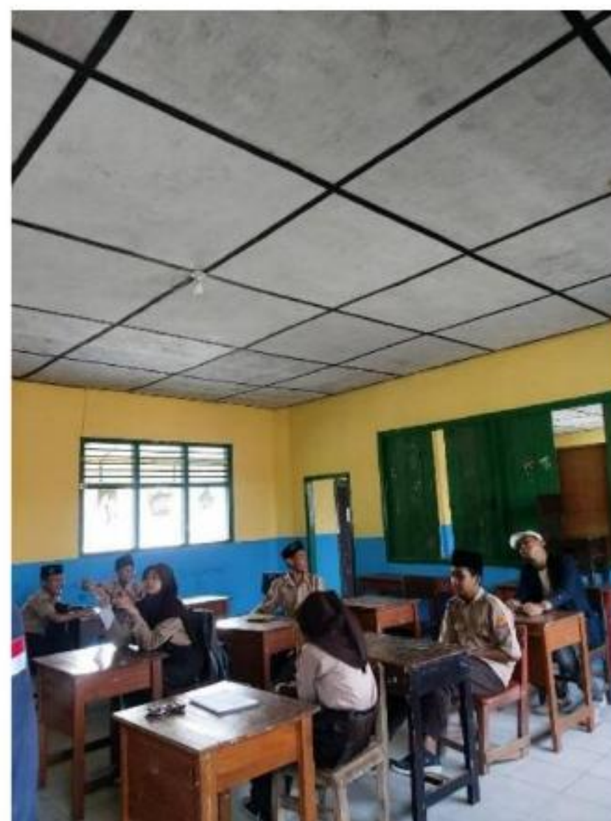
Gambar 8 , Sosialisasi di MTS Qomarul Hidayah Terkait Diskriminasi dan Bullying