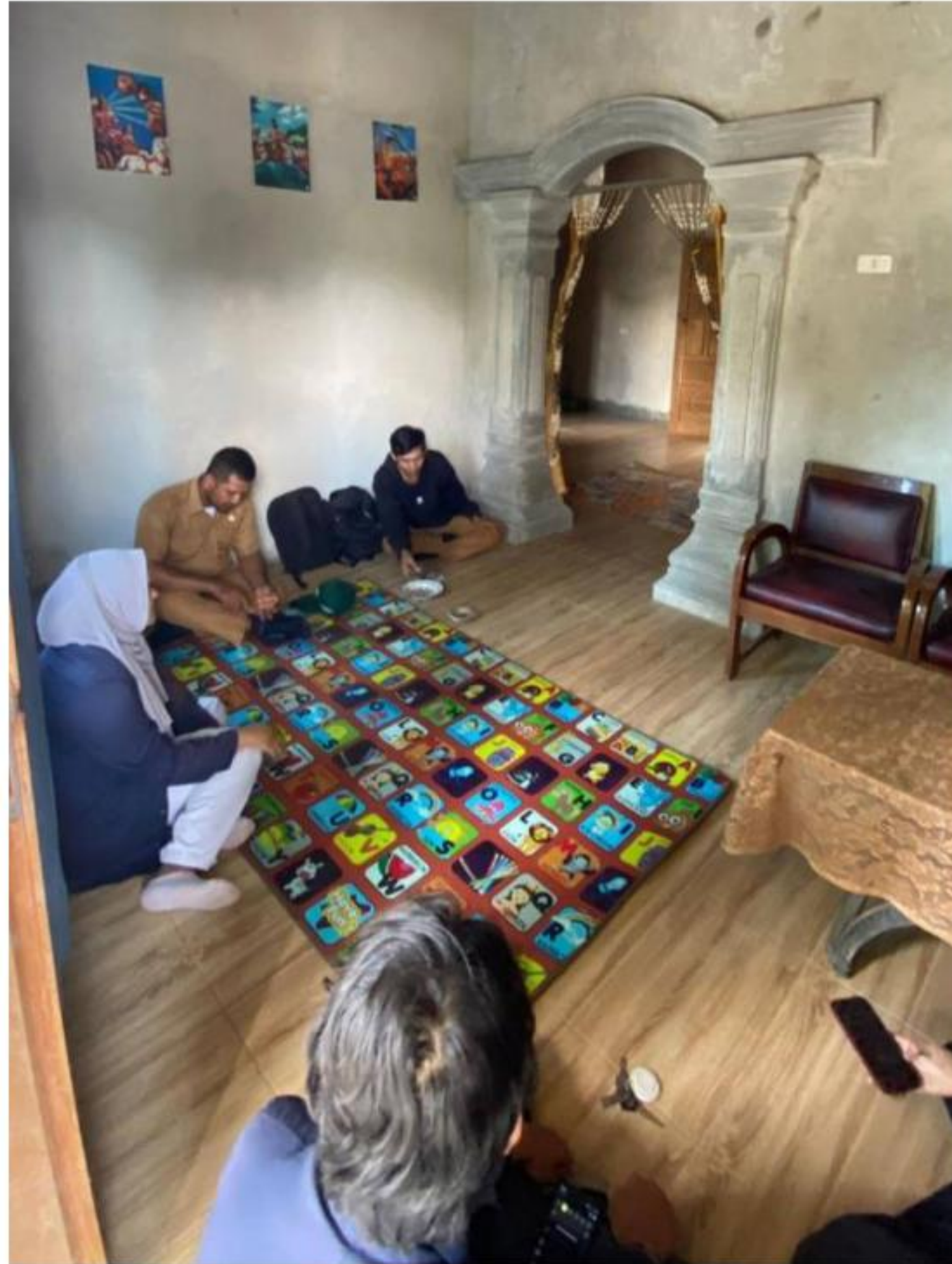
Gambar 1, Survei Rumah untuk tempat tinggal selama PKPM