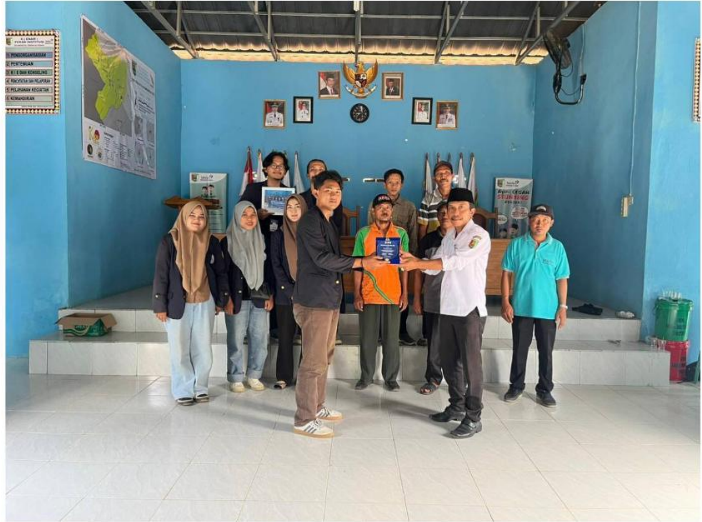
Gambar 26 Penyerahan Cenderamata pada Pihak Desa