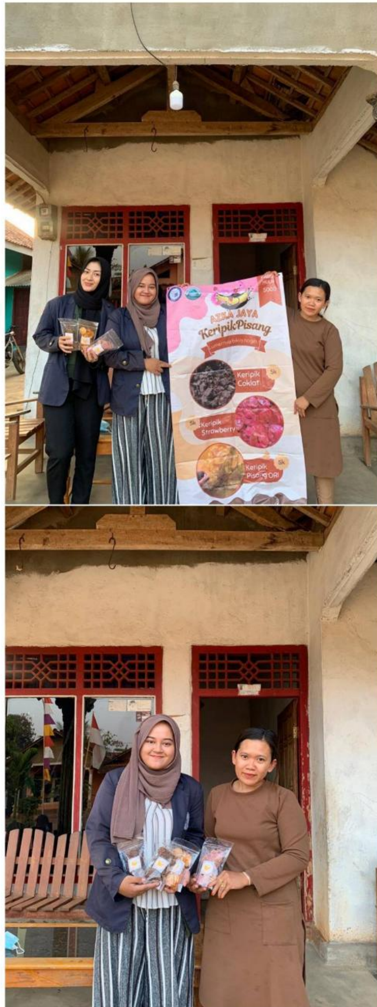
Gambar 24 Penyerahan Banner kepada UMKM Keripik Pisang