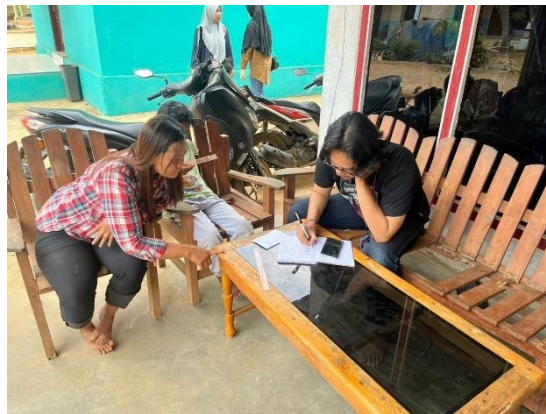
Gambar 3, Pelatihan Penyusunan Pencatatan Keuangan Secara Manual