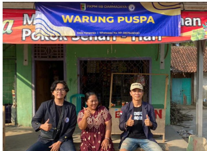
Gambar 8 , Hasil pemasangan banner pada warung di Desa Margorejo