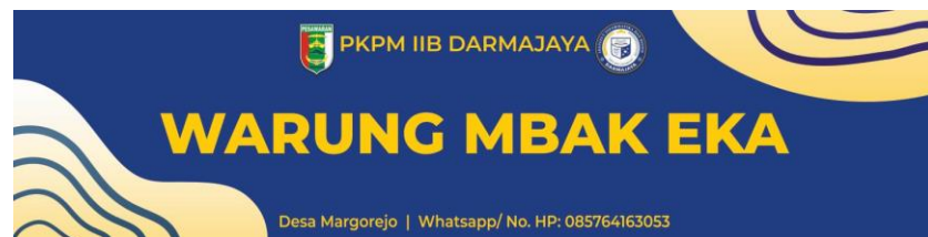
Gambar 6 , Hasil desain banner bagi warung di Desa Margorejo

Melakukan pembuatan desain banner bagi warung di Desa Margorejo yang nantinya sebagai penanda nama warung untuk memudahkan warga margorejo dalam mengingat warung yang dituju. Dalam desain banner terdapat nama warung serta no telepon pemilik warung sehingga dapat dihubungi oleh pembeli. Pemasangan banner dilakukan pada warung warung yang berada di jalan utama Desa Margorejo dimulai dari gapura selamat datang hingga batas akhir pada balai desa Margorejo. Selain untuk membantu pemilik warung untuk mendapatkan banner, pembuatan banner warung sebagai cindramata dari kelompok PKPM.