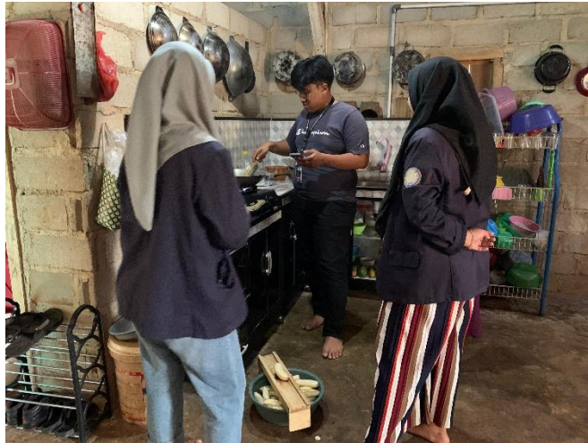
Gambar 5 , Proses pembuatan keripik pisang Azka Jaya