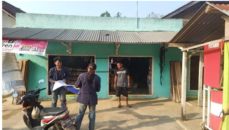
Gambar 7 , Proses pemasangan banner pada warung di Desa Margorejo