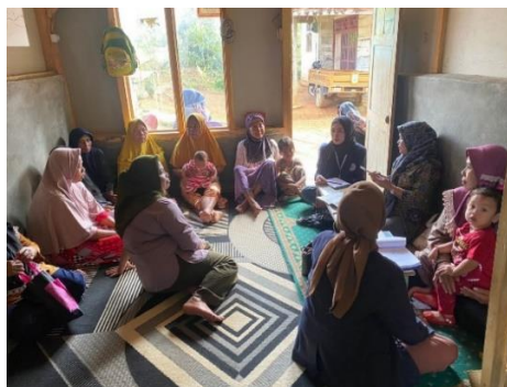
Gambar 2.7 Posyandu Balita