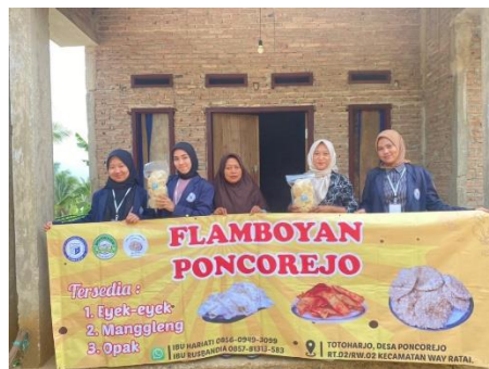
Gambar 2.13 Penyerahan Banner ke UMKM Eyek-Eyek

Dengan adanya Banner atau biasa orang mengenalnya dengan sebutan spanduk, banner sendiri memiliki manfaat penting untuk Branding UMKM Eyek-Eyek dan Telur Asin. Banner biasa digunakan untuk memberikan informasi dan merek penjualan bisnis. Tujuan dari pemasangan banner merupakan buat mempromosikan ataupun mengiklankan suatu sehingga menarik atensi lebih banyak orang kala melihatnya.