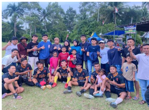
Gambar 2.2 Partisipasi Tournamen Sepak Bola

Ikut berpartisipasi kepanitiaan dalam acara Open Tournamen Sepak Bola di Dusun Totoharjo, Desa Poncorejo yang diikuti oleh 3 Kabupaten, meliputi Kabupaten Pesawaran, Pringsewu, dan Tanggamus. Kegiatan ini juga bertujuan untuk silaturahmi dan persahabatan antar Kabupaten.