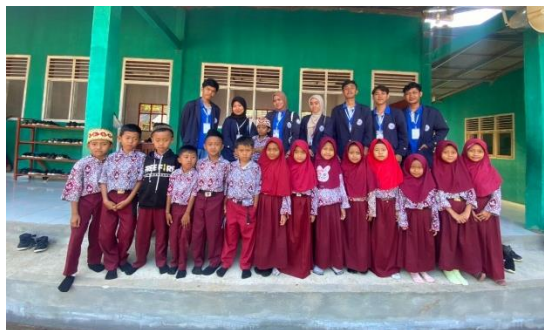
Gambar 2.4 Sosialisai Di MI AN-NIDA

Sosialisasi di MI AN-NIDA di desa Poncorejo dengan tema “STOP BULLYING” yang bertujuan untuk memberikan informasi kepada para siswa-siswi mengenai pengertian dan pentingnya pencegahan Bullying yang ada di lingkungan sekolah sejak dini.