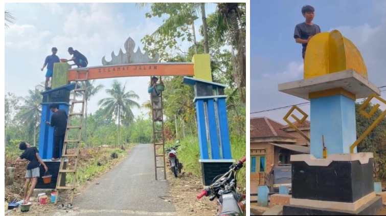
Gambar 2.11 Pengecatan Gapura Dan Tugu

terhindar dari lumut atau tumbuhan lainnya dan memperbaharui warna gapura dan tugu yang sudah pudar dan terkikis oleh usia dan waktu.