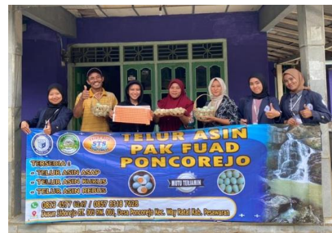
Gambar 2.14 Penyerahan Banner ke UMKM Telur Asin