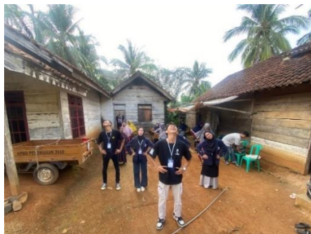
Gambar 2.6 Senam Lansia

Membantu kegiatan Posyandu untuk memudahkan masyarakat dalam memperoleh pelayanan kesehatan lansia dan balita. Tujuan utama Posyandu adalah meningkatkan kualitas hidup para orang tua yang lebih rentan terhadap penyakit, dan untuk balita agar dapat memantau pertumbuhan dan perkembangan balita dan anak.