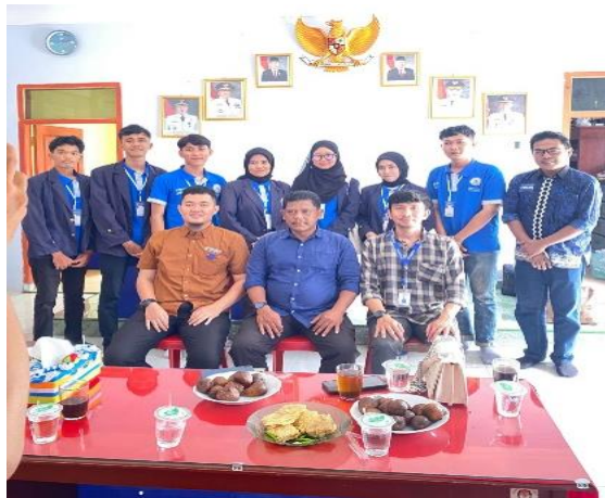
Gambar 2.1 Penyerahan Dari DPL ke Desa Poncorejo