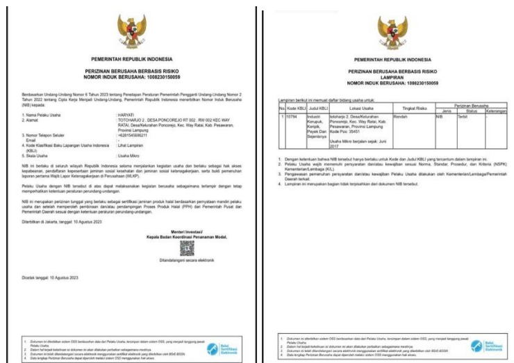
Gambar 2.12 Pembuatan Legalitas Usaha

Pembuatan Legalitas yang dilakukan oleh kami bertujuan untuk mendapat perlindungan hukum, sarana promosi dan pengembangan promosi dan masih banyak lagi. Dilansir dari ukmindonesia.id, legalitas usaha diartikan sebagai pengakuan terhadap sebuah usaha secara hukum. Unit usaha yang memiliki legalitas akan diakui sebagai hukum serta memiliki kewajiban dan hak dalam sebuah negara.