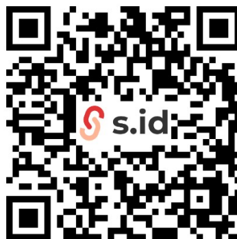
Gambar 2.10 Barcode Yang Diperoleh Dari Home.s.id

Barcode adalah gambar optik yang dapat dibaca mesin yang berisi informasi khusus untuk item yang diberikan label. Barcode yang diperoleh dari Home.s.id dapat digunakan atau di scan untuk melihat data ataupun mengambil data yang sudah diarsipkan di google drive sebelumnya.