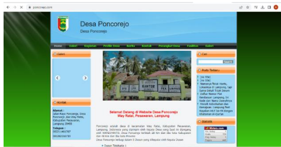
Gambar 2.5 Pembuatan Website Desa