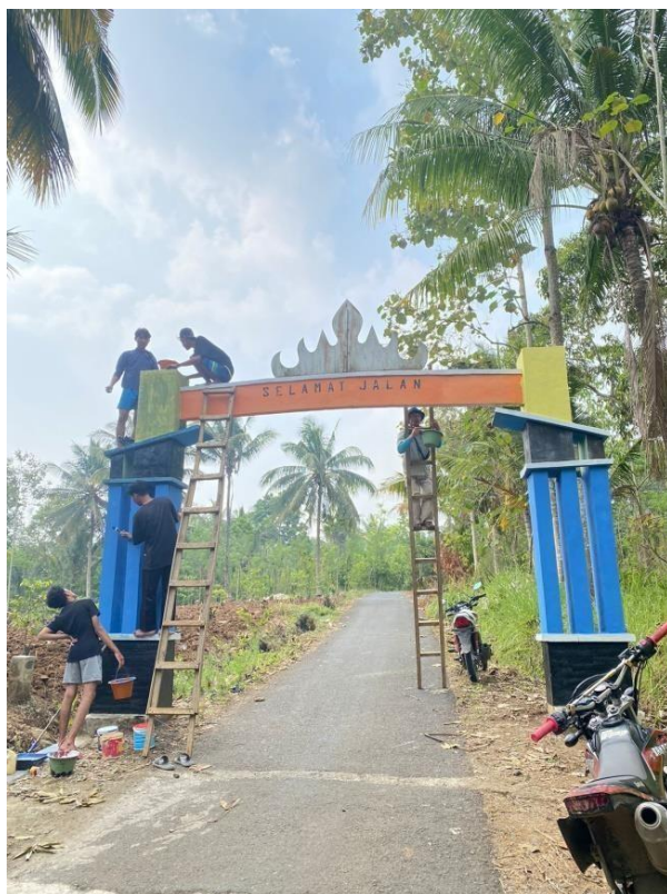
Gambar 2.4 Pembaharuan Warna Cat Gapura

tujuan dari pengecatan pembaharuan ini dilakukan agar memperindah dan juga menjaga ketahanan dari gapura agar terhindar dari lumut dan tidak mudah rusak