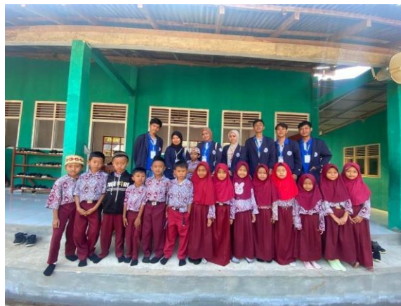
Gambar 2.2 Sosialisasi dan Pendampingan Belajar di MI AN-NIDA

Melakukan sosialisasi dan pendampingan belajar kepada siswa/siswi MI AN-NIDA desa Poncorejo. Dengan tema “STOP BULLYING”, dengan dimaksudkan bahwa seberapa bahaya bullying bagi kesehatan mental seseorang. Tema tersebut diharapkan anak-anak untuk tidak melakukan Bullying di lingkungan sekolah akan berdampak bagi kesehatan fisik dan mental seorang anak yang terkena Bullying sehingga anak tersebut menjadi pendiam, merasa cemas, dan takut.