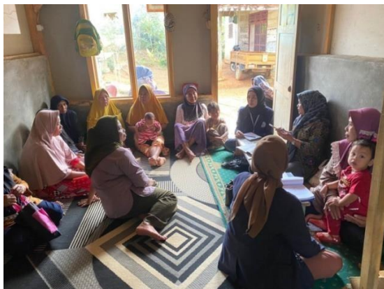
Gambar 2.3 Kegiatan Posyandu Rutin