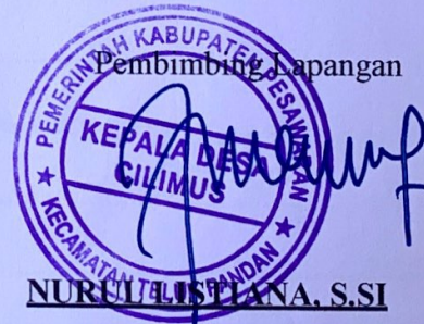
NURUL LISTIYANA, S.SI