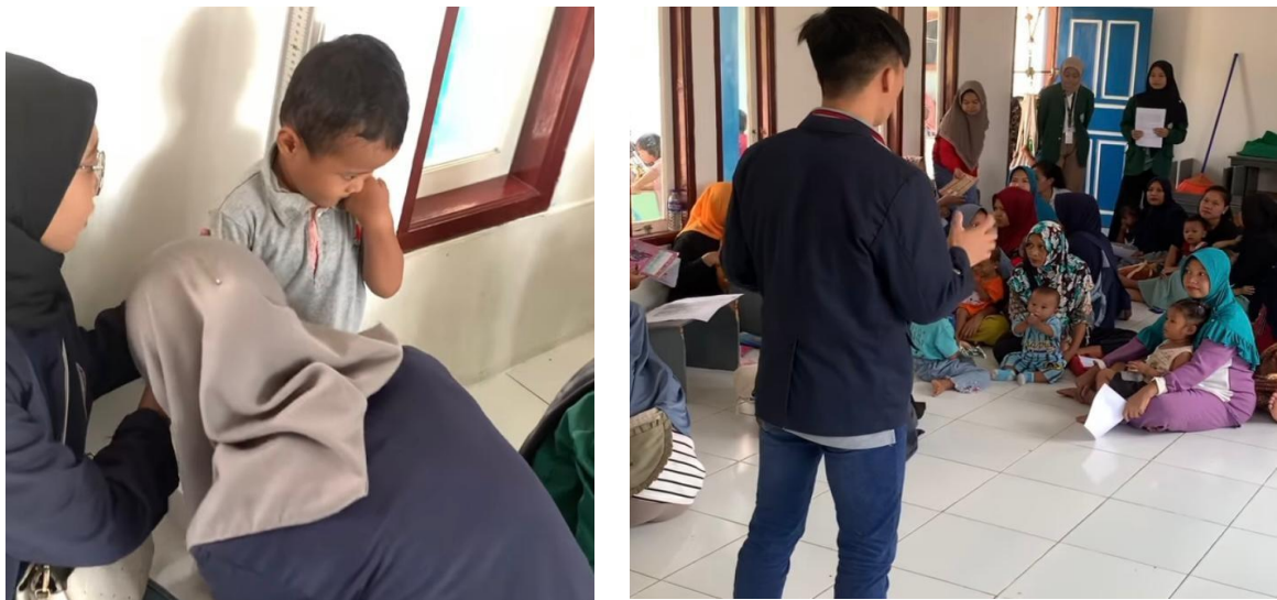
Gambar 2.9 Gerakan Anti Stunting

Salah satu upaya penanggulangan stunting pada balita adalah dengan memberikan edukasi kepada masyarakat dalam rangka peningkatan pengetahuan dan kesadaran akan penanggulangan stunting serta edukasi dalam pemberian makanan tambahan dengan memanfaatkan bahan makanan bersumber daya lokal