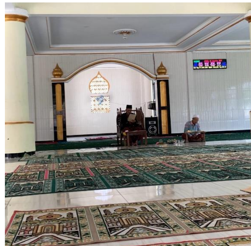
Gambar 2.4 Pengajian Rutin