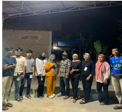
Gambar 2.3 Panitia Perlombaan 17 Agustus