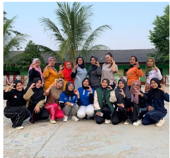
Gambar 2.6 Senam Sore Ibu-Ibu PKK