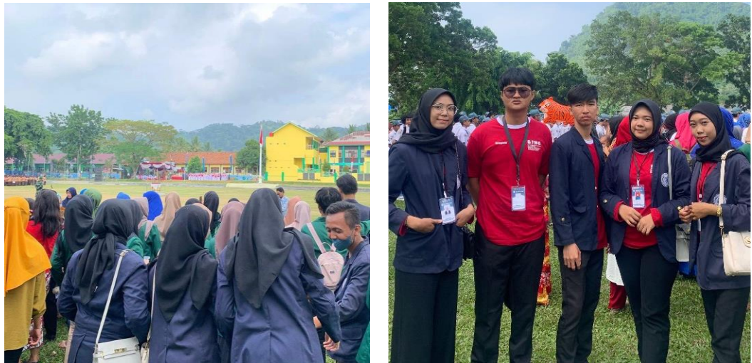
Gambar 2.2 Upacara Kemerdekaan HUT Ke 78

Upacara HUT-RI untuk memperingati hari kemerdekaan Bangsa Indonesia, Upacara Peringatan Detik-Detik Proklamasi Kemerdekaan Bangsa Indonesia dan Pengibaran Sang Merah Putih di tingkat Desa. Upacara bendera dapat meningkatkan sikap kebersamaan dan persatuan di sekolah maupun di Desa, karena dengan adanya Upacara Bendera membuat semua peserta upacara yang akan senantiasa bersama-sama mengikuti aba-aba dan arahan dari pemimpin upacara untuk berpakaian seragam, sehingga menunjukkan sikap kebersamaan. upacara membuat semua peserta upacara mengingat perjuangan para pahlawan yang telah gugur.