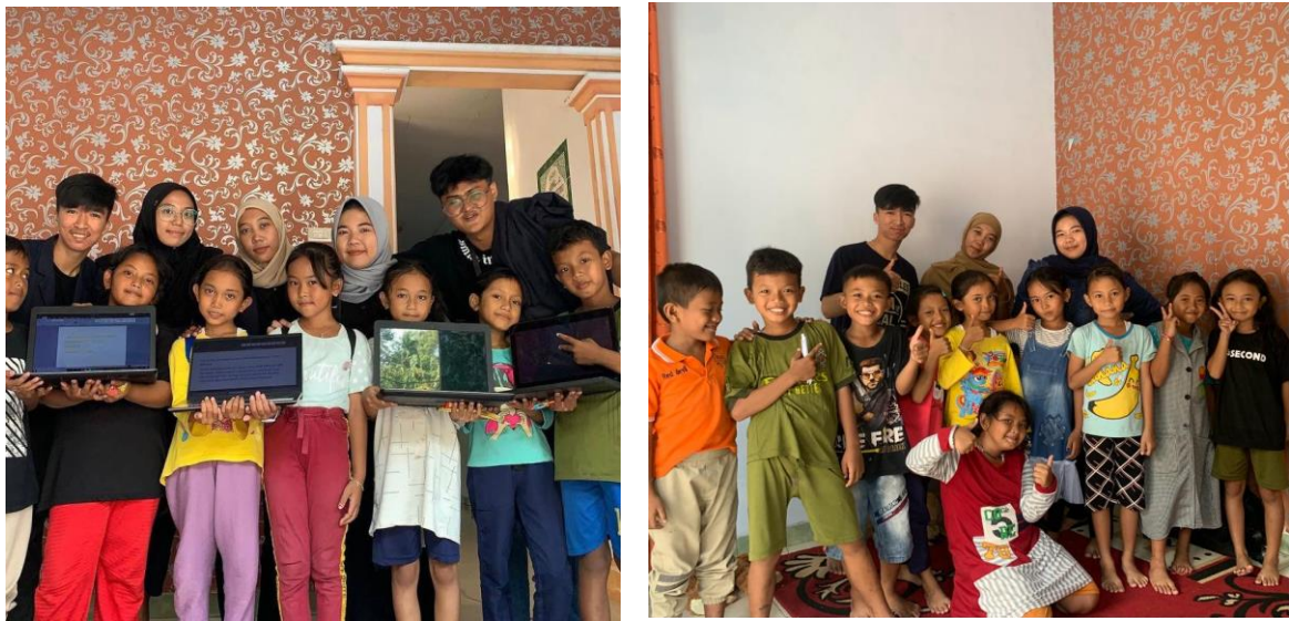
Gambar 2.8 Bimbel Microsoft Word