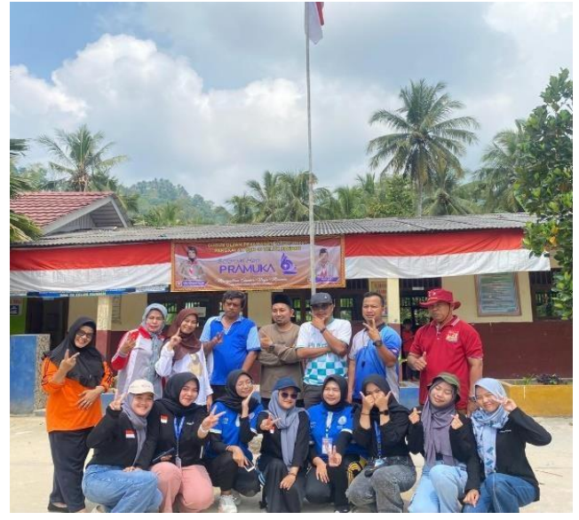
Gambar 2.7 Kegiatan Belajar Mengajar