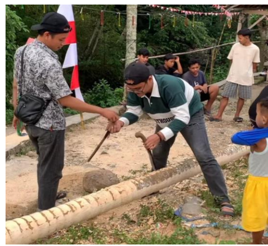
Gambar 2.5 Kerja Bakti