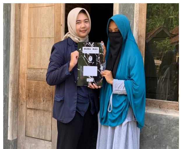
Gambar 2.1 Penyerahan Buku Kas dan Bimbingan Penyusunan