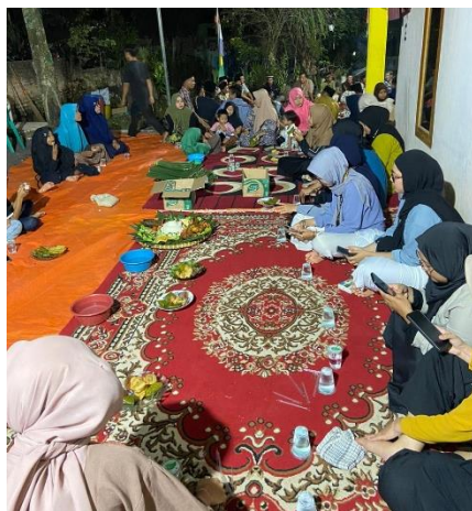
Gambar 2.10 Acara Malam Suroan di Dusun Pendowo