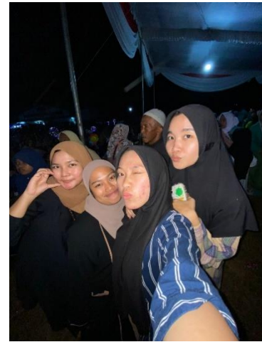
Gambar 2.12 Acara Roworejo bersholawat