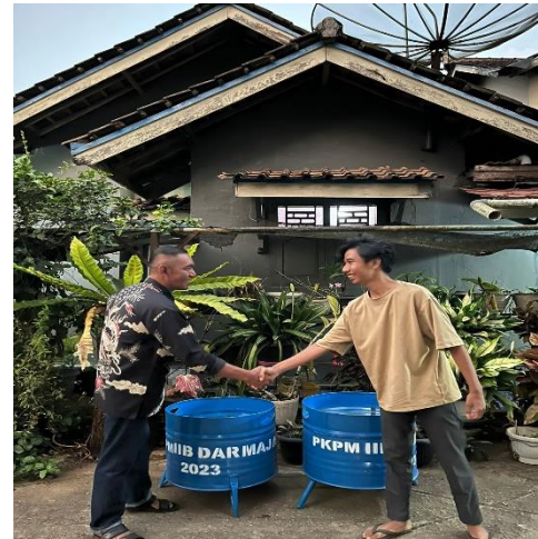
Gambar 2.7 Pembuatan Tong Sampah