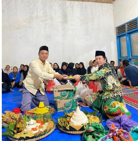
Gambar 2.8 Acara Malam Suroan di Dusun Roworejo Selatan