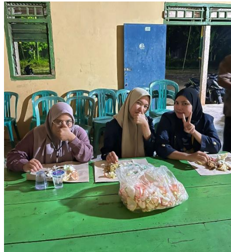
Gambar 2.9 Acara Malam Suroan di Dusun Pendowo