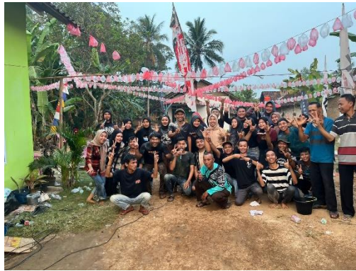
Gambar 2.14 Acara Lomba HUT RI di Dusun Roworejo Selatan