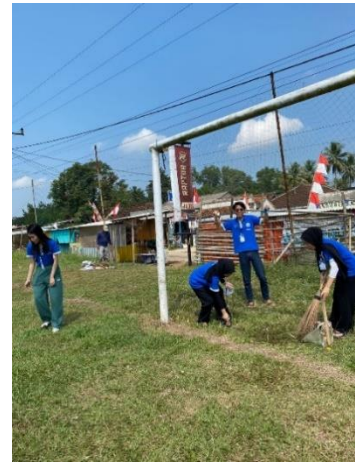
Gambar 2.11 Kegiatan gotong royong membersihkan lapangan