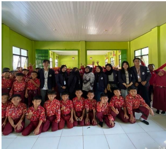
Gambar 2.6 Sosialisasi di SDN 9 Negeri Katon

Moral merupakan pengertian tentang mana hal yang baik dan mana hal yang tidak baik. Sedangkan etika itu sendiri adalah tingkah laku yang dilakukan oleh manusia berdasarkan hal-hal yang sesuai dengan moral tadi. Di zaman sekarang banyak anak-anak yang masih di bawah umur etika dan moral nya kurang baik kepada orang tua. Oleh karena itu kami mengikat tema sosialisasi di SDN 9 Negeri Katon yaitu Etika dan Moral Terhadap Perilaku Anak SD.