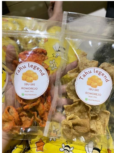
Gambar 2.15 Inovasi kemasan UMKM Tahu

Kemasan yang digunakan oleh produk tahu awalnya hanya menggunakan plastik tahu saja dan tidak terdapat logo produksinya. Kegiatan PKPM ini telah merekomendasikan untuk mengganti kemasannya dengan menggunakan Standing Pouch dan terdapat stiker logo di depan kemasan agar dapat mengikuti tren sekarang, juga untuk dapat menarik hati konsumen. Dengan kemasan yang menarik diharapkan produk UMKM ini dapat bersaing di pasaran.