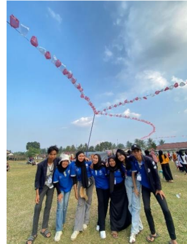
Gambar 2.13 Acara Lomba HUT RI di Desa