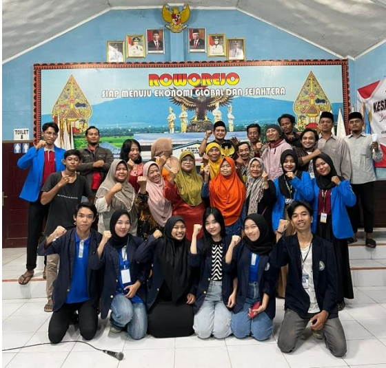
Gambar 2.5 Sosialisasi Pengembangan UMKM Desa