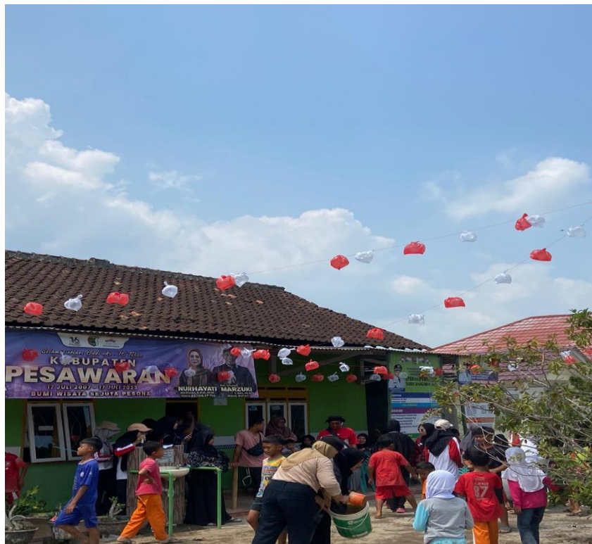
Gambar 2.13 Panitia HUT RI ke-78 Desa Purworejo