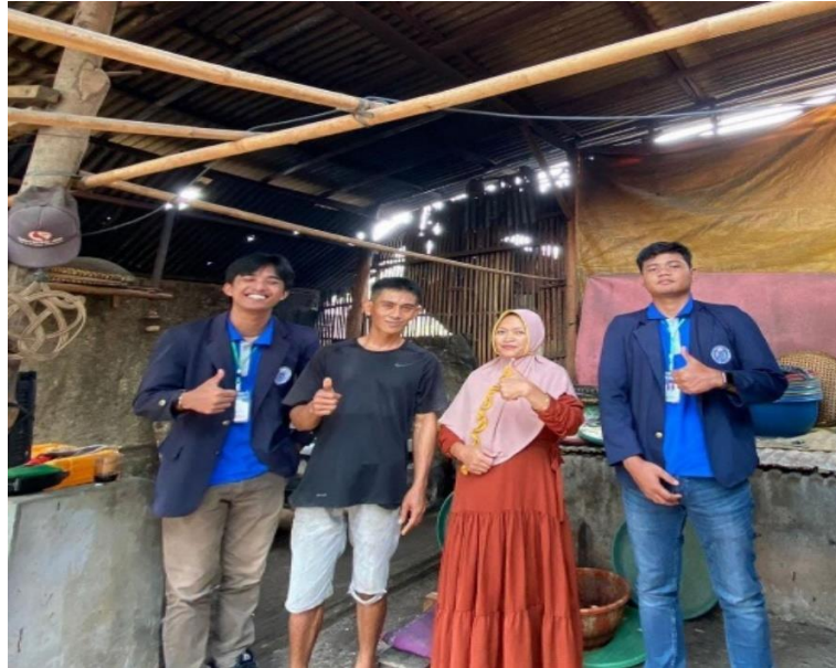
Gambar 2.2 Survei UMKM di Desa Purworejo