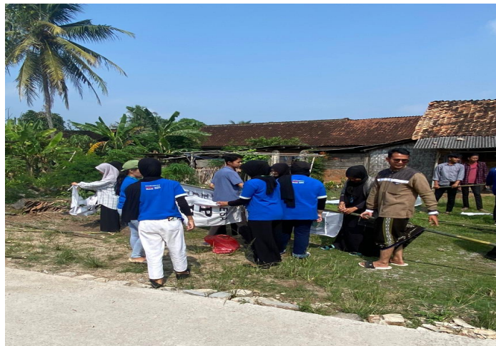
Gambar 2.3 Pemasangan Umbul-umbul di Desa Purworejo