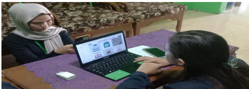
Gambar 2.6 Desain feed Intragram

Membantu mengaktifkan dan desain Sosial Media dan Perpuses Purworejo seperti, Instagram, Facebook dan Tiktok.