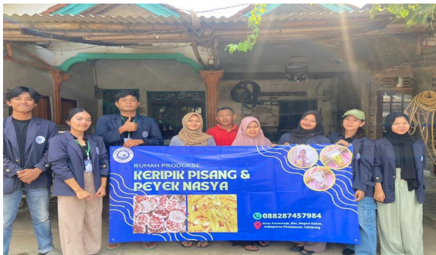
Gambar 2.21 Penyerahan banner

Setelah terlaksananya program kerja mahasiswa PKM memberikan banner kepada UMKM sebagai bentuk ucapan terimakasih kepada pemilik UMKM yang telah membantu dan mendukung mahasiswa melakukan program kerja yang telah terlaksana dengan baik