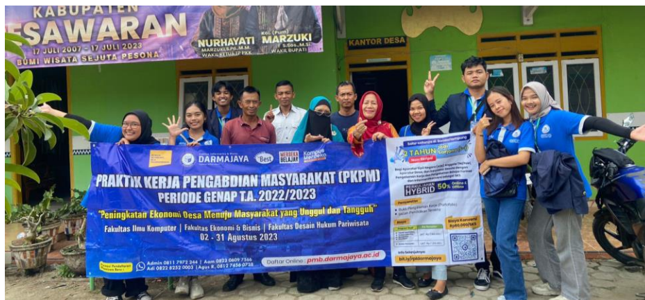
Gambar 2.1 Pelepasan dan penerimaan Mahasiswa PKPM Darmajaya