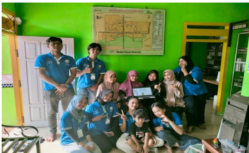
Gambar 2.19 Pelatihan UMKM

2.3.18 Pelatihan kepada pemilik UMKM di desa Purworejo Mahasiswa PKPM melakukan pelatihan yang ditujukan untuk pemilik UMKM di desa Purworejo. Pelatihan mencakup materi tentang Digital Marketing, Akuntansi Keuangan, Desain Grafis, dan Perijinan & Legalitas. Yang bertujuan agar pemilik UMKM menambah wawasan yang lebih mengenai pemasaran produknya, menyusun laporan keuangannya, membuat perizinan legalitas usaha yang mereka dirikan dan memodifikasi kemasan produk.