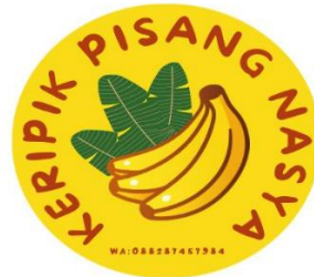
Gambar 2.16 Desain logo UMKM

2.3.16 Setelah survei tempat UMKM, mahasiswa PKPM telah berbincang bincang dengan pemilik UMKM membahas dan mendiskusikan tentang kelemahan kemasan yang digunakan oleh pemilik UMKM. Dengan ini Mahasiswa PKPM melakukan pembuatan desain kemasan yang terbaru untuk memodifikasi kemasan produk yang lama.