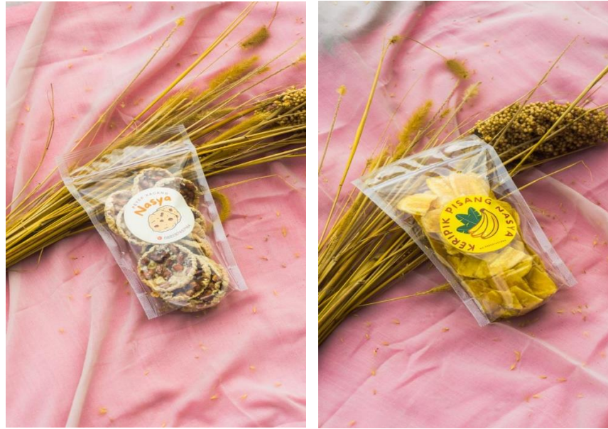
Gambar 2.18 Kemasan Baru

2.3.17 Berikut adalah tampilan produk dengan kemasan yang telah diperbarui atau dimodifikasi oleh mahasiswa PKPM hasil diskusi dengan pemilik UMKM yang akan dipasarkan atau dipromosikan di mini market (SRC).