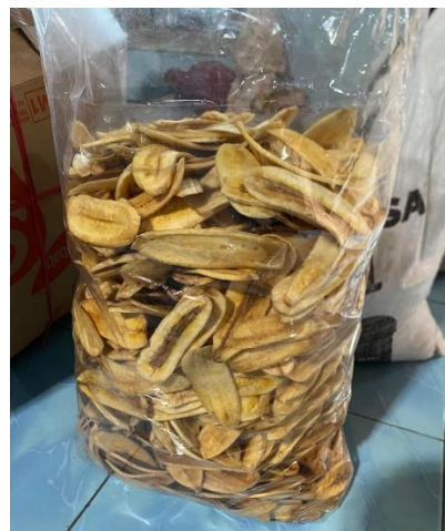
Gambar 2.17 Kemasan lama