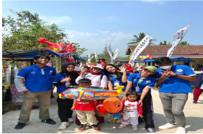
Gambar 2.14 Karnaval Desa Purworejo