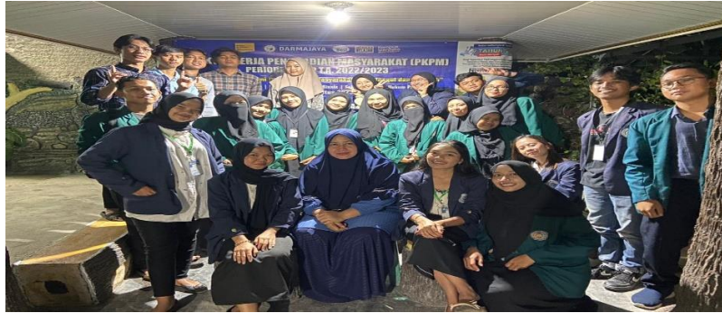
Gambar 2.20 Perpisahan Mahasiswa PKPM Darmajaya dan PKM UM