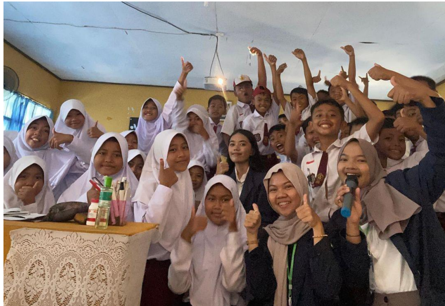
Gambar 2.5 Sosialisasi SDN 1 Negeri Katon

Hari ke 7 pada tanggal, 8 Agustus melakukan kegiatan sosialisasi mengenai Pentingnya menabung