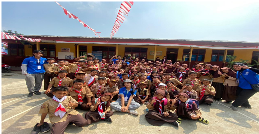
Gambar 2.8 Panitia lomba SDN 1 Negeri Katon