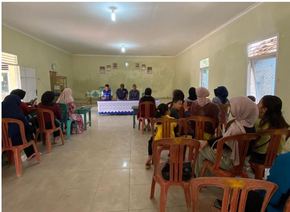
Gambar 2.9 Rapat panitia HUT RI ke-78