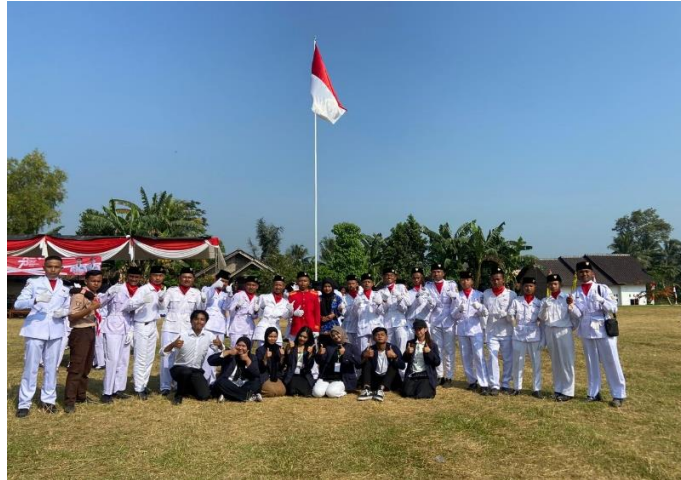
Gambar 2.12 Upacara HUT RI ke-78