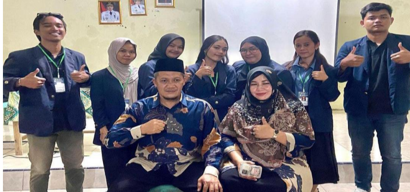
Gambar 2.4 Pelepasan Kepala Desa Lama