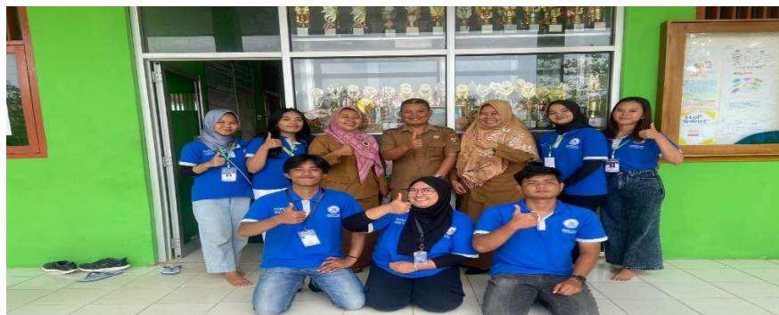
Gambar 2.10 Kunjungan ke SMKN 1 Negeri Katon