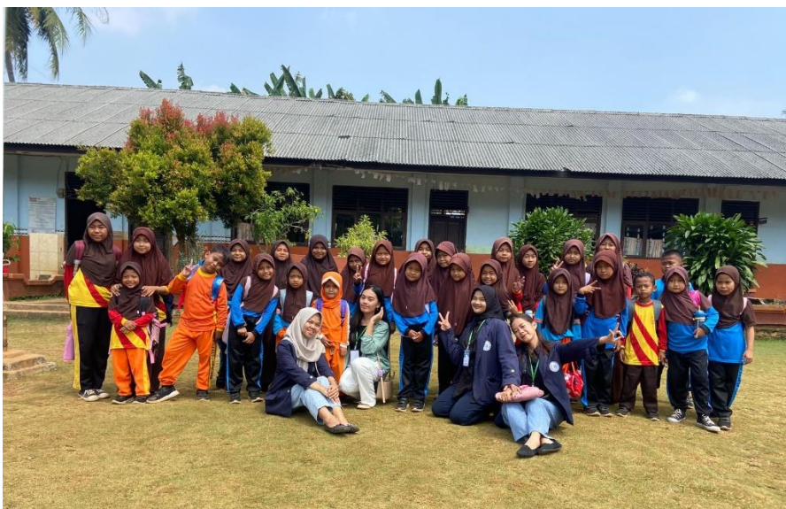
Gambar 2.7 Sosial SDN 11 Negeri Katon

Hari ke 10 pada tanggal, 11 Agustus melakukan kegiatan sosialisasi mengenai Pentingnya menabung