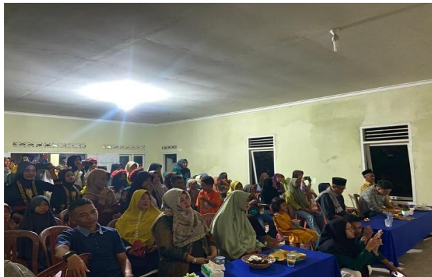
Malam puncak dan Pelepasan KKN UIN RIL