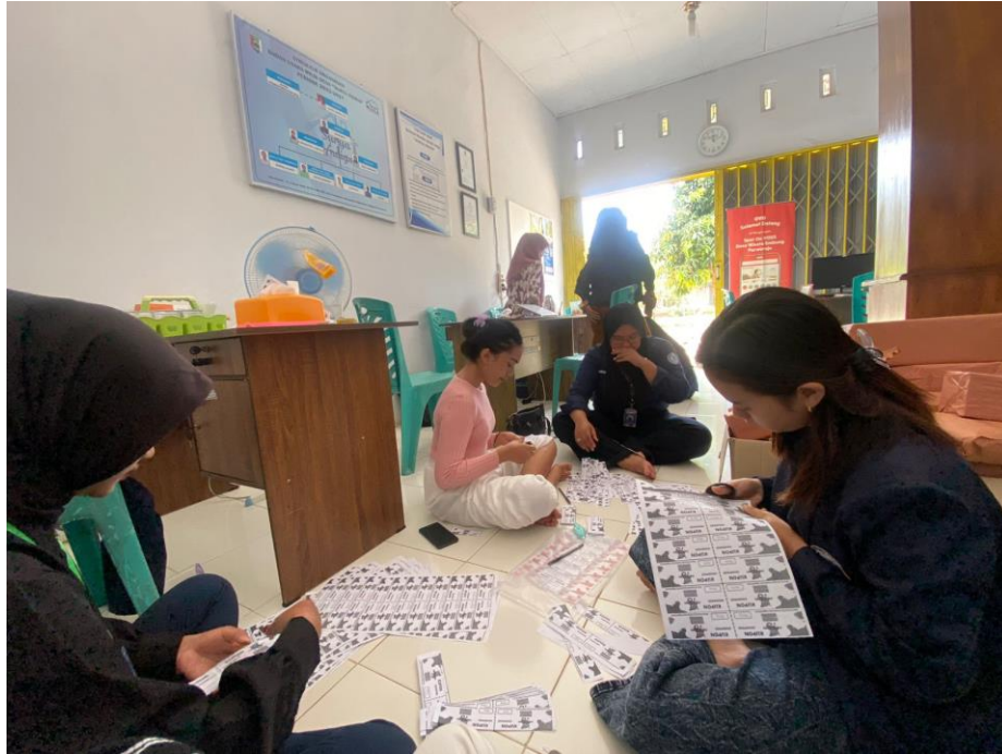
Kupon Persiapan Jalan Sehat dan Karnaval