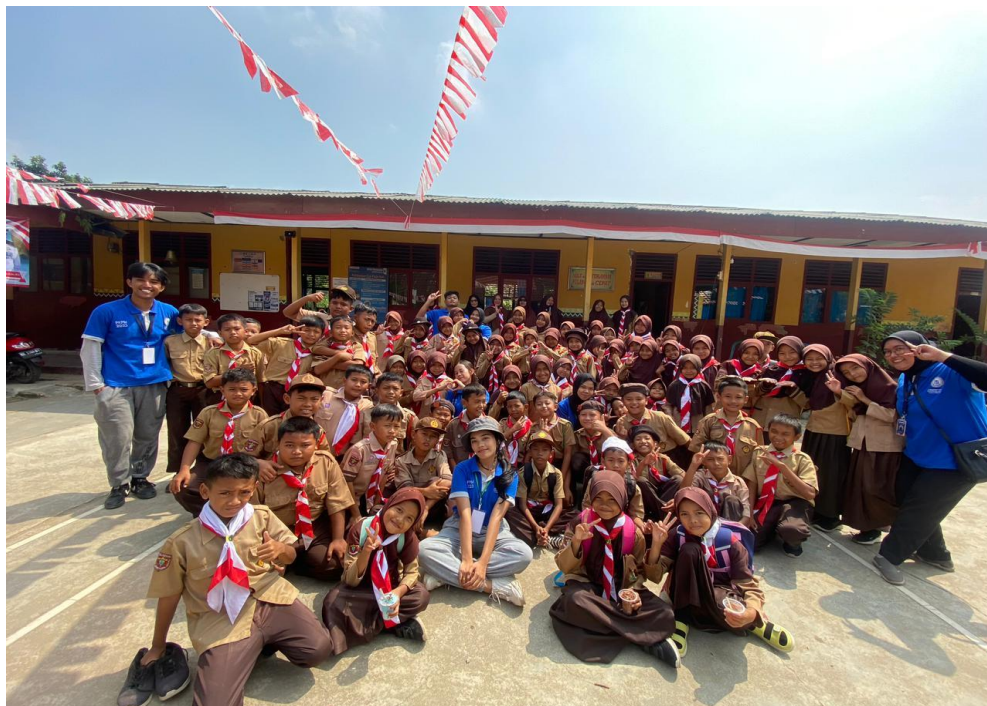
Panitia lomba SDN 1 Negeri Katon