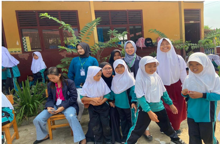
Panitia lomba SDN 1 Negeri Katon