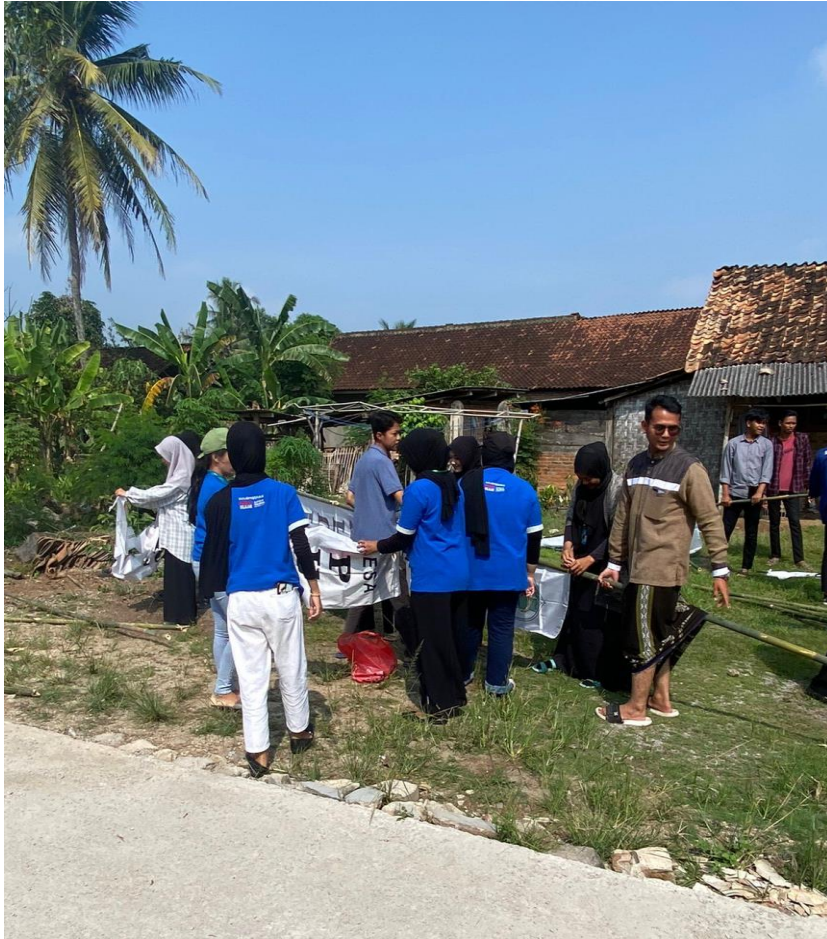
Pemasangan Umbul-umbul di Desa Purworejo