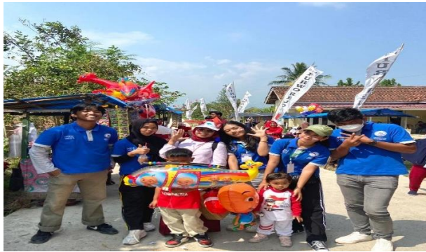
Karnaval Desa Purworejo