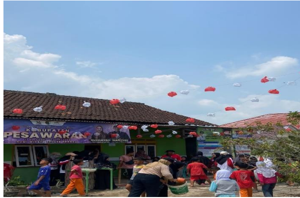
Panitia Lomba HUT RI ke-78 Desa Purworejo