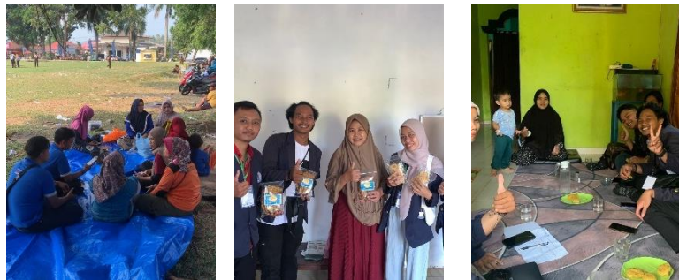
Gambar 2.3 Proses Pembinaan UMKM

Berdasarkan kegiatan yang telah dilaksanakan, dapat menghasilkan sebuah pemanfaatan teknologi Media dan social. dengan adanya Pembinaan UMKM dapat digunakan untuk meningkatkan skill, kreatifitas, dan inovasi mereka dalam pemanfaat Teknologi.