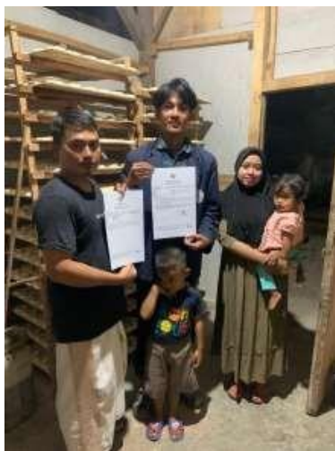
Gambar 6 Penyerahan NIB