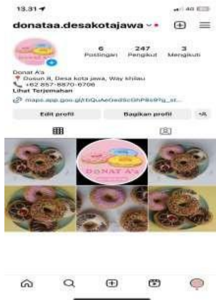
Gambar 2 Tampilan Instagram UMKM