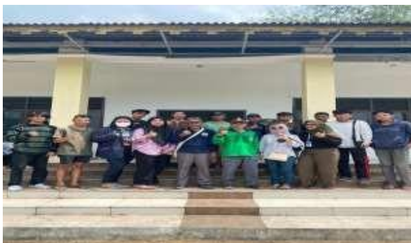
Gambar 1 Kegiatan Gotong Royong