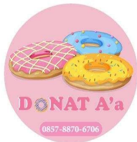
Gambar 7 Logo UMKM