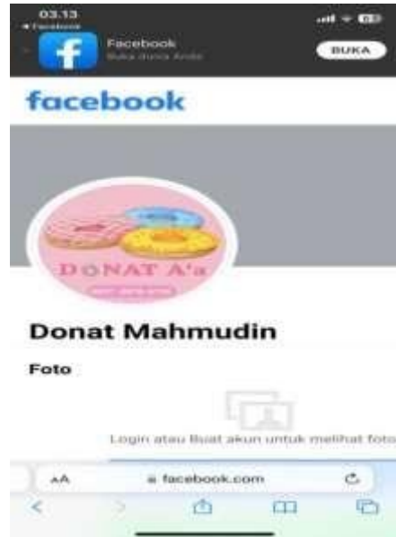
Gambar 3 Facebook UMKM