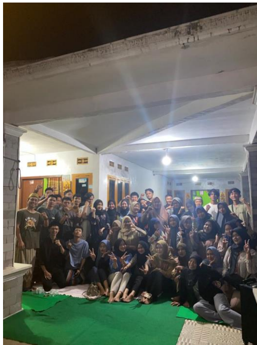
Lampiran 5. Mengikuti acara yasinan bersama KKN UIN RIL di Dusun 3