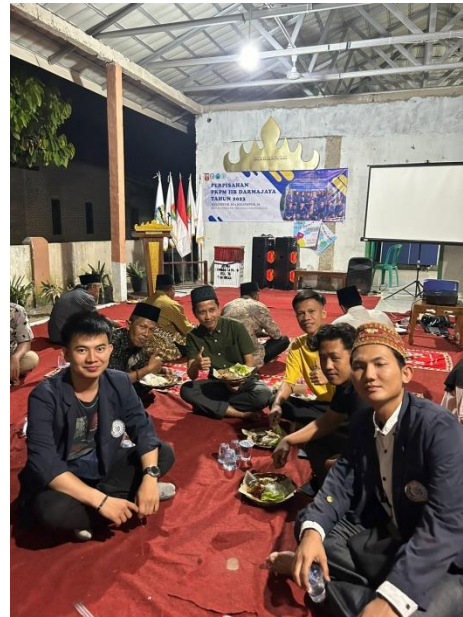
Lampiran 28. Makan-makan bersama aparaturnya desa dan masyarakat Desa Kota Jawa dalam rangka perpisahan PKPM