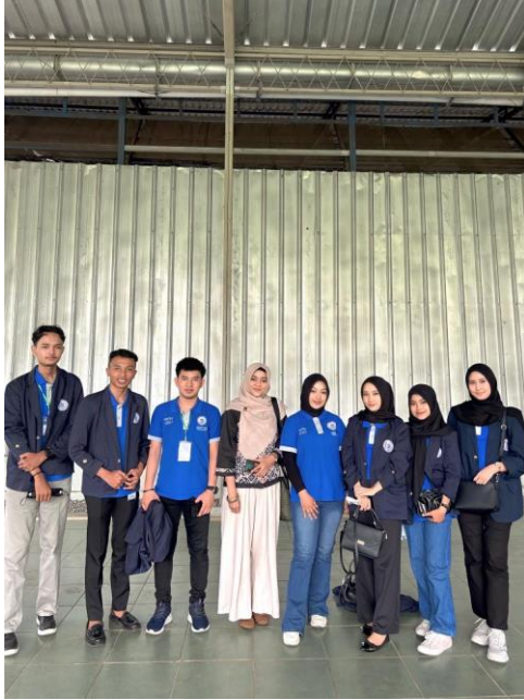
Lampiran 1. Pelepasan Mahasiswa/ I PKPM Desa Kota Jawa, Kec. Way Khilau