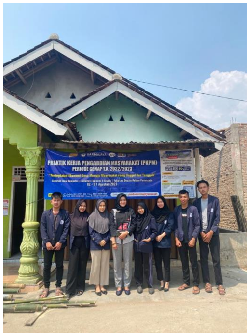
Lampiran 23. Kunjungan DPL ke Posko