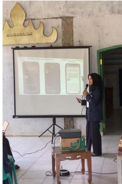
Lampiran 19. Sosialisasi dan Pelatihan Digital Marketing kepada pelaku UMKM Desa Kota Jawa