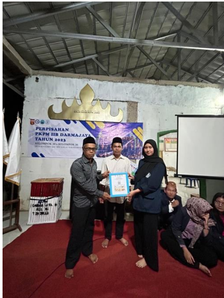
Lampiran 27. Penyerahan E-Katalog kepada perwakilan aparaturnya Desa Kota Jawa.