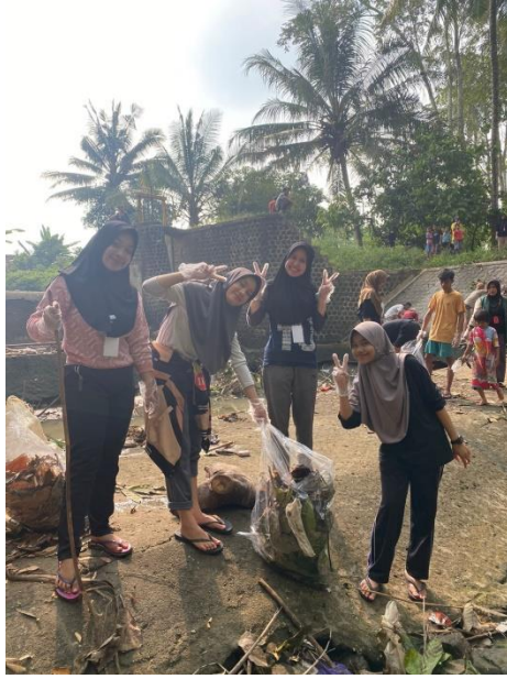
Lampiran 7. Berpartisipasi dalam pembersihan sampah di sungai bersama KKN UIN RIL