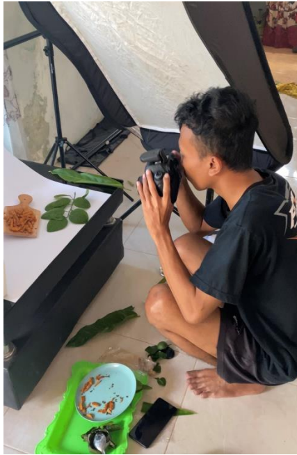
Lampiran 15. Foto Produk UMKM dalam program Pembuatan Akun Sosial Media UMKM