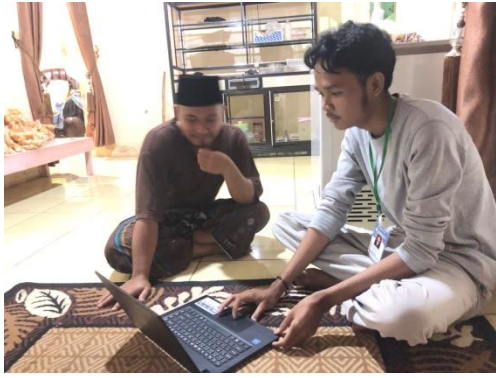
Lampiran 11. Melakukan sosialisasi dan pendampingan platform SIMONIK kepada UMKM Basreng Al-Faqih