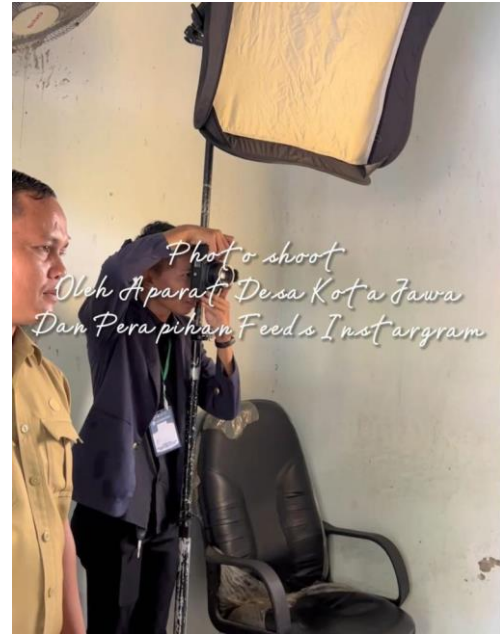
Lampiran 16. Photoshoot para aparat desa dalam program Perapihan Akun Instagram Desa Kota Jawa