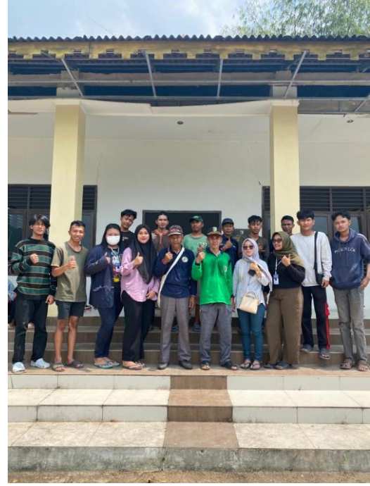
Lampiran 4. Gotong Royong membersihkan Balai Adat Kec. Way Khilau bersama KKN UIN RIL.