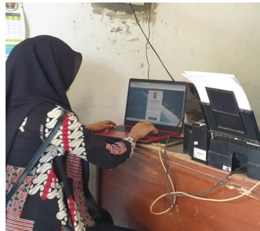
Lampiran 21. Sosialisasi dan Pelatihan Document Digital (Paperless Office) kepada Aparatur Desa Kota Jawa.