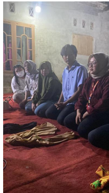
Lampiran 6. Mengikuti kegiatan pengenalan budaya Betabuh dan Lempar Selendang bersama KKN UIN RIL.