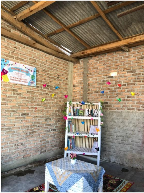
Lampiran 22. Pojok Baca