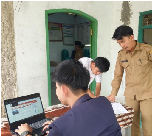
Lampiran 20. Pengoptimalisasian website Desa Kota Jawa bersama Sekretaris Desa Kota Jawa