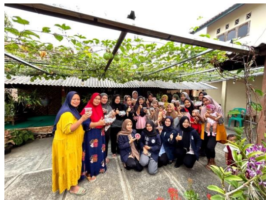
Lampiran 14. Foto bersama Ibu-ibu PKK Desa Kota Jawa dalam Program Menciptakan Ide Bisnis Baru.