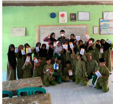
Lampiran 12. Foto bersama Anak MI Dusun 8 dalam program Mengajar Menabung.