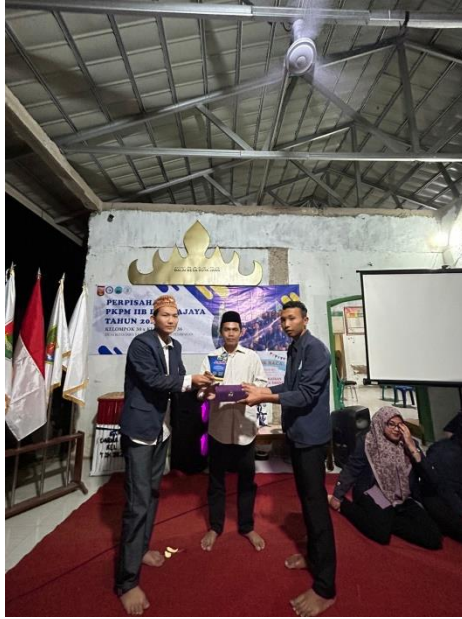
Lampiran 25. Penyerahan kenang-kenangan berupa plakat kepada Kepala Desa Kota Jawa