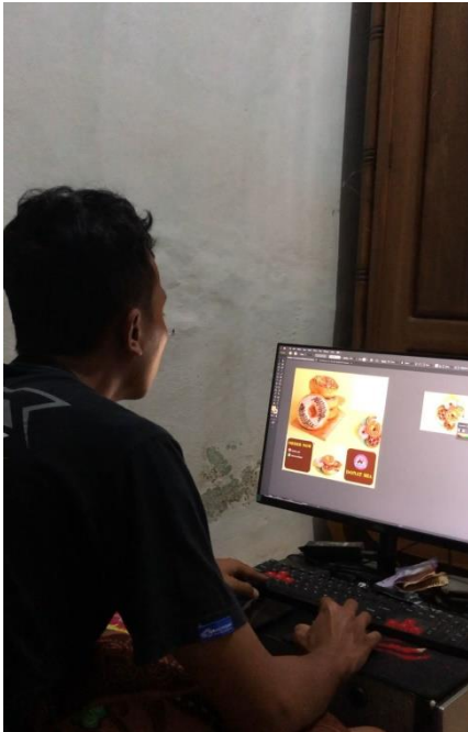
Lampiran 18. Mendesign Akun Sosial Media UMKM