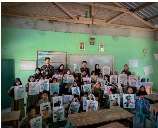
Lampiran 13. Foto bersama Anak MI Dusun 8 dalam program Mengajar Kreativitas.