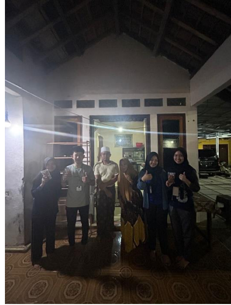
Lampiran 8. Melakukan survey ke UMKM Basreng Al-Faqih