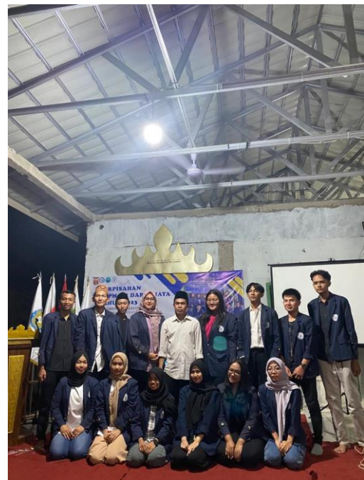
Lampiran 24. Acara perpisahan PKPM IIB Darmajaya bersama aparaturnya desa dan masyarakat