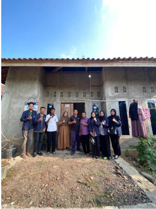
Lampiran 3. Bersilaturahmi dan mengunjungi kediaman Bapak Kadus 4