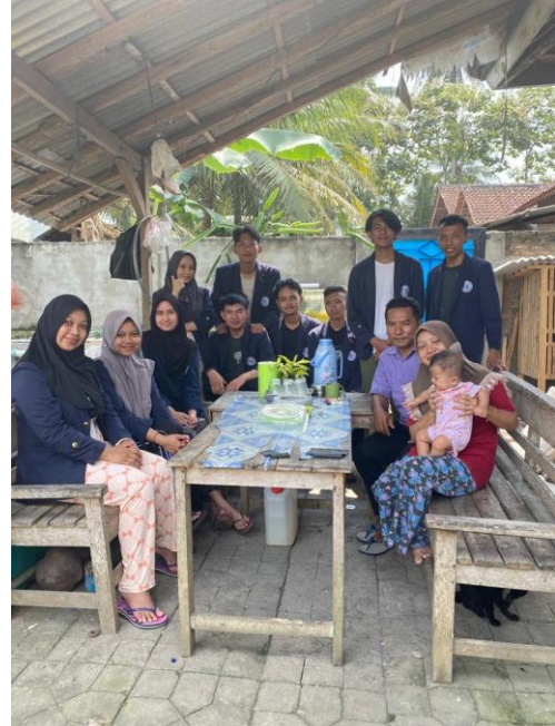
Lampiran 2. Silaturahmi dan mengunjungi Kediaman Bapak Kadus 8