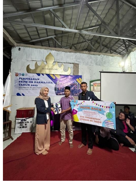
Lampiran 26. Peresmian sekaligus penyerahan Pojok Baca kepada Kepala Dusun 8