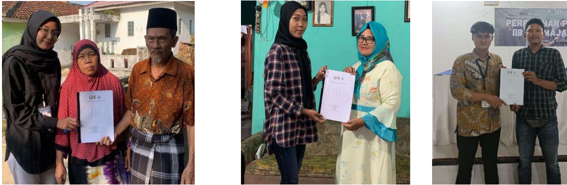
Gambar 2.5 Penyerahan buku layanan mandiri kepada Masyarakat Desa Cilimus