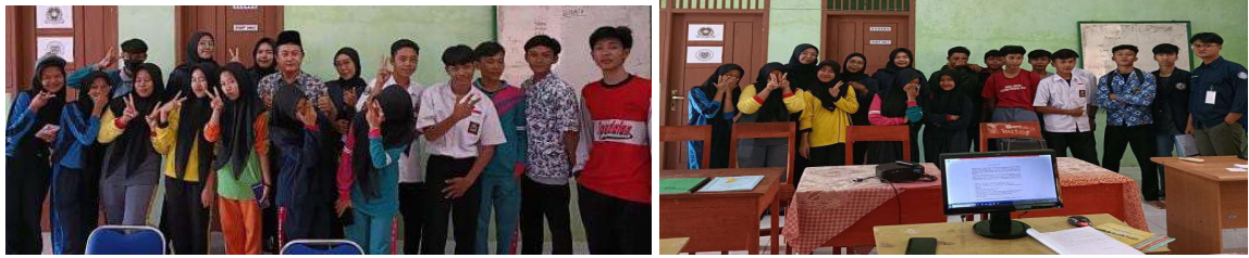
Gambar 2.8 Pendampingan KBM di SDN 10 Teluk Pandan dan SMK I Sunan Muria