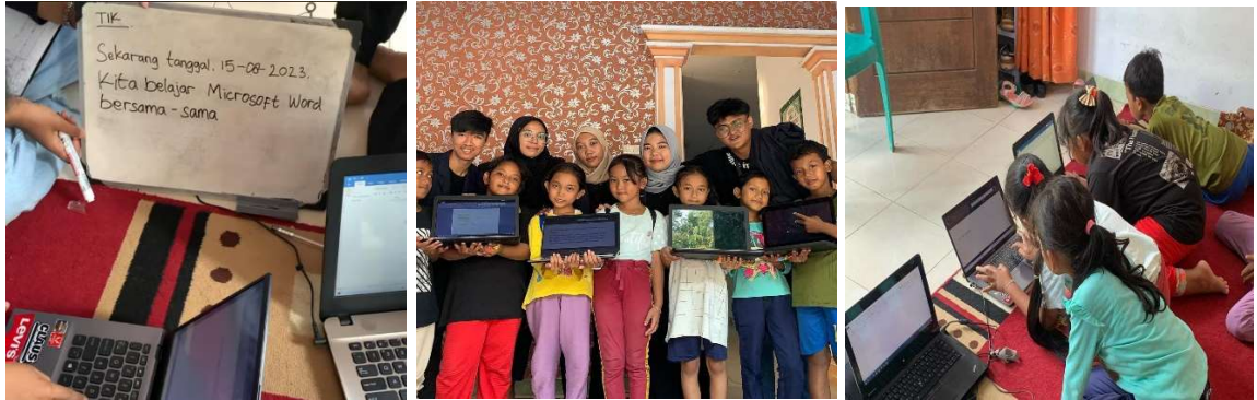
Gambar 2.7 Proses Pelaksanaan Bimbingan Belajar Anak-Anak Warga Desa Cilimus

Kegiatan bimbingan belajar bersama anak-anak warga Desa cilimus diadakan setiap seminggu sekali pada hari Selasa. Anak-anak sangat antusias mengikuti program bimbingan belajar yang kami laksanakan. Belajar bersama ini kami isi dengan materi dasar pengenalan Microsoft Word pada anak-anak. Bimbingan belajar dilakukan di posko kami juga guna mengisi kekosongan waktu kami dan diisi dengan pengalaman baru mengajar serta menambah ilmu pengetahuan baru pula untuk anak-anak warga Desa Cilimus tentang dasar Microsoft Word.