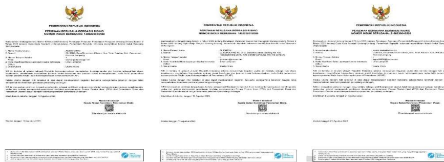
Gambar 2.2 File Dokumen NIB pelaku UMKM Desa Cilimus