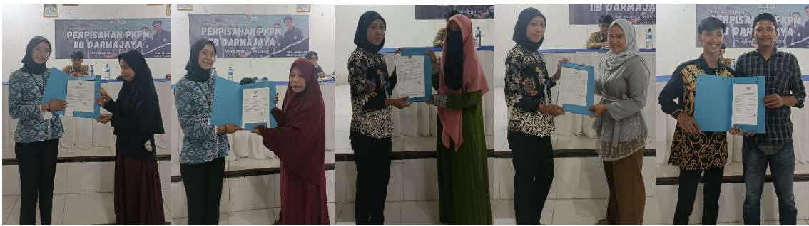
Gambar 2. 1 Penyerahan NIB kepada perwakilan beberapa UMKM di Desa Cilimus

Kegiatan selanjutnya yaitu meminta data berupa KTP kepada pelaku UMKM untuk diserahkan kepada pihak kampus untuk didaftarkan melalui OSS agar UMKM segera mendapatkan Nomor Induk Berusaha. Setelah data UMKM diberikan kepada pihak kampus, kemudian pihak kampus melakukan submit data usaha dengan menunggu proses verifikasi data dan menunggu terbitnya sertifikat NIB lalu diserahkan pada pelaku UMKM. Menurut Mudiparwanto & Gunawan (2021) yakni terdapat beberapa dokumen yang perlu dipersiapkan untuk membuat perizinan usaha yakni NIK yang sesuai dengan data pada E-KTP, NPWP, dan E-mail pemilik usaha yang masih aktif, serta nomor telfon yang masih aktif.