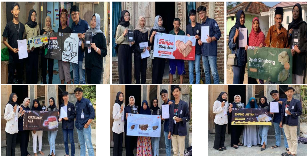
Gambar 2.6 Penyerahan Sticker dan Banner kepada pelaku UMKM Desa Cilimus

Melalui label, produsen dapat memberi informasi, menarwarkan, mempromosikan produknya sedemikian rupa agar memiliki daya tarik bagi konsumen. Sementara bagi konsumen, penting untuk memperhatikan, membaca, memahami informasi pada label yang tercantum pada kemasan agar produk yang kita beli sesuai dengan keinginan kita. Pada pelaksanaan PKPM ini kelompok saya membuat logo, sticker dan banner kepada pelaku UMKM yang ada di Desa Cilimus yang bertujuan untuk mempercantik kemasan agar lebih mudah dikenal oleh masyarakat luas. Tujuan pembuatan banner adalah sebagai tanda bahwa lokasi tersebut merupakan rumah produksi UMKM. Dan juga memudahkan konsumen yang ingin mencari atau mendatangi lokasi UMKM tersebut.