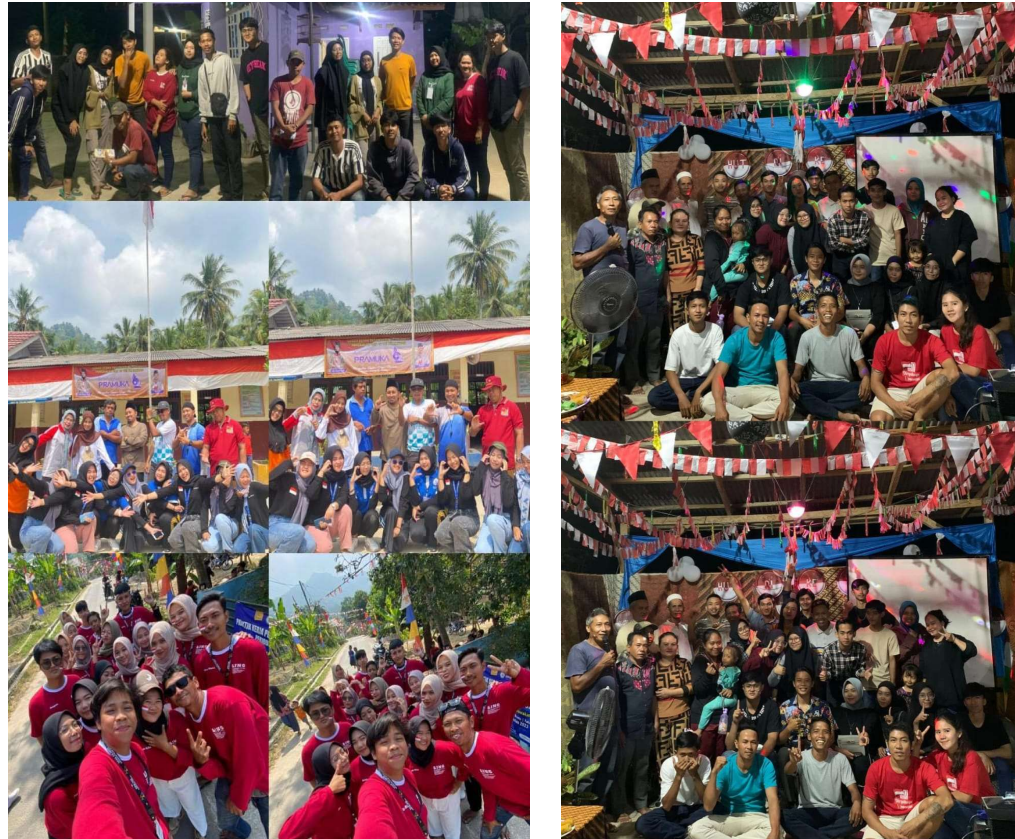
Gambar 2.9 Berpartisipasi Memeriahkan HUT RI di Desa Cilimus