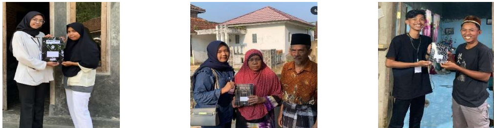
Gambar 2.4 Penyerahan buku kas pada pelaku UMKM Desa Cilimus

Sosisialisasi keuangan ini dilakukan karena ditemukan pengelolaan keuangan masih belum tersusun rapih antara uang usaha dan uang pribadi sehingga dibutuhkan pendampingan dan sosialiasi menggunakan buku kas yang mudah untuk diterapkan. Kami memberikan Buku Kas pada pelaku UMKM Desa Cilimus yang dapat mendukung pencatatan keuangan UMKM di Desa Cilimus. Pencatatan keuangan usaha yang dikelola secara tepat dan sistematis akan mempermudah pemilik usaha untuk mengkaji posisi keuangan usaha, hasil usaha dan informasi-informasi lain yang dibutuhkan oleh pihak eksternal untuk menilai kondisi dan potensi usaha (Kesuma et al., 2020). Hal tersebut sesuai dengan pendapat (Januariyansah et al., 2021) bahwa kemampuan pengelolaan pembukuan usaha perlu dimiliki kelompok usaha tertentu.