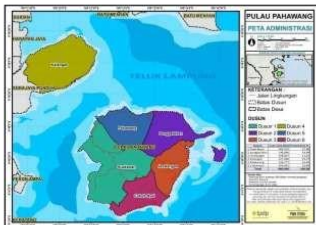
Gambar 1 PETA DESA PULAU PAHAWANG

Desa Pulau Pahawang merupakan salah satu desa dan pulau yang berada di Kecamatan Marga Punduh Kabupaten Pesawaran, Desa Pulau Pahawang berada 10 meter diatas permukaan laut, kondisi permukaan tanahnya landau dan berbukit memiliki luas hampir 1000 Ha, dan berpenduduk lebih dari 1500 jiwa. Desa Pulau Pahawang memiliki 6 dusun yakni sebagai berikut :