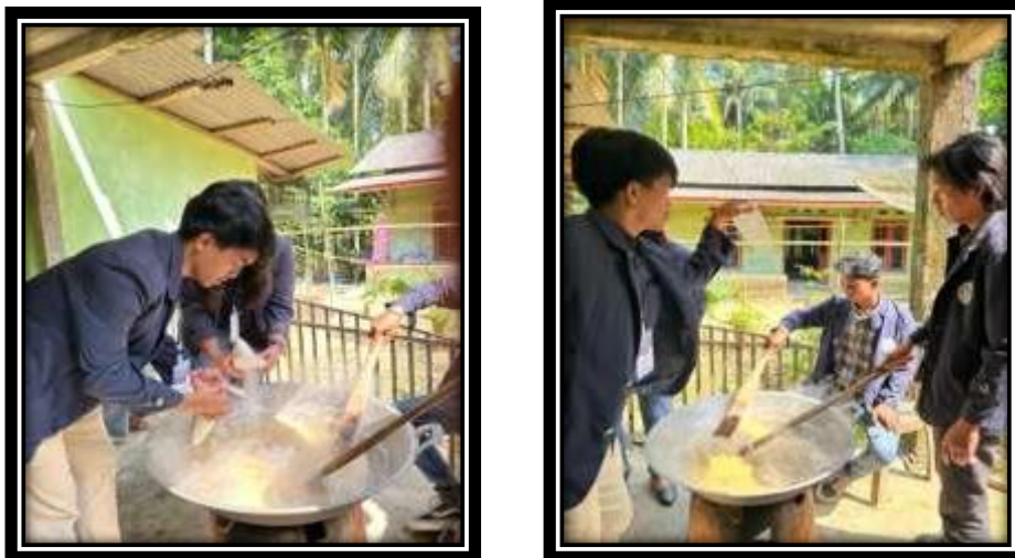
Gambar 3. 2 Mengikuti proses pembuatan dodol mangrove

Pada gambar diatas kelompok kami melakukan survei pertama di balai Desa Pulau Pahawang dan menanyakan terkait masalah yang terjadi di Desa tersebut.