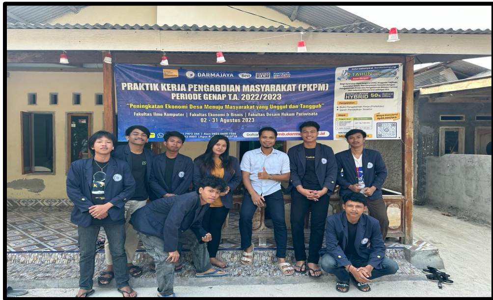
Gambar 3.5 Kunjungan Dosen DPL

Kunjungan DPL ke posko Mahasiswa di Pulau Pahawang dusun Jelarangan