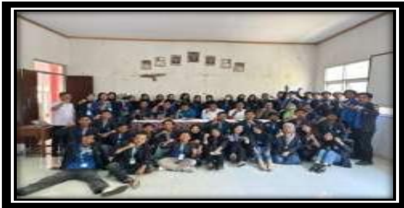
Gambar 3. 8 Penarikan dan Presentasi hasil kerja

Penarikan sekaligus presentasi hasil kerja yang dilakukan selama PKPM di kantor Kecamatan Marga Punduh.