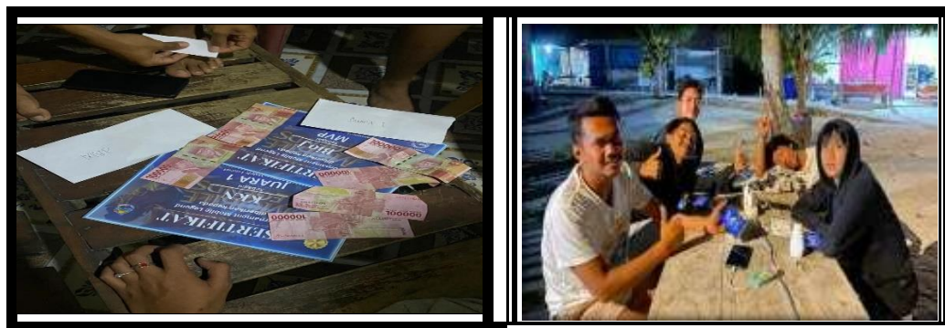
Gambar 3. 4 Berpartisipasi dalam perlombaan di Desa Pulau Pahawang

Promosi melalui instastory Instagram agen travel trip pahawang dan konten video youtube dan shorts