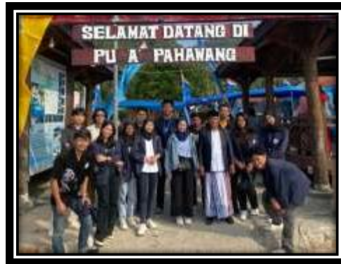
Gambar 3. 1 Mengunjungi Kepala Desa Terkait Survei Lokasi

Pada gambar diatas kelompok kami melakukan survei pertama di balai Desa Pulau Pahawang dan menanyakan terkait masalah yang terjadi di Desa tersebut.