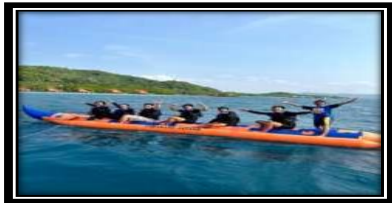
Gambar 3.6 Perpisahan bersama pemuda/i Dusun Jelarangan

Perpisahan bersama pemuda/i Jelarangan bersama aparatur Desa sebelum meninggalkan Desa Pulau Pahawang.