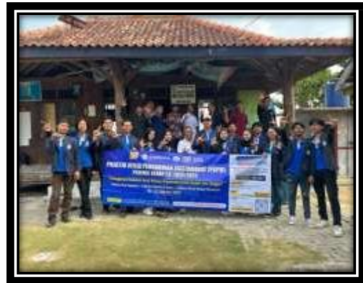
Gambar 3. 7 Perpisahan bersama ibu pemilik rumah dan Aparatur Desa

Perpisahan bersama aparatur Desa dan pemilik rumah sekaligus Ibu RT memintamaap, ucapan terima kasih dan izin pamit meninggalkan Desa Pulau Pahawang.