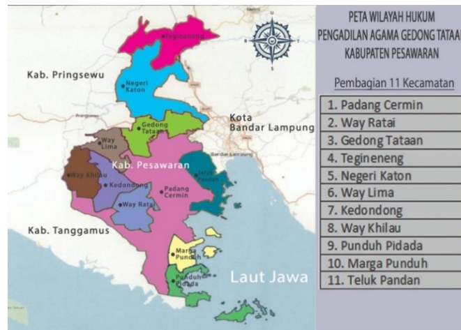
Gambar 1. 1 Peta Pesawaran