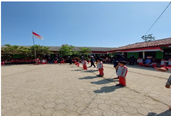
Panitia 17 Agustus di SDN 9 Way Khilau Desa Mada Jaya