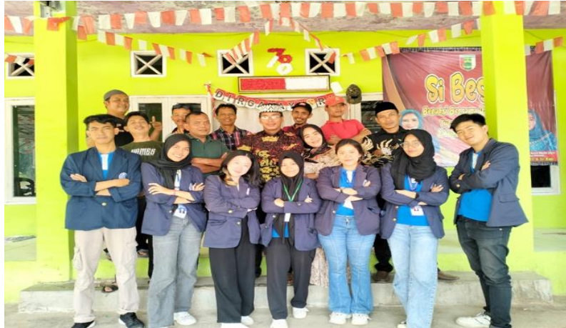
Perpisahan bersama Aparat Desa Mada Jaya