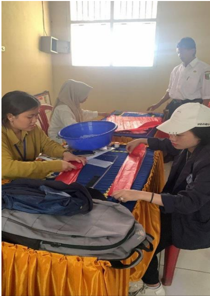
Membantu persiapan HUT RI