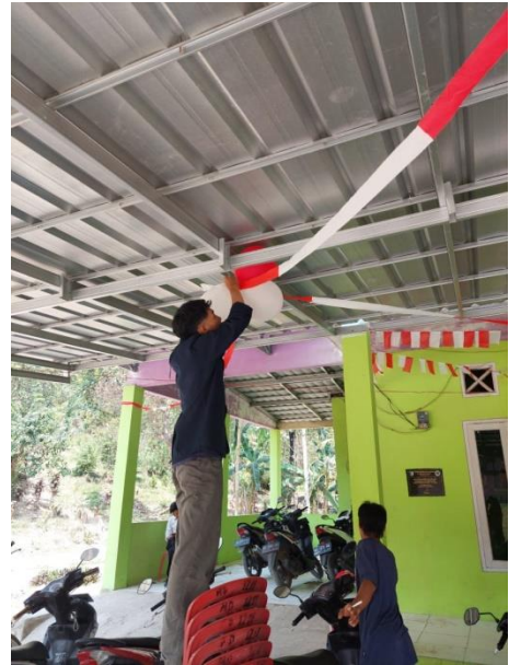
Membantu persiapan HUT RI