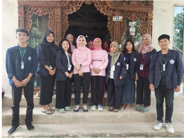
Penyambutan Istri bupati pesawaran di Desa Mada Jaya