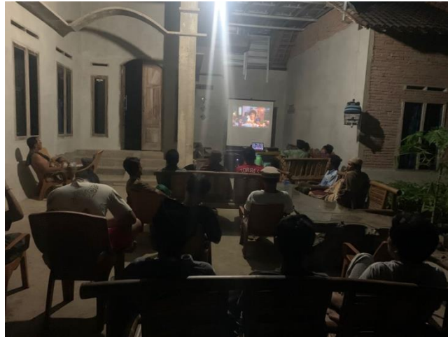
Mengadakan Nonton Bola Bersama Masyarakat Desa Mada Jaya dan para Aparat Desa Mada Jaya