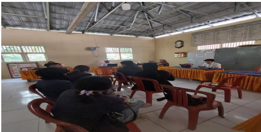
Survei Tempat PKPM di Desa Mada Jaya