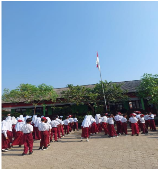
Mengikuti Upacara di SDN 9 way khilau Desa Mada Jaya