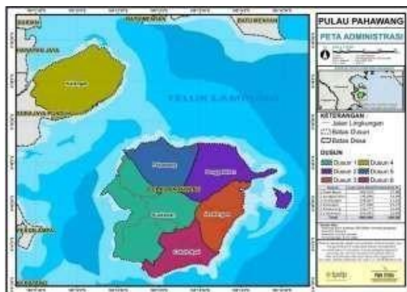
Gambar 1 Peta Desa

Desa Pulau Pahawang merupakan salah satu desa dan pulau yang berada di Kecamatan Marga Punduh Kabupaten Pesawaran, Desa Pulau Pahawang berada 10 meter diatas permukaan laut, kondisi permukaan tanahnya landau dan berbukit memiliki luas hampir 1000Ha, dan berpenduduk lebih dari 1600 jiwa. Desa Pulau Pahawang memiliki 6 dusun yakni sebagai berikut: