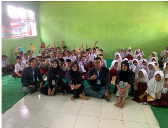
Gambar 2.3 foto bersama anak sekolah dasar setelah kegiatan sosialisasi bullying