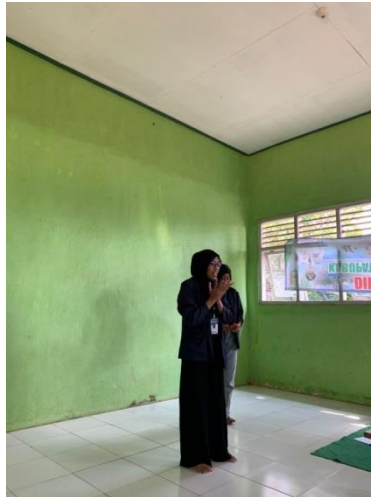
Gambar 2.2 kegiatan sosialisasi tentang bullying