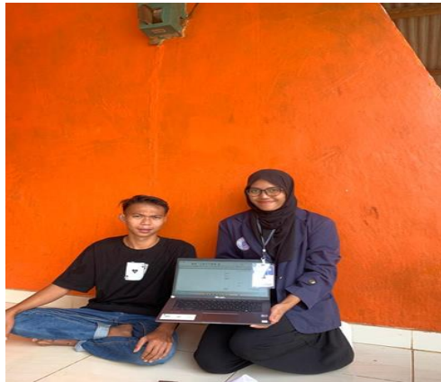
Gambar 2.1 kegiatan pelatihan penyusunan harga pokok produksi kepada pemilik UMKM Agoy Kopra