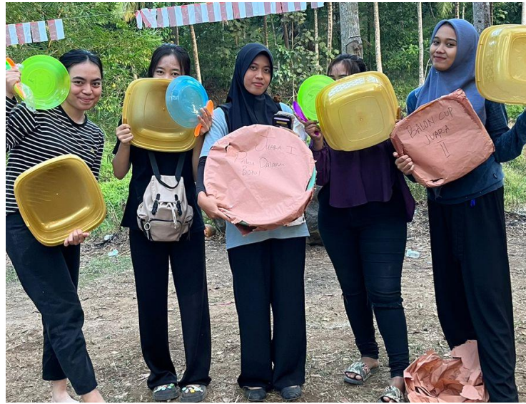
Acara Perpisahan PKPM Darmajaya kepada Desa Ceringin Asri