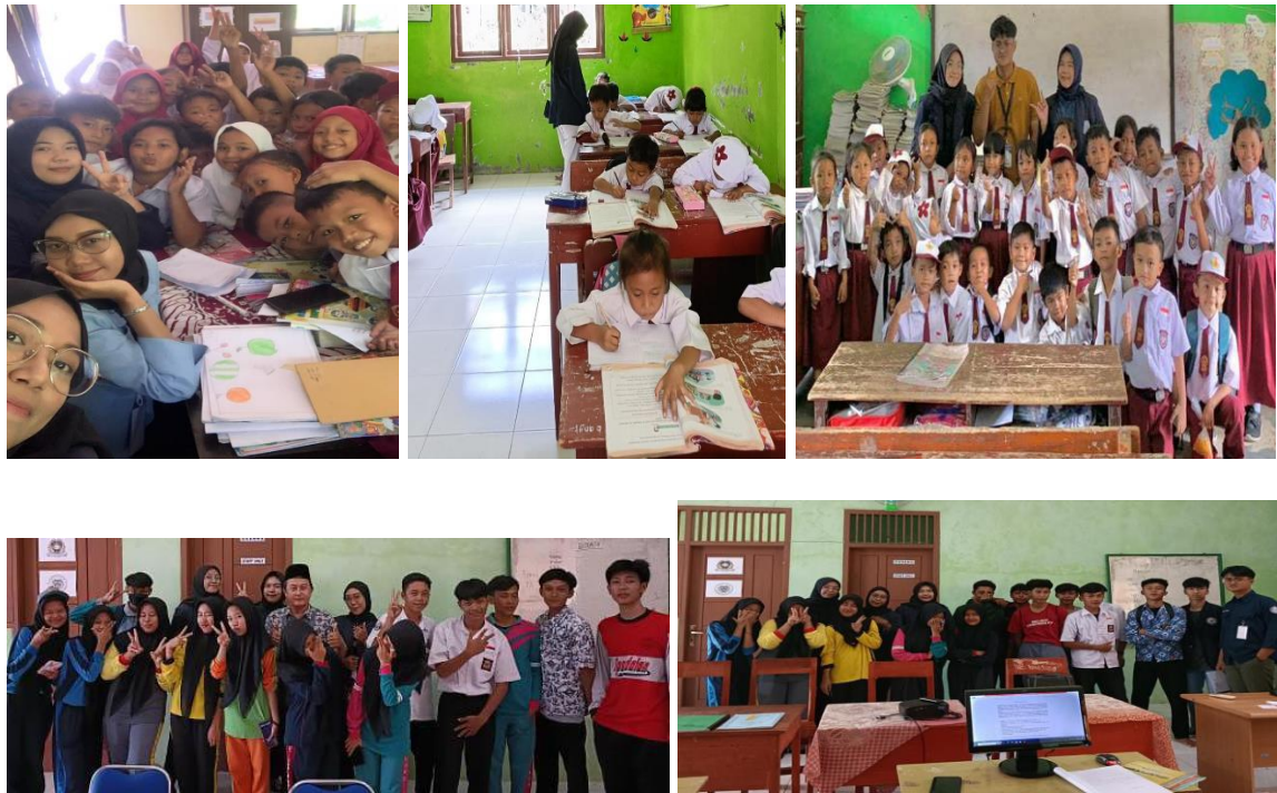
Gambar 2.7 Pendampingan KBM di SDN 10 Teluk Pandan dan SMK I Sunan Muria

Pendampingan KBM yang dilakukan oleh kami membuat para siswa/i lebih bersemangat dalam belajar. Kegiatan pembelajaran dilakukan secara lebih luwes dan terbuka, sehingga para siswa/i dapat bercerita dan bertanya mengenai apapun dengan kami tanpa adanya hambatan. Pendampingan proses kegiatan belajar mengajar di SDN 10 Teluk Pandan dilakukan setiap minggu 2 kali pada pukul 09.30-13.00 WIB. Selain itu, kami juga memberi materi dasar-dasar komputer di SMK I Sunan Muria yang disambut dan diikuti dengan sangat antusias oleh para siswa/i. Pengajaran dan pengenalan dasar-dasar komputer ini kami lakukan saat jam pelajaran, yakni setiap hari Kamis pukul 13.00-14.00 WIB.