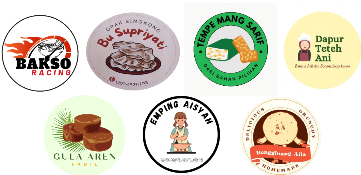
Gambar 2.2 Logo UMKM Desa Cilimus