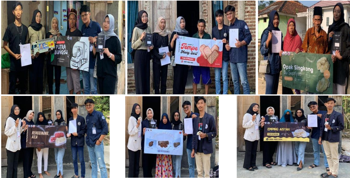
Gambar 2.5 Penyerahan Sticker dan Banner kepada pelaku UMKM Desa Cilimus