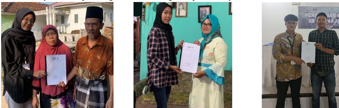
Gambar 2.4 Penyerahan buku layanan mandiri kepada masyarakat Desa Cilimus

Manfaat Buku Layanan Mandiri yang ditujukan untuk masyarakat Desa Cilimus ini adalah agar masyarakat di Desa Cilimus dapat menggunakan website Desa Cilimus tersebut sesuai dengan kebutuhannya. Salah satu kegunaan website Desa Cilimus ini adalah masyarakat Desa Cilimus dapat mengirim pesan langsung yang akan dilihat oleh Aparatur Desa dan akan mendapatkan balasan langsung pula oleh Aparatur Desa. Didalam buku layanan mandiri terdapat pengertian website, tujuan website dan manfaat website. Pada buku ini terdapat petunjuk bagaimana cara penggunaan website, mulai dari cara masuk sampai dengan cara mengirim pesan. Petunjuk dalam buku ini dibuat berupa gambar beserta keterangannya sehingga masyarakat dapat dengan mudah mengikuti panduannya.