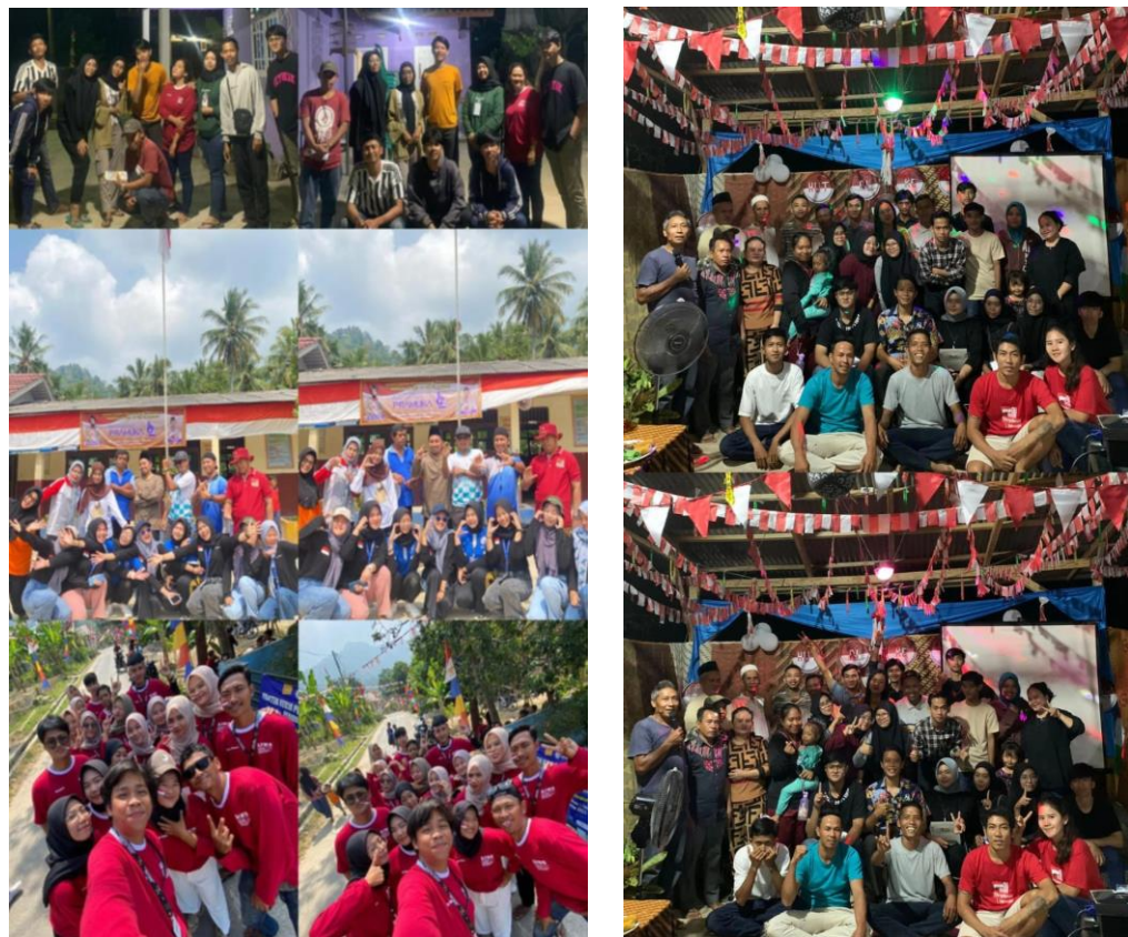
Gambar 2.8 Berpartisipasi Memeriahkan HUT RI di Desa Cilimus

Kegiatan PKPM yang dilaksanakan pada periode 2 ini dilaksanakan pada tanggal 02 Agustus 2023 - 31 Agustus 2023. Sehingga kami dapat berpartisipasi dalam memeriahkan acara perlombaan 17 Agustus di Desa Cilimus. Warga Desa Cilimus sangat antusias dalam memeriahkan HUT RI. Perlombaan dalam rangka memeriahkan HUT RI di Desa Cilimus diadakan di setiap dusun yang ada di Desa Cilimus serta disekolah yang ada di Desa Cilimus. Salah satunya yaitu SDN 10 Teluk Pandan. Kelompok saya ikut membantu memeriahkan perlombaan di SDN 10 Teluk Pandan dan perlombaan di Dusun Cilimus RT 01 dan RT 02. Acara yang kami ikuti dalam rangka memeriahkan HUT RI di Desa Cilimus berlangsung dari tanggal 14 Agustus-21 Agustus. Rangkaian acara yang kami ikuti mulai dari pembukaan hingga pembagian hadiah perlombaan.