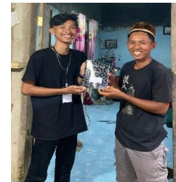
Gambar 2.3 Penyerahan buku kas pada pelaku UMKM Desa Cilimus