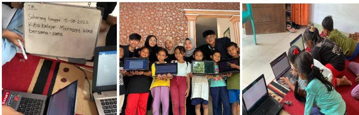
Gambar 2.6 Proses Pelaksanaan Bimbingan Belajar Anak-Anak Warga Desa Cilimus

Kegiatan bimbingan belajar bersama anak-anak warga Desa cilimus diadakan setiap seminggu sekali pada hari Selasa. Anak-anak sangat antusias mengikuti program bimbingan belajar yang kami laksanakan. Belajar bersama ini kami isi dengan materi dasar pengenalan Microsoft Word pada anak-anak. Bimbingan belajar dilakukan di posko kami juga guna mengisi kekosongan waktu kami dan diisi dengan pengalaman baru mengajar serta menambah ilmu pengetahuan baru pula untuk anak-anak warga Desa Cilimus tentang dasar Microsoft Word.