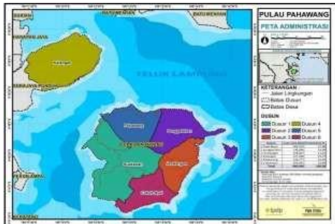
Gambar 1 Peta desa Pulau Pahawang

Desa Pulau Pahawang merupakan salah satu desa dan pulau yang berada di Kecamatan Marga Punduh Kabupaten Pesawaran, Desa Pulau Pahawang brada 10 meter diatas permukaan laut,kondisi permukaan tanahnya landau dan berbuki tmemiliki luas hampir 1000Ha ,dan berpenduduk lebih dari 1500jiwa.Desa Pulau Pahawang memiliki 6 dusun yakni sebagai berikut :