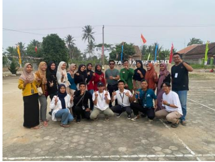
Menjadi panita lomba 17 Agustus Di Dusun 1 Sinar Jati