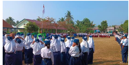
Mengikuti Upacara 17 Agustus