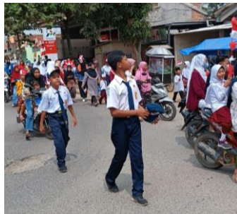
Pawai bersama warga dan SD/SMP Negri Satu Atap