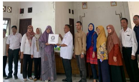
Foto pelepasan mahasiswa di Kecamatan Tegineneng