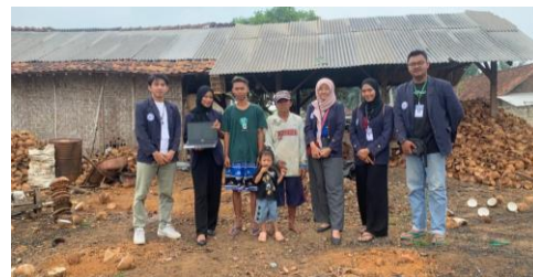
Sosialisasi ke Kopra Mas Yoga