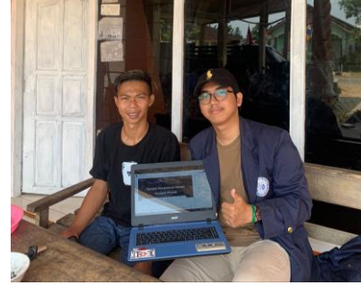
Pembuatan Web Kopra