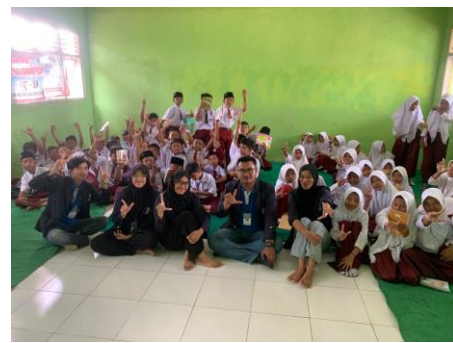
Sosialisasi ke SDN 17 Satu Atap