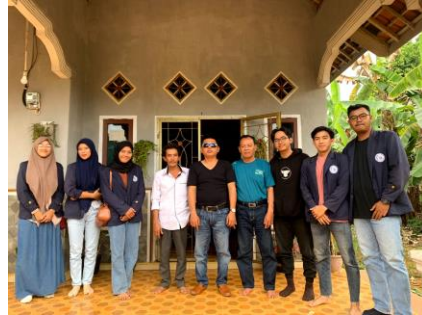
Observasi kedua melihat rumah tinggal bersama Kepala Desa