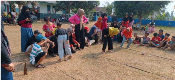
Membantu Karang Taruna Dusun Sri Rejeki mengadakan lomba 17 Agustus