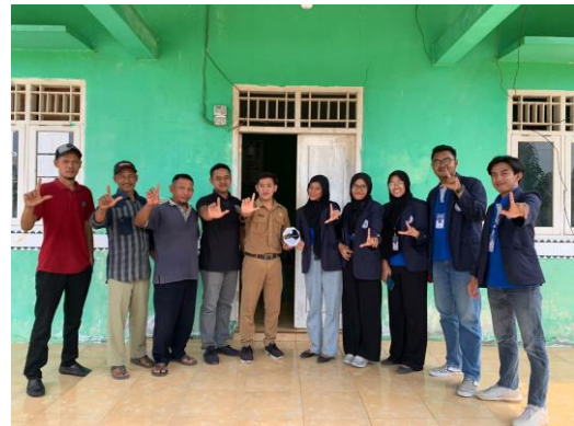
Penyerahan Plakat untuk Desa Sinar Jati