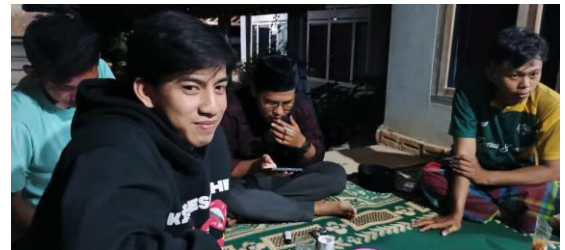
Pembentukan Panitia 17 Agustus untuk lomba di Balai Desa Sinar Jati