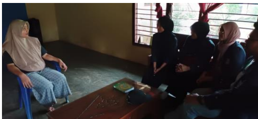
Sosialisasi ke kadus-kadus Sinar Jati