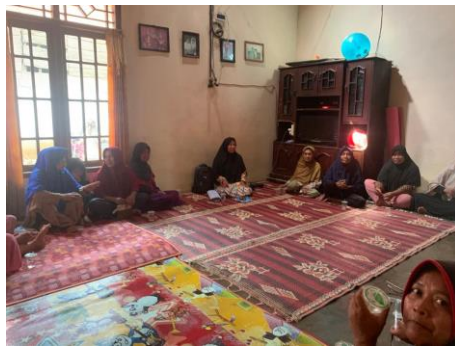
Kumpulan Bersama Ibu-ibu PKH