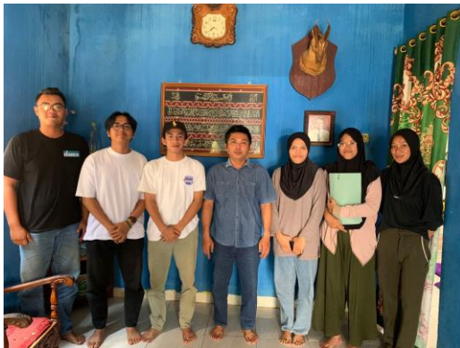
Pengisian Form Penilaian oleh Kepala Desa Sinar Jati