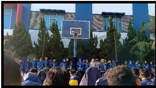
Pelepasan Peserta PKPM Semester Genap 2022/2023