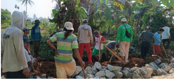
Gotong Royong bersama warga Membangun pagar masjid