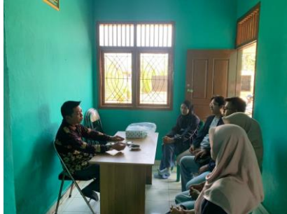
Observasi pertama Bertemu dengan Kepala Desa