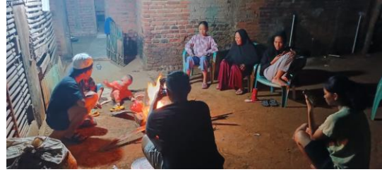
Bakar-bakar Bersama Kepala Dusun Sri Rejeki