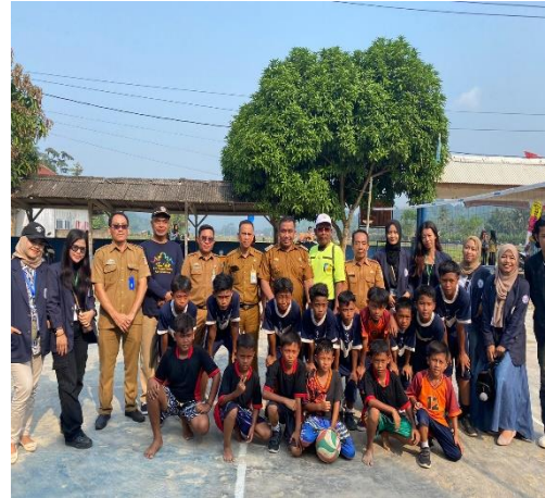
Gambar 2. 6 Perlombaan Bola Voli Tingkat Kecamatan