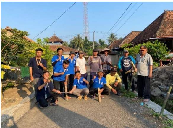
Gambar 2. 4 Gotong Royong di Desa Sukajaya Punduh

Dalam rangka mempersiapkan hari ulang tahun RI ,kami membantu kegiatan gotong royong dan mengecat bambu rambu-rambu jalan dan gapura di desa Sukajaya yang berada di dusun way awi. Kegiatan gotong royong ini berlangsung dari pagi hingga sore hari.