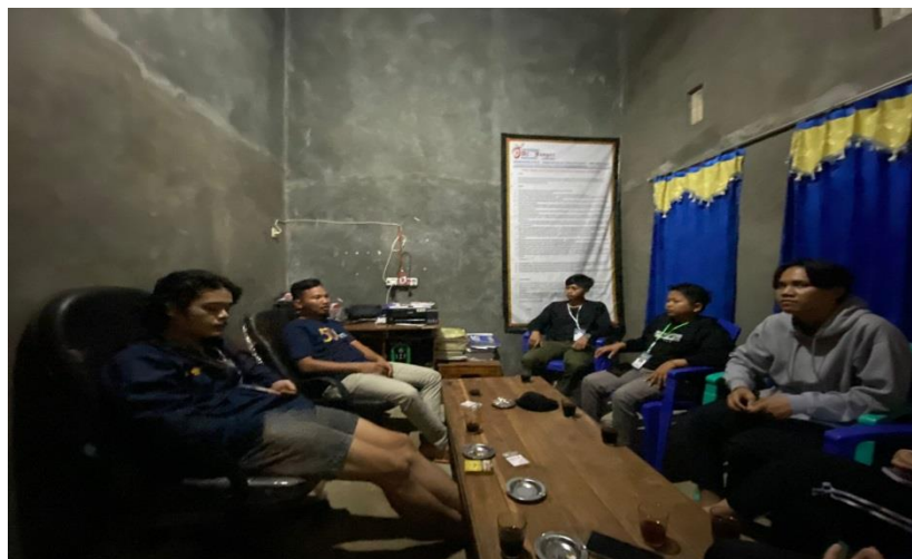
Gambar 2. 2 Pelatihan Pembuatan Gmaps