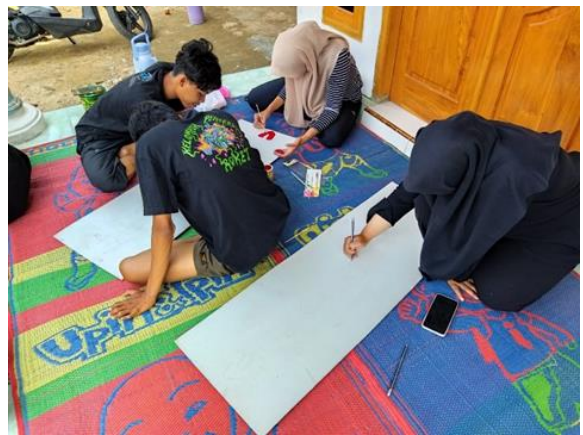
Gambar 2. 3 Proses Pengecatan Gapura