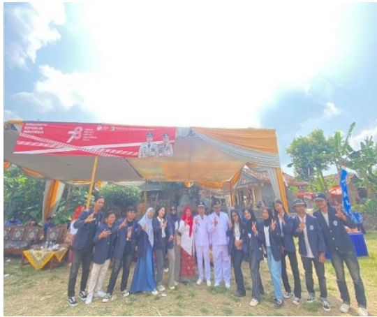
Gambar 2. 7 Upacara HUT Kemerdekaan RI

yang kami selenggarakan dikhususkan untuk anak-anak dan bapak-bapak yang berdomisili di Desa Sukajaya