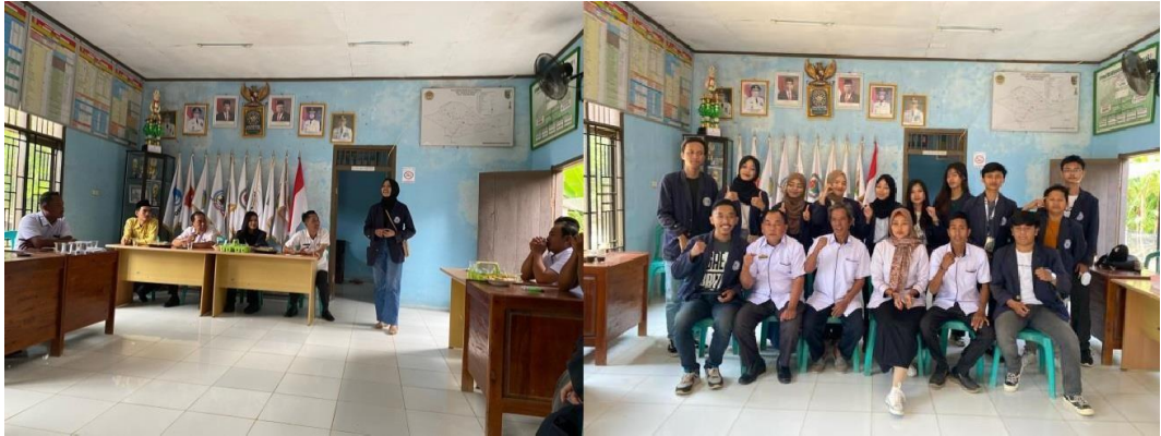
Gambar 3.1 Penyambutan di Balai Desa