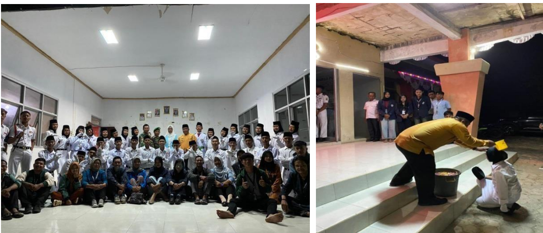
Gambar 3. 7 Pengukuhan Paskibra di Kecamatan