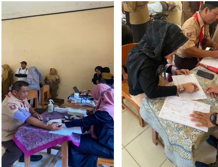
Gambar 3. 8 Panitia donor darah