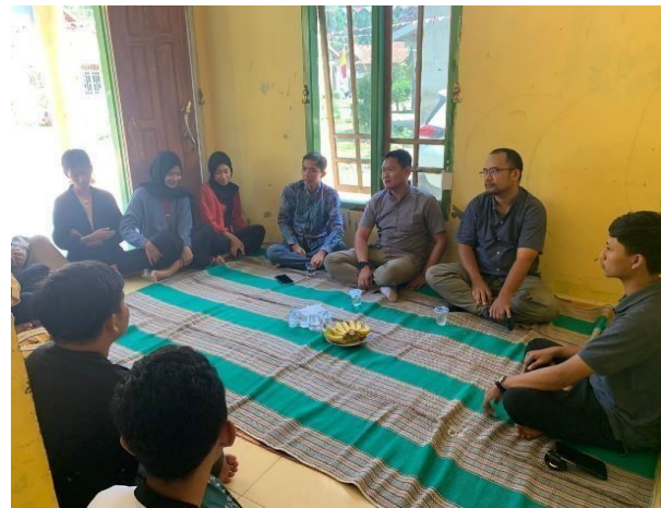
Gambar 3. 12 Kunjungan Dosen Pembimbing Lapangan