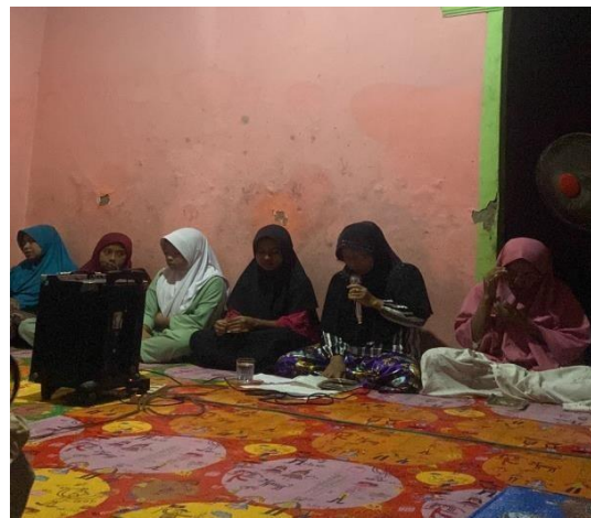
Gambar 3. 14 Pengajian Rutin