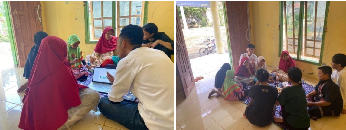
Gambar 3.2 Belajar mengajar tentang pengenalan Microsoft word pada anak SD