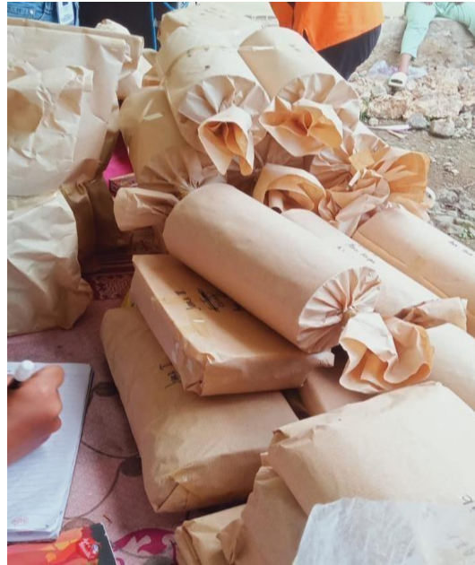
Gambar 3. 15 Pelaksanaan Perlomaan Hari Kemerdekaan