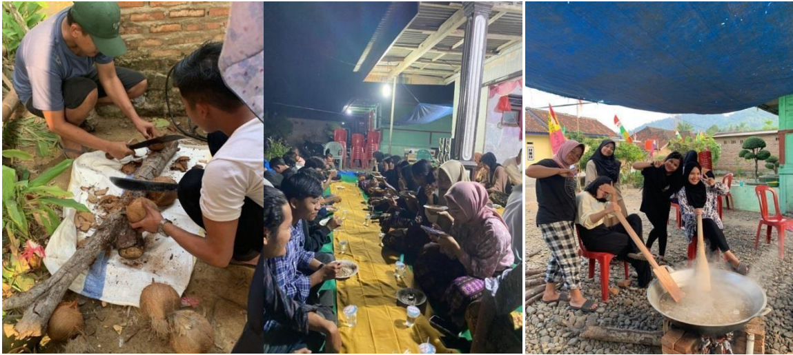
Gambar 3. 9 Persiapan dan Pelaksanaan acara Muli Meghanai