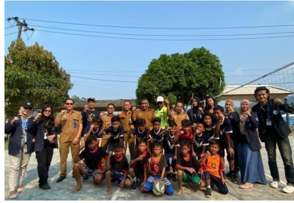
Gambar 3. 4 Panitia lomba voli tingkat kecamatan