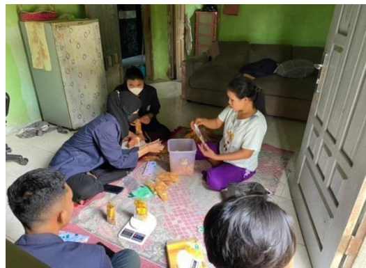
Gambar 3. 5 Kunjungan UMKM dan Proses pengemasan