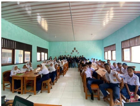
Gambar 3. 13 Penyuluhan ke sekolah-sekolah