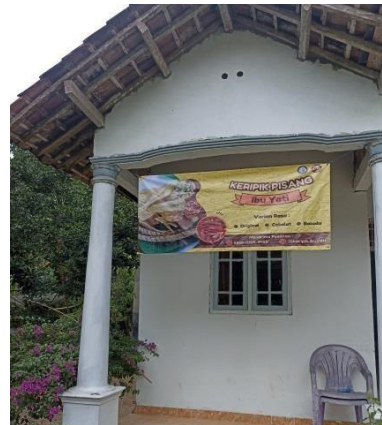
Gambar 3. 6 Penyerahan dan Pemasangan Baner