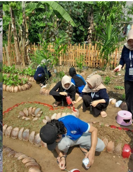
Gambar 3. 11 Gotong royong persiapan HUT Kemerdekaan Indonesia