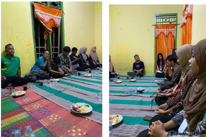
Gambar 3.3 Pemajaran progja yang akan dilakukan