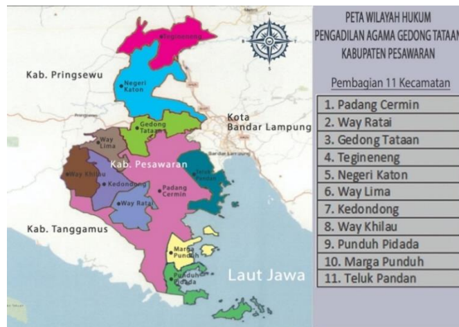
Gambar 1. 1 Peta Pesawaran