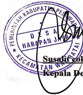
Susati Cokroaminoto Kepala Desa