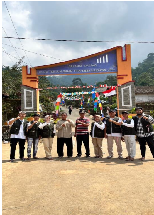
Gambar 1.1 Profil Desa harapan jaya

Desa Harapan Jaya awalnya merupakan hutan belantara yang dibuka oleh para warga transmigrasi dari Jawa Tengah pada sekitar tahun 1950an . Para warga transmigran ke daerah Lampung tidak sekaligus, melainkan secara bertahap. desa Harapan jaya di resmikan menjadi desa pada tahun 2005. Penduduk desa ini terdiri dari beberapa suku diantaranya : Jawa, Sunda, Palembang, dan Lampung, saat ini warga Desa Harapan Jaya berjumlah 2.542 Jiwa