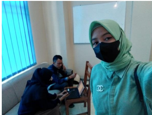
Gambar 1 Pelatihan penerimaan mahasiswa baru secara online