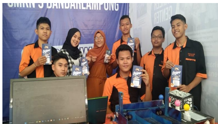
Gambar 3 Kegiatan Membagikan Flyer