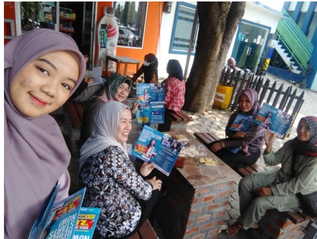
Gambar 4 Kegiatan membagikan brosur