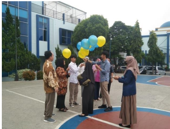
Gambar 2 Kegiatan take video