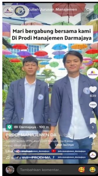
Gambar 4.4 Konten persuasif TikTok Join.Manajemen_Darmajaya