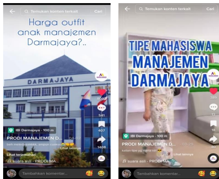
Gambar 4.5 Konten hiburan TikTok Join.Manajemen_Darmajaya