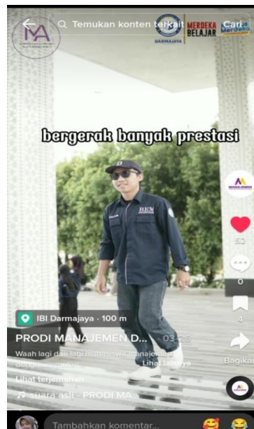
Gambar 4.3 Konten mahasiswa berprestasi TikTok Join.Manajemen_Darmajaya