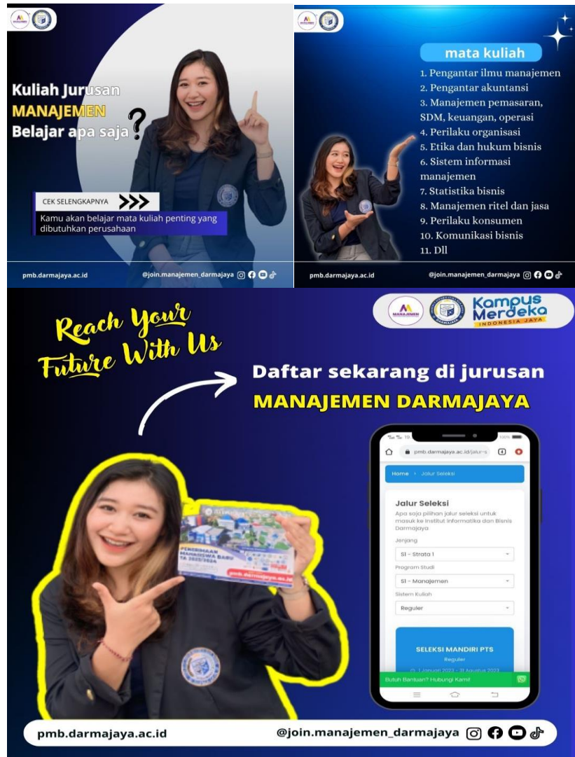
Gambar 4.6 Flyer promosi