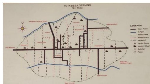
Gambar 1. 1 Peta Desa Gerning