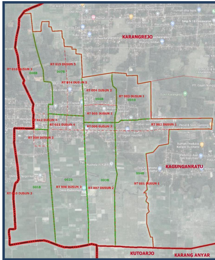
Gambar 1.1 Peta Desa Purworejo